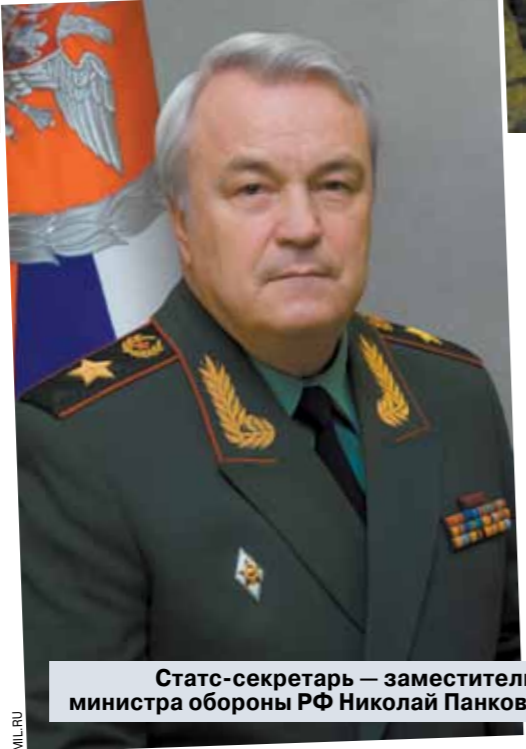
Статс-секретарь — заместитель министра обороны РФ Николай Панков.

Пока российские спортсмены бьются на футбольных полях чемпионата мира, не спадает напряжение и на трудовых фронтах Московской области. В этом убедился губернатор Андрей Воробьев, в минувшую субботу побывавший в Солнечногорском районе.