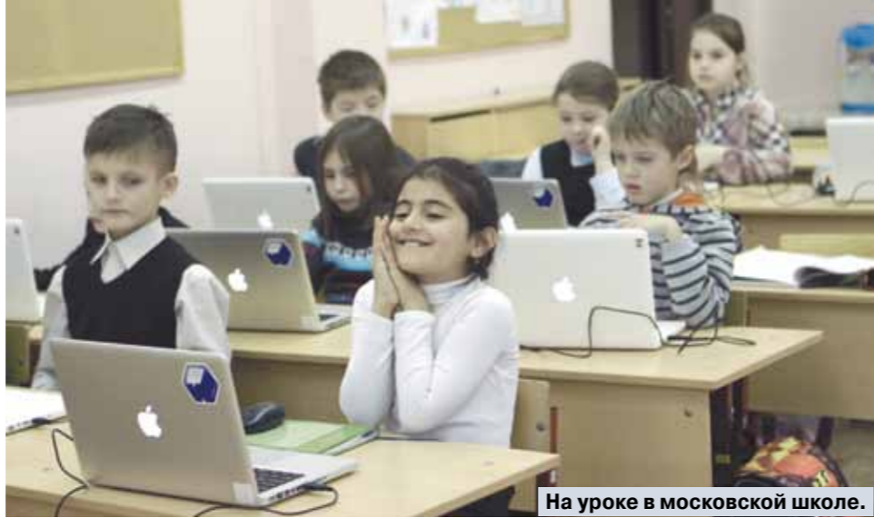
На уроке в московской школе.