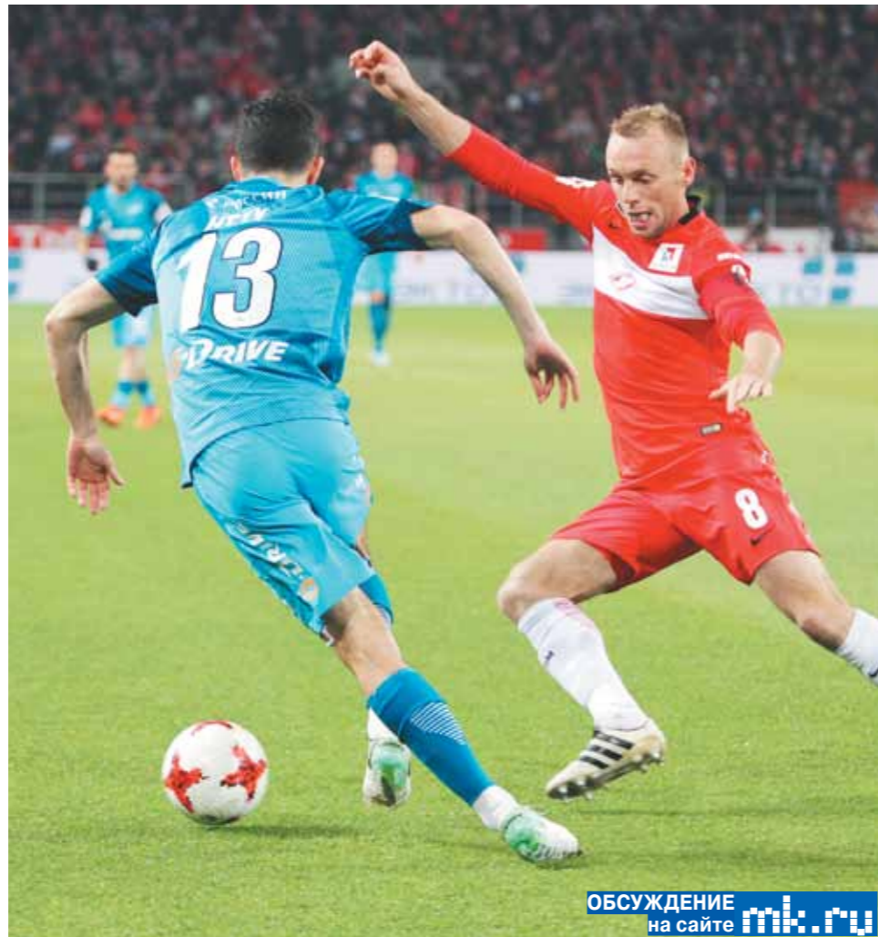
ОБСУЖДЕНИЕ на сайте mk.ru

27 ноября в 19.30 на «Открытие Арена» начнется центральный матч тура, да и вообще самое интригующее противостояние нашей Премьер-лиги. «Спартак» принимает «Зенит» с очевидным намерением победить, дабы сократить 5-очковое отставание от конкурента.