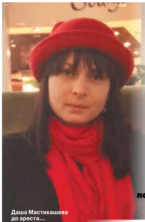
Даша Мاستикашва до ареста...