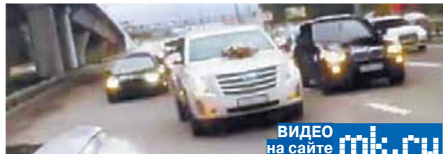
ВИДЕО на сайте mk.ru