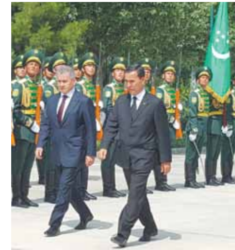
Сергей Шойгу с министром обороны Туркмени Яйлым Бердиевым.