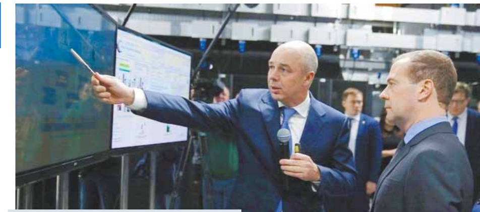
Министр финансов Антон Силуанов показывает Дмитрию Медведеву, где искать деньги.