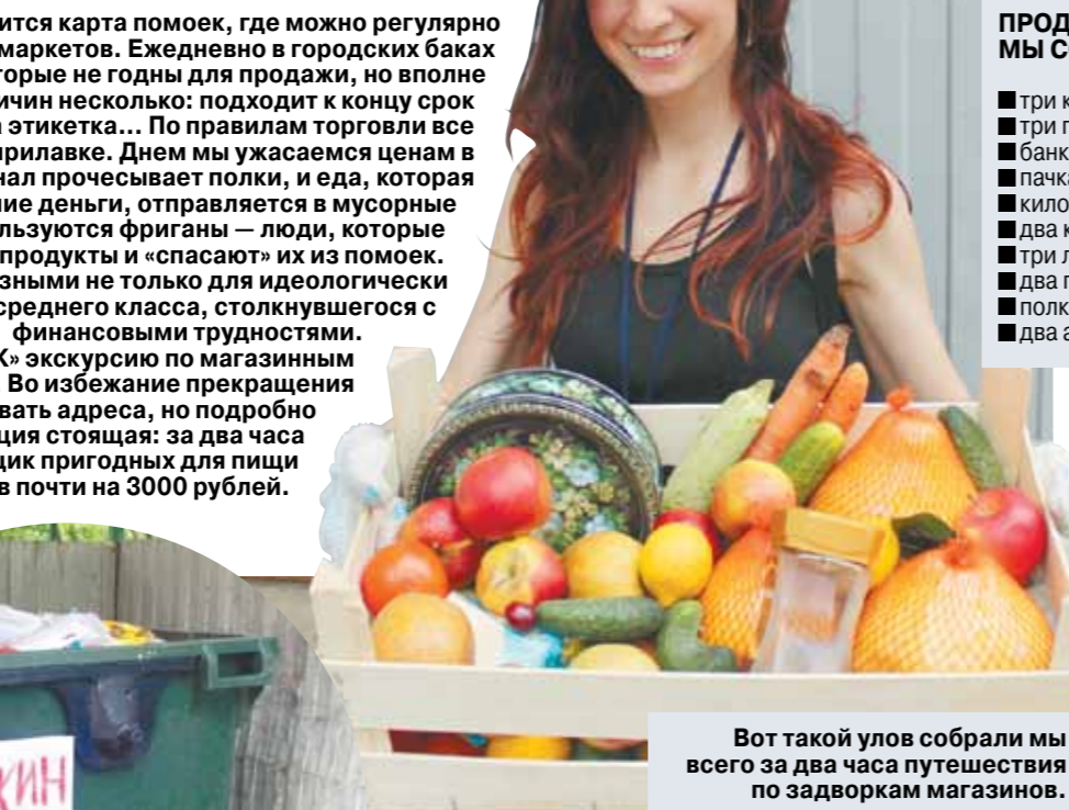
Вот такой улов собрали мы всего за два часа путешествия по задворкам магазинов.

И еще одно условие: растирать кожу надо длинными сильными движениями, начиная от конечности. По каждому участку пройтись дважды. Начать лучше с рук: с кончиков пальцев, затем растереть ладони и тыльные стороны рук.