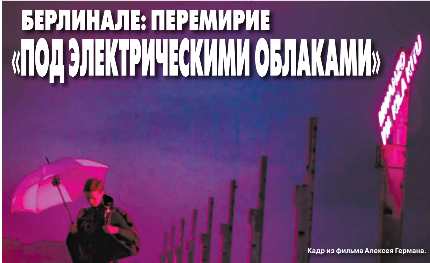
Кадр из фильма Алексея Германа.

Мне лично осточертело смотреть артхаусные фильмы. У меня ощущение, что они сделаны специально для субтитров. В них герои долго сидят, молчат, потом что-то говорят, потом опять ничего не происходит.