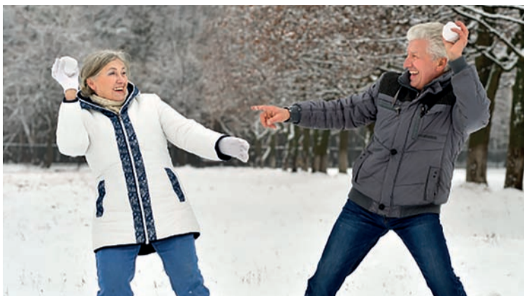
Крепкий иммунитет в любом возрасте — это доступно каждому!

«Фотонная таблетка» получила международный диплом и медаль «За высокое качество продукции», международный приз «За лучшую торговую марку», международный золотой приз «За качество и престиж» и диплом конкурса «Сто лучших