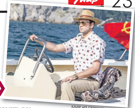
КАДР ИЗ СЕРИАЛА «КАЗАНОВА»