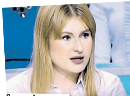
С внучкой у актрисы столько хлопот!