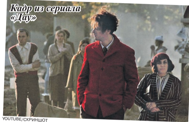
КАДР ИЗ СЕРИАЛА «ДАЙ»

чего. Все это означает одно: артисты в ближайшее время окажутся в отчаянном положении. Кто-то, наверное, активно начнет искать западные контракты, где намного выше ставки. Но найдут-то единицы! А как остальные будут зарабатывать, неясно. До пандемии звездам первой величины платили где-то 10-