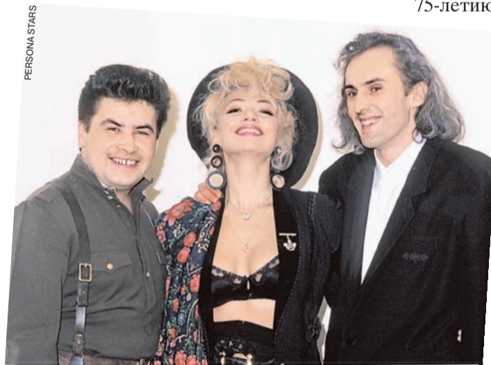
С актрисой Натальей Лапиной и Николаем Расторгуевым, 1993 год