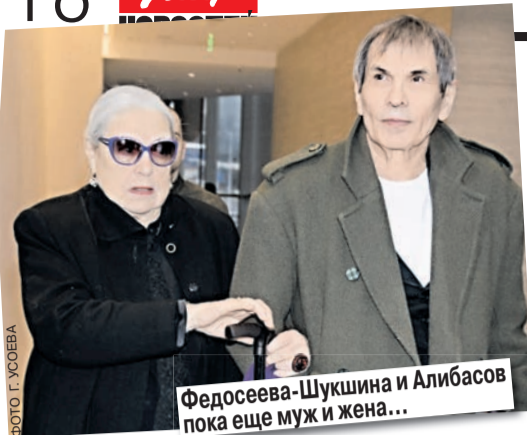
Федосеева-Шукшина и Алибасов пока еще муж и жена...