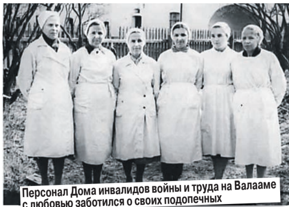
Персонал Дома инвалидов войны и труда на Валааме с любовью заботился о своих подопечных