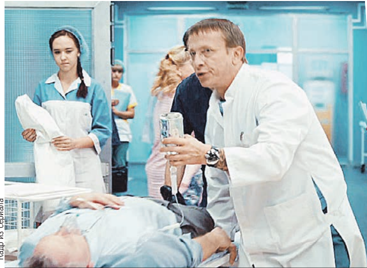
Зав. терапевтическим отделением в сериале «Интерны» Быков в исполнении Ивана Охлобыстина циничен, суров, но справедлив. Он может третировать подчиненных, но ради пациентов.

И тут возникает вопрос: а справедливо ли мы хотим видеть наших врачей подвижниками, служителями «клятвы Гиппократова», которые нам всегда и все должны, и не просто бесплатно, но и вежливо! Или мы постепенно приближаемся к «цивилизованному Западу», который так любимо при- водить в пример: «Уж там-