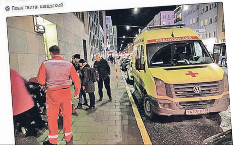
Когда питерскую бригаду «Скорой» по особому вызову послали в Стокгольм, наши медики, приняв своего пациента, не смогли проехать мимо упавшего шведа и оказали помощь на месте, вызвав изумление скандинавов...