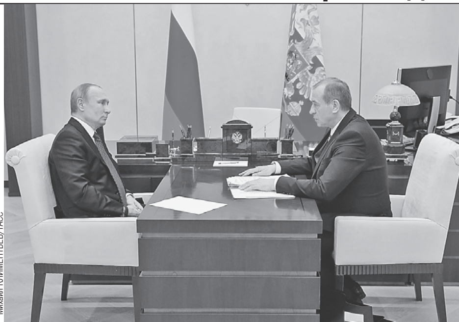
Губернатор Иркутской области Сергей Левченко попросил Владимира Путина помочь построить в столице региона ледовый стадион к чемпионату мира по хоккею с мячом. Президент пообещал сделать это.