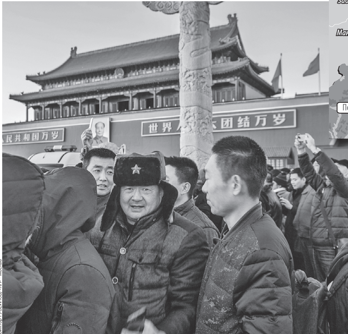
На главной площади Китая, где стоит и мавзолей Мао Цзэдуна, толпа народа, желающего ему поклониться, куда больше, чем очередь в Мавзолей Ленина в Москве.

- Власти поняли, к чему это идет, и сейчас пытаются закрутить гайки, - продолжает эксперт. - Но, слава богу, китайцы, нахлебавшись капитализма, начинают уважать Мао Цзэдуна даже сильнее, чем в России Сталина. И эту тоску по сильной руке компартия отлично эксплуатирует. На предприятиях возрождается традиции хунвейбинов - «часы самокри-