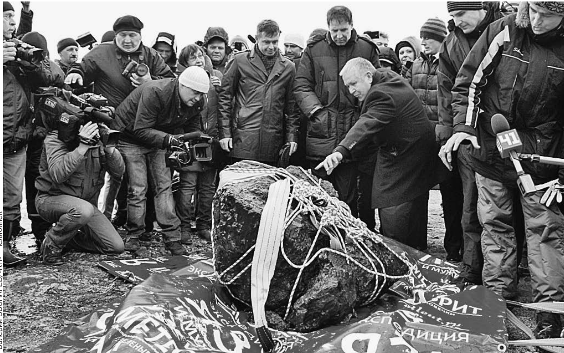
Это самый большой обломок челябинского метеорита - тот самый, который достали из озера Чебаркуль. А тонны более мелких рассыпались по тайге.