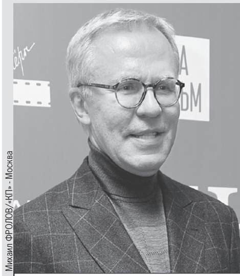
Фетисов верит в команду.

- Матч против США понравился, - говорит Вячеслав Фетисов . - Красивый хоккей, постоянное давление на соперника. Видно, что команда находится в хорошей физической форме. Превосходили американцев во всех компонентах игры. У соперника шансов не