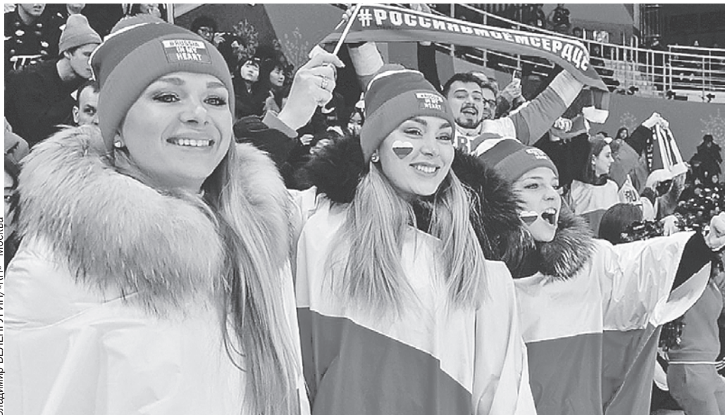
Российские болельщицы на олимпийской трибуне: красота спасет мир. И спорт...

Разумеется, когда 5 декабря Россию как государство отстранили от Олимпиады, расчет был именно на то, что в этой горячке нам не хватит времени на суды. И что мы ухватимся за самое глупое и постыдное,