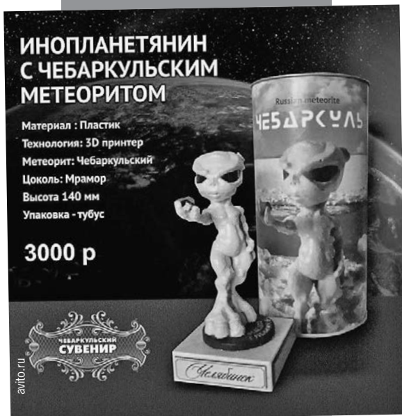
Типичный суровый челябинский сувенир: инопланетянин и кусок метеорита.

Златоустовская оружейная компания «АиР» выпустила набор изделий с вкраплениями метеорита: от недорогой серебряной монеты до композиции за 140 тыс. руб. Смотрится эффектно.