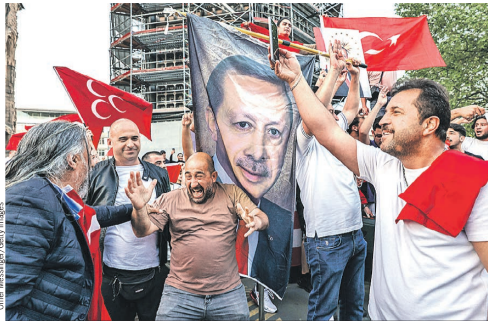
Странники Эрдогана празднуют его победу. Турецкий лидер останется на посту президента еще пять лет.

Реджеп Тайип Эрдоган стал победителем второго тура выборов президента Турции, объявил ЦИК республики. Он набрал 52,2% голосов, тогда как его соперник, единый кандидат от оппозиции Кемаль Кылычдароглу - 47,8%. Перед воскресным голосованием большинство аналитиков в один голос называли фаворитом именно Эрдогана, после того как в первом туре ему не хватило всего лишь полпроцента голосов, чтобы обеспечить себе чистую победу. К тому же главу государства поддержал третий кандидат, выбывший из президентской гонки Синан Оган , который в первом туре набрал 5%.