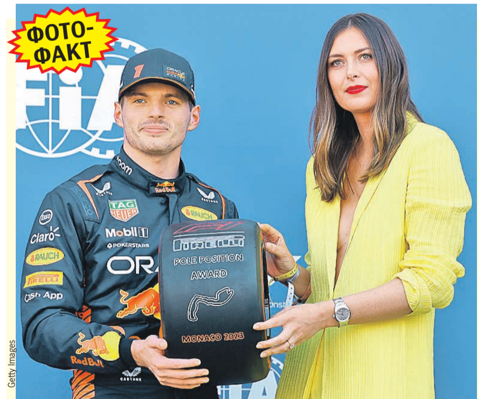
Мария Шарапова в откровенном наряде впервые после родов появилась на спортивных соревнованиях в качестве почетного гостя. Знаменитая теннисистка наградила гонщика «Формулы-1» Макса Ферстаппена за победу на Гран-при Монако.