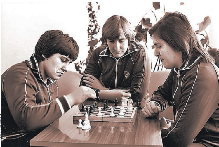
Олимпиада 1980 года подарила не только чемпионов, но и новые слова, например, «олимпийка».

- Накануне соревнований в СССР стали выпускать свитера с молнией, которые окрестили олимпийками. Не расшифруют сейчас и слово «менингитка». Это шапочка: родители пугали, что если ребенок выйдет без нее, то заболеет менингитом.