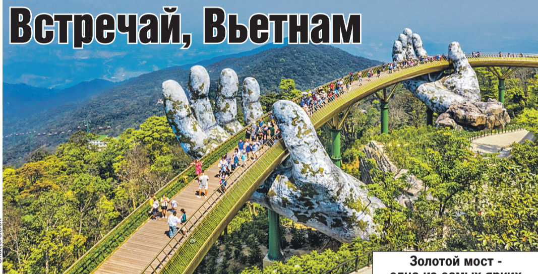
Золотой мост - одна из самых ярких достопримечательностей Вьетнама.