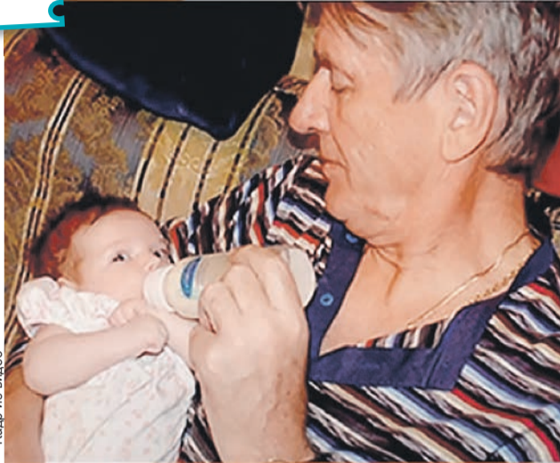
С долгожданной дочкой актер смог побыть всего девять месяцев.