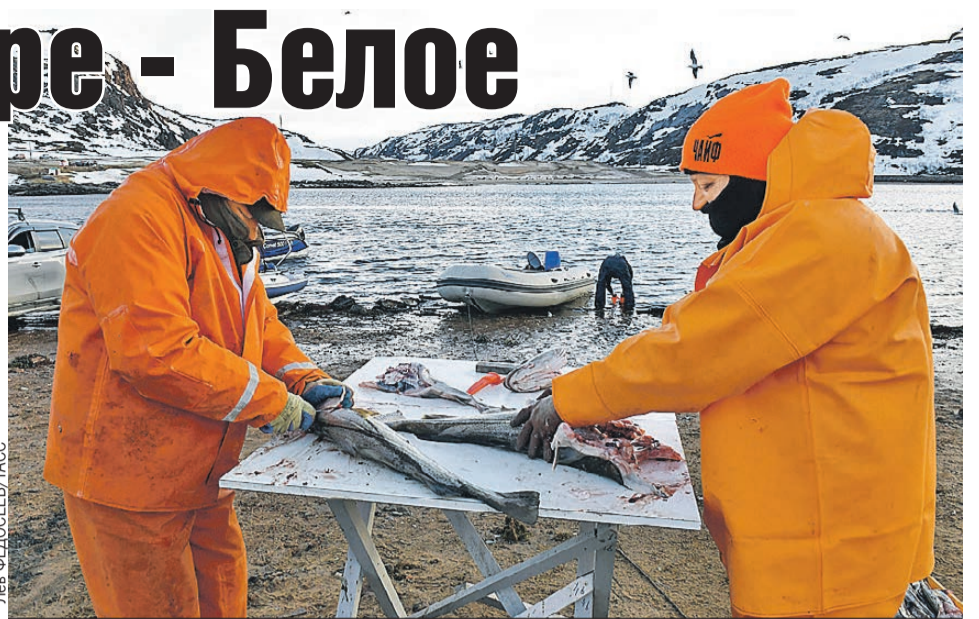
В Териберке туристы могут отправиться на рыбалку за красной рыбой.

Спросите, зачем ехать не на Черное море, а к Баренцеву и Белому морям? Ну, например, за романтикой. На Терском берегу (считай, юг полуострова) есть своя пустыня в Кузомени, знаменитый табун диких лошадей и аметистовый берег. На ледоколе «50 лет Победы» летом можно отправиться в 12-дневное путешествие к Северному полюсу. Звучит экстремально, но на самом деле это очень комфортная поездка: теплую одежду выдадут, вкусно накормят. Захочется экстрима - можно выйти на льдину и искупаться в Северном Ледовитом океане. Правда, стоимость путешествия кусается: