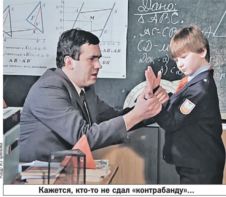
Кажется, кто-то не сдал «контрабанду»...

Некоторые слова исчезли вместе с явлениями. Современные дети не знают про промокашки и чернильницы. Канули в Лету и названия некоторых уроков. Например, чистописания (когда учили писать пером). Или оценки за прилежание (насколько