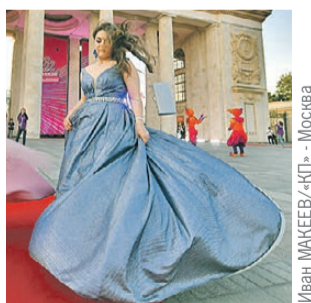
Иван МАКЕЕВ/«КП» - Москва

Чем старше выпускник, тем выше траты. Так, агентство Superjob выяснило среднюю сумму, которую