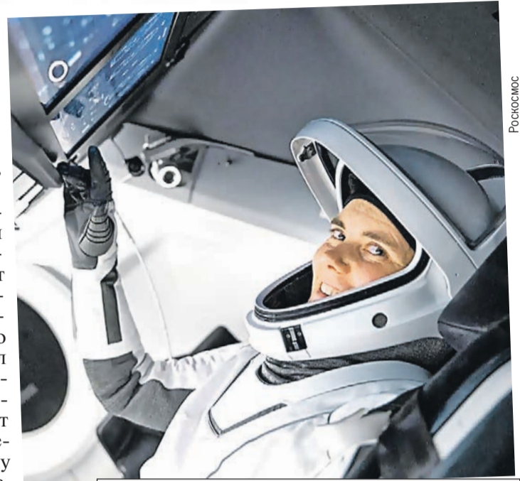
Анна Кикина первой из российских космонавтов летала на американском Crew Dragon.