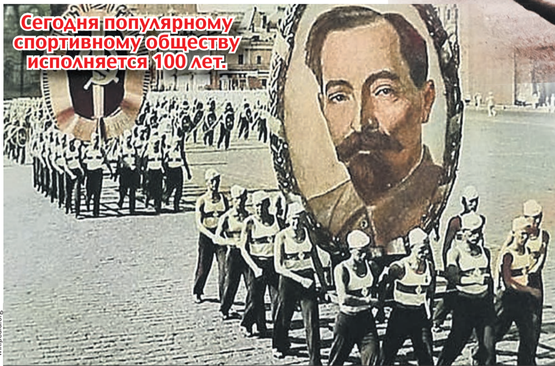
1936 год. Красная площадь. Спортсмены старейшего российского общества «Динамо» на параде физкультурников несут портрет Феликса Дзержинского.

Сегодня популярному спортивному обществу исполняется 100 лет.