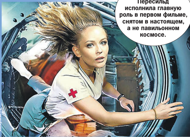
Актриса Юлия Пересильд исполнила главную роль в первом фильме, снятом в настоящем, а не павильонном космосе.