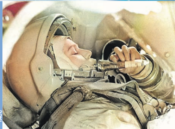
Валентина Терешкова после полета стала настоящей звездой.

Ожидается, что полетит космонавтка из Белоруссии на МКС на борту корабля «Союз МС-25» в 2024 году.