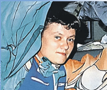
Светлана Савицкая первой побывала в открытом космосе.