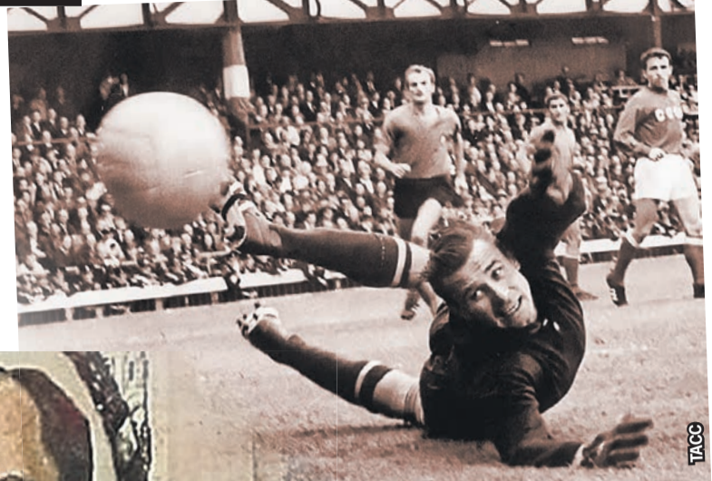
Вратарь «Динамо» и сборной СССР Лев Яшин в 1963 году был признан лучшим футболистом мира.

Хотелось бы, конечно, чтобы и футбольный клуб «Динамо» вспомнил традиции - и победный матч 1945 года, и бесковское «Динамо», - про-