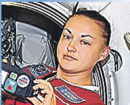
Елена Серова первой из космонавток побывала на МКС.