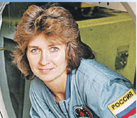
Елена Кондакова стала первой женщиной в длительном полете - в одной из командировок провела на орбите 169 суток.