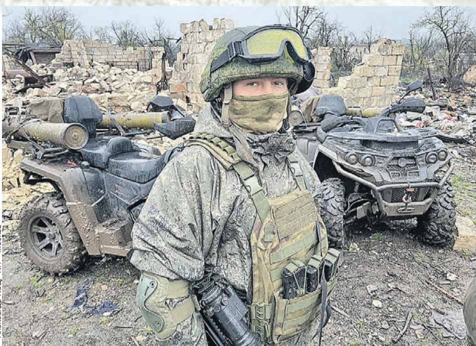
Боец с позывным «Коммерс» был бизнесменом, а теперь гоняет на квадроциклах с противотанковыми ракетами и кошмарит врага.

- С женой в Красноярске катались на снегокатах и квадроциклах. Знакомая тема, - улыбается он под маской. - Машина хорошая. Можно и пехоту возить - три-четыре человека, если ракет нет. А с ракетами - выявляем позицию врага, подъезжаем на точку,