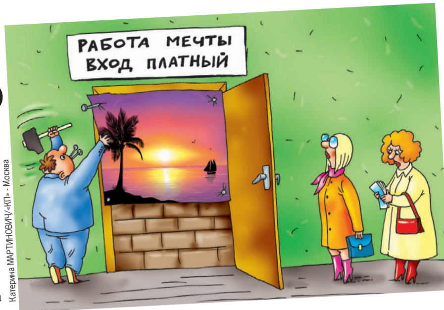
Катерина МАРТИНОВИЧУ «КП» - Москва

В мечтах примеряем купальники. Клик - и мы на главной странице сайта с ярким заголовком: «Доход на маркетплейсах от 100 тысяч рублей в месяц!» «Маркетплейс» - слово новое, но нам знакомое - интернет-магазин. Уже, конечно, обещают не 300 тысяч, но все равно хорошо. Наш новый работодатель рассказывает о плюсах будущей карьеры и среди прочего роняет: мол, обучение нужно купить. Мы грустнеем, но добрый парень успокаивает: прямо сейчас курс будет стоить всего 27 рублей (это не опечатка!) вместо 900. Что скупиться, инвести-