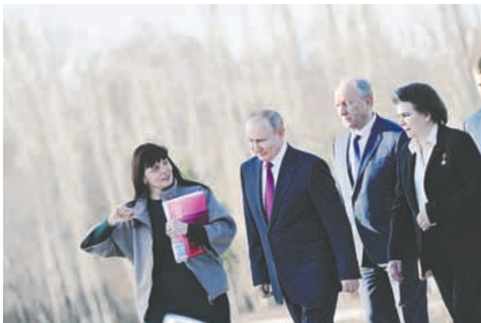
Президент Владимир Путин лично ознакомился с результатами реализации нескольких проектов - осмотрел аэропорт «Гагарин» и Музей покорителей космоса.

Отремонтировано большое число медицинских учреждений, открыты десятки ФАПов в селах, поставлены тысячи единиц нового оборудования, включая тяжелое.