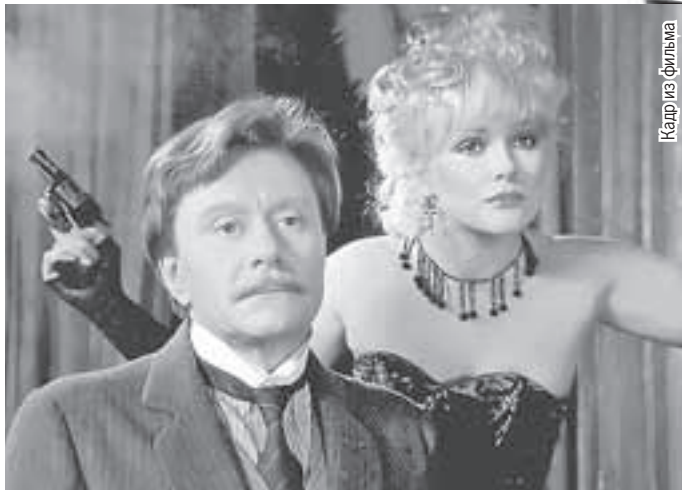
Мисс Диана, наивная и очаровательная, в нее невозможно было не влюбиться (с Андреем Мироновым в картине «Человек с бульвара Капуцинов», 1987 г.).

Александра Евгеньевна не снималась с 1990-х. И те, кто