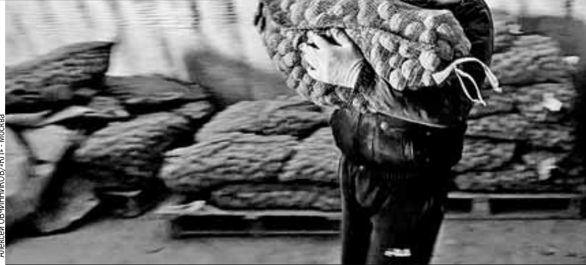
Погрузка семенного картофеля идет непрерывно: кому 8 тонн, кому 10. Посевная!

таж! Причем на отечественные сорта, например, к сорту «Голубизна» снова интерес проснулся, до 50 тонн с гектара убрать можно, а еще эта картошка вкусная и рассыпчатая. Скоро займемся размножением собственного сорта - «Михайловский», который назвали в честь поселка. Сын с коллегами вывел! Сейчас сорт государственные испытания проходит... Егор вам лучше расскажет.