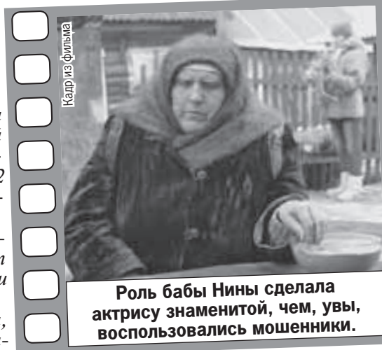
Роль бабы Нины сделала актрису знаменитой, чем, увы, воспользовались мошенники.

решать все проблемы. Взяли с нее подписку о неразглашении обстоятельств съемок. Актриса это вполне устроило, потому что позволяло сохранить инкогнито и избежать назойливого внимания поклонников. Это стало особенно актуально, когда сериал набрал популярность.