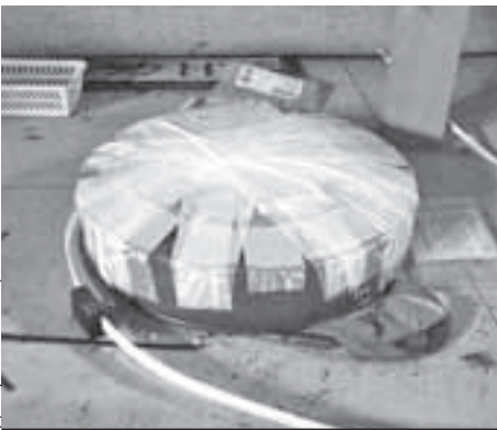
Эту «особую» мину наш спецкор обнаружил в образовательно-религиозном центре «Пилигрим».

Но все, что сделано человеком и им же сломано, можно починить.