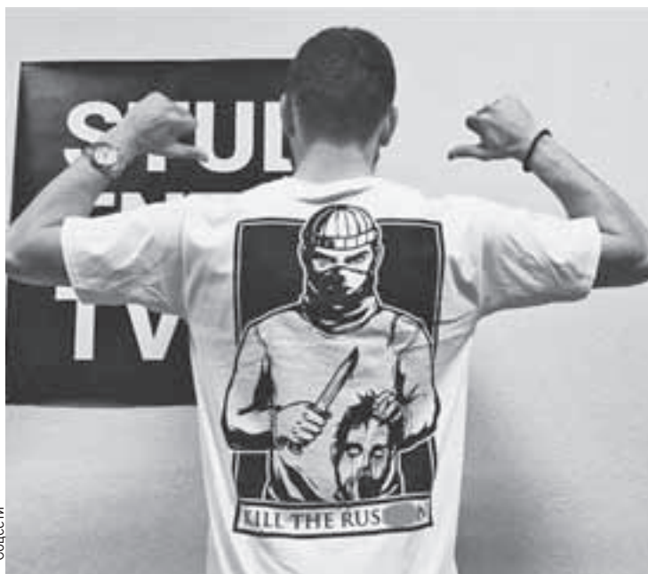
Новый терроризм выглядит так: украинцы торгуют майками «Убей русского», а американцы это поощряют.

С украинскими нацистами все понятно. Понятно и с Западом.