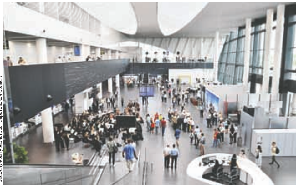
Саратов наконец-то получил современный аэропорт - за 2021 год через него прошло порядка 1 млн пассажиров.

Красивые и комфортные общественные пространства позволяют выглядеть более привлекательно в глазах инвесторов, которые охотнее вкладывают деньги в уже развитые территории. Но это для чиновников, а для нас, жителей, это возможность получить удовольствие от прогулки, а также возможность не стесняясь провести экскурсию по своему городу для знакомых из других регионов или даже стран.