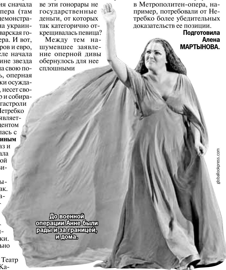
До военной операции Анне были рады и за границей, и дома.