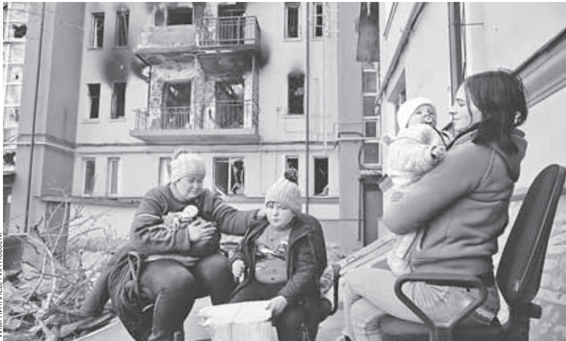
В Мариуполе женщины и дети успели выучить основные правила выживания. И надеются, что вскоре эти навыки окажутся не нужны.

- Район не зачищен, в штабе говорили за него. Наши проскочили чуть вперед, а что сзади оставили - не очень понятно. И нацики