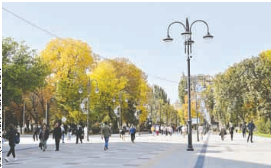
За последние годы во многих населенных пунктах области появились современные зоны отдыха. Включая, конечно, и Саратов.

Комплексное развитие городского пространства сегодня охватывает не только крупные города, но и все