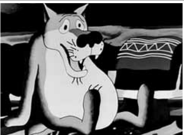
Кадр из мультфильма

«Она любит выпить - этим надо воспользоваться!»: слова похотливого судьи Криггса из комедии «Здравствуйте, я ваша тетя!» до сих пор многими воспринимаются как самые надежные рекомендации по охмурению женщин.