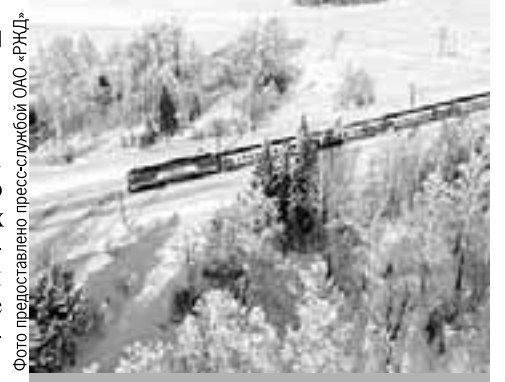
От зимы можно уехать на поезде.

Передвигаться на поезде можно и максимально оградив себя от контактов с другими людьми. Весь вагон выкупить вряд ли получится, но приобрести отдельное купе - вполне. Для таких «оптовиков» действуют скидки - от 5 до 30%. Все зависит от дня недели, в который пассажир хочет поехать, и типа вагона. В праздничные и выходные дни размер скидки меньше. Поэтому есть стимул путешествовать в будние дни (со вторника по четверг). Тогда размер скидки будет больше, а попутчиков - меньше. В период пандемии это тоже важно.