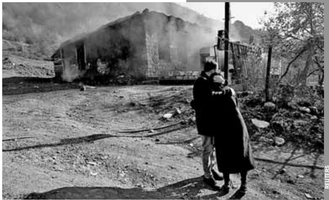
Уходя из Кельбаджарского района (он передается Азербайджану), армяне жгут дома... Но правда еще и в том, что 25 - 30 лет назад из этого же района были изгнаны 55 тысяч азербайджанцев...

- Слил. Армянский народ его очень поддерживал. Людям так надоела предыдущая власть, что готовы были избрать любого. Но Пашинян никаких антироссийских шагов не делал. Не выходил ни из каких организаций с Россией. А вот у Баку антироссийские планы - они кладут регион под Турцию.