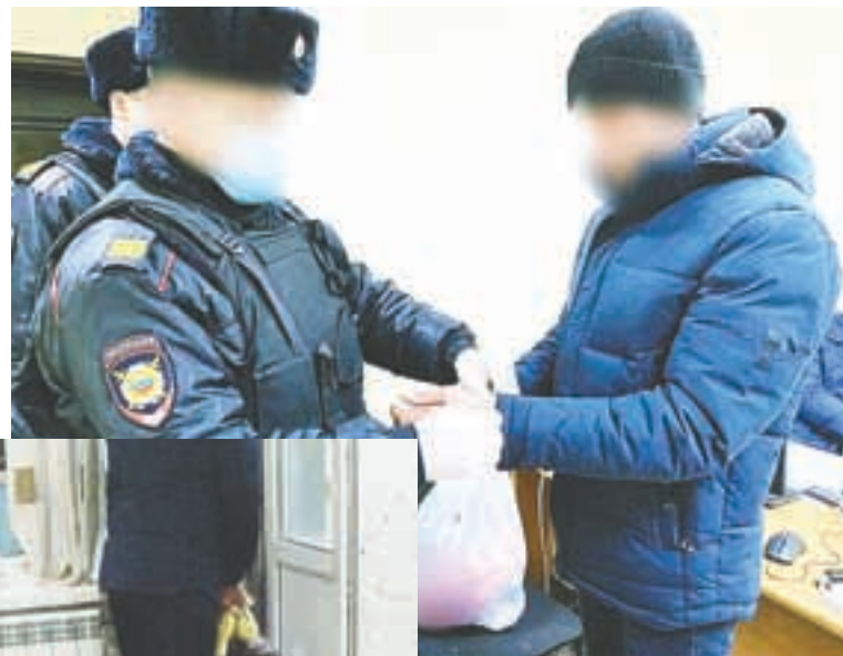
Подозреваемого задержали в Аткарске, где он пытался скрыться.