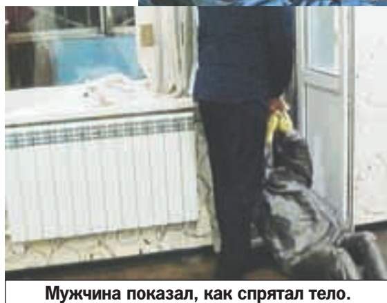
Мужчина показал, как спрятал тело.