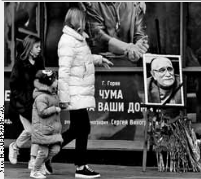
Все выходные люди несли цветы к Театру Армена Джигарханяна на Ломоносовском проспекте.

В минувшую субботу не стало одного из самых любимых в нашей стране актеров (читайте на стр. 14 - 15):