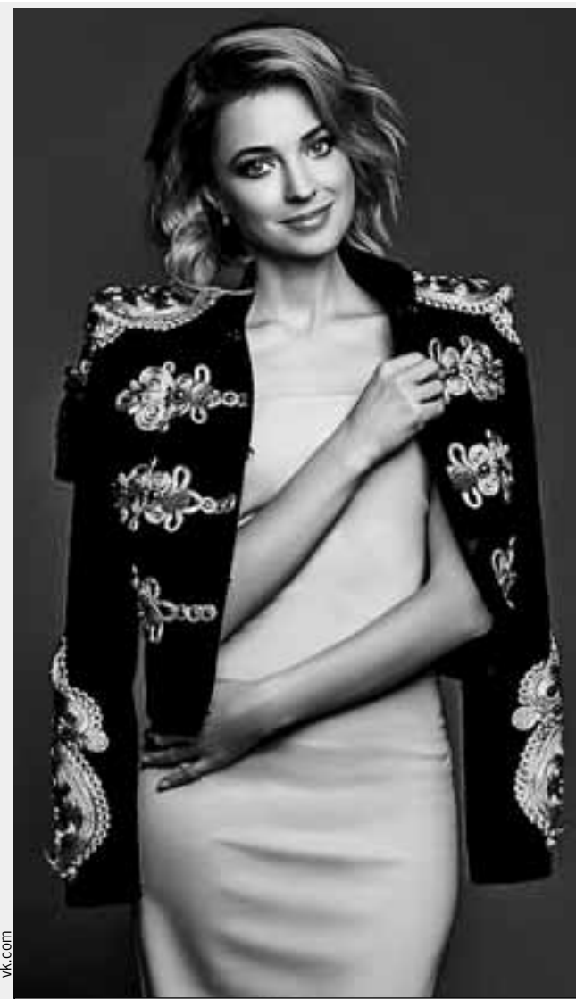
Такой Наталью мы еще не знали!

«Вопрос дня» о других кандидатах на участие в этом конкурсе — на < стр. 3.