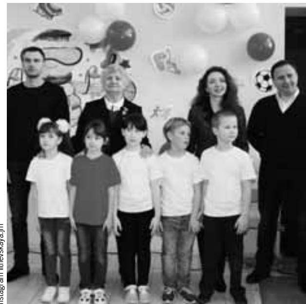
Именитые спортсмены и депутат поддержали участников спартакиады.

В администрации Балаковского района уточнили, что речь о подрядной организации «Т Плюс» - ООО «Феникс». При этом составлен не один