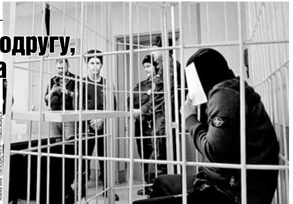
Алена МАРТЫНОВА, «КП» - Новосибирск

Убийца закрывает лицо. Смелым он был только с беззащитной женщиной.