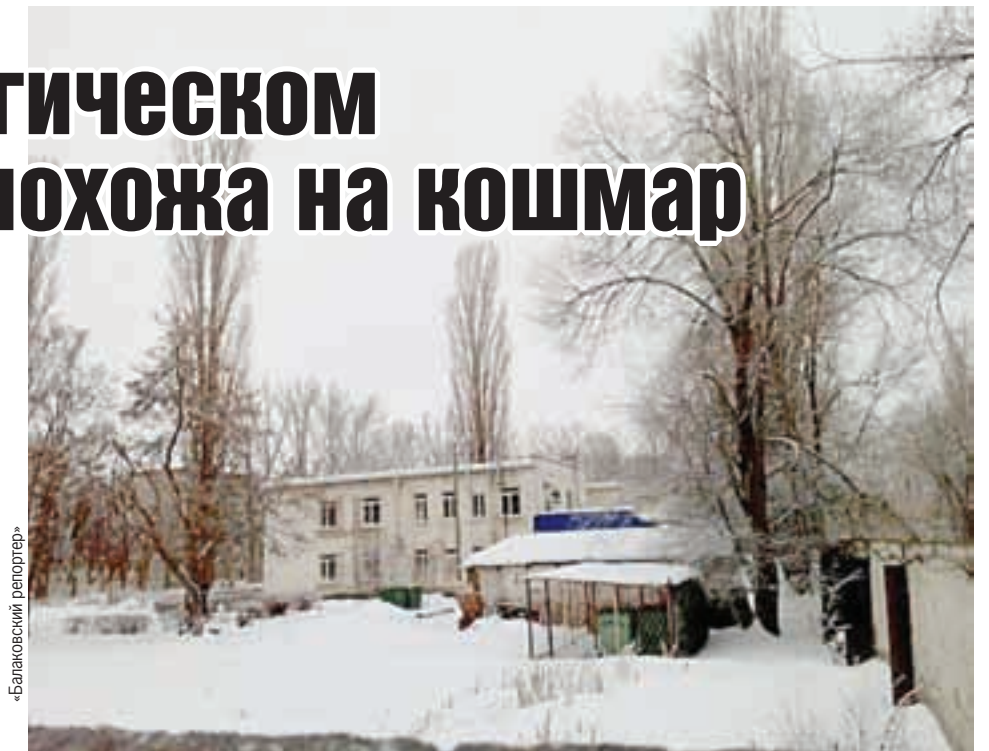
Издали здание психоневрологического диспансера кажется заброшенным.