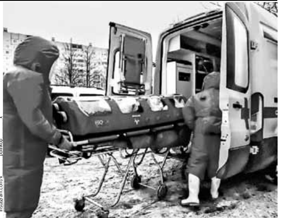
В капсуле, по словам девушки, страшно и душно.

- Оба пациента находятся под жестким наблюдением, изолированы, им оказываются необходимая помощь, - отчитывается глава штаба