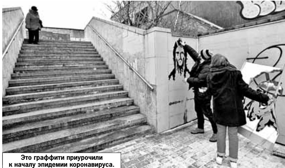
Это граффити приурочили к началу эпидемии коронавируса.

Пытаюсь обрулить пробки, чтобы выехать к Академии наук, и обдумываю услышанное. Действительно, все очень странно. Я, например, уже год наблюдаю из окна электрички Савеловского направления надпись «Бей ж...», спасай Россию!» и километры - это не преувеличение - разноцветной американской графферской мази. Неопрятная мазня, настоящая чума больших и не очень городов, пытается донести до нас какие-то смыслы, рожденные в мозгах, сожженных метамфетамин и крэком на другом континенте. И никому до этого дела нет. А от рисунков на христианскую тематику у кого-то сразу подгорает. Значит, художники попали в точку. Главное, чтобы не было равнодушных?