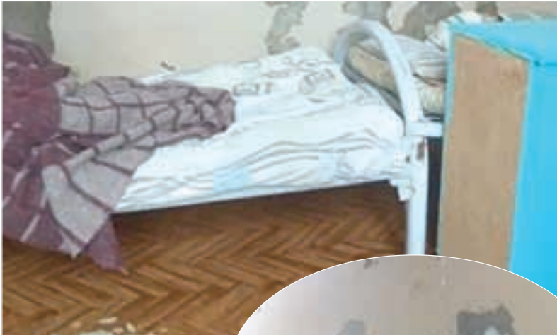
Такая обстановка глаз не радует.