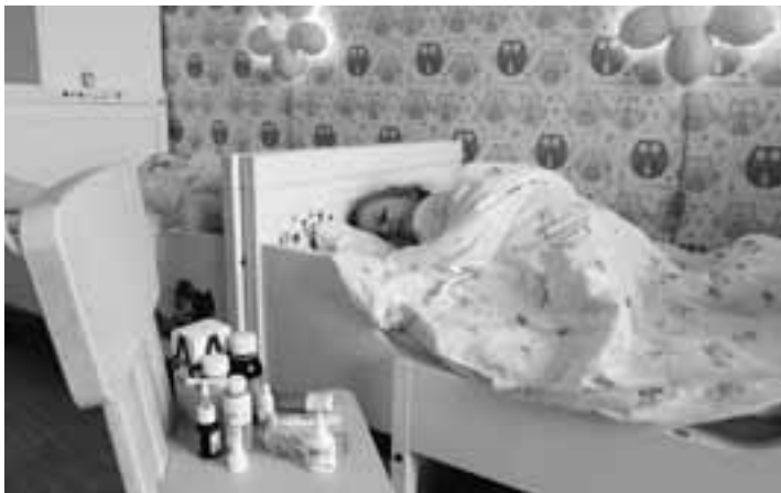
Чтобы остановить рост заболеваемости, детей в сотнях школ области отправили на карантин.

Наиболее опасен вирус для детей, людей с хроническими заболеваниями легких и сердечно-сосудистой системы, тех, кто старше 60 лет, беременных, работников общественного транспорта, общепита, а также медицинских учреждений.