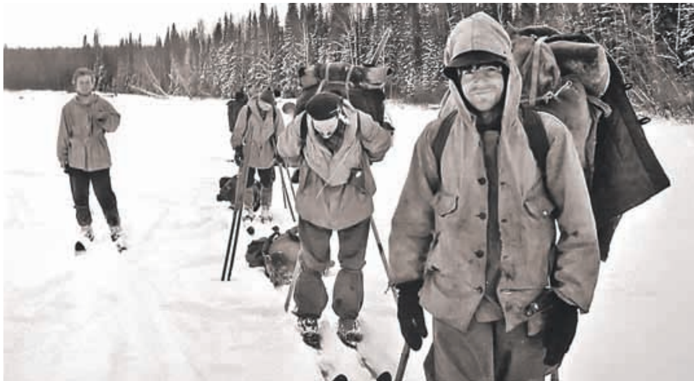
Этот снимок уральских туристов сделан как раз перед началом их последнего похода. Читайте на стр. 10 - 11 ▶