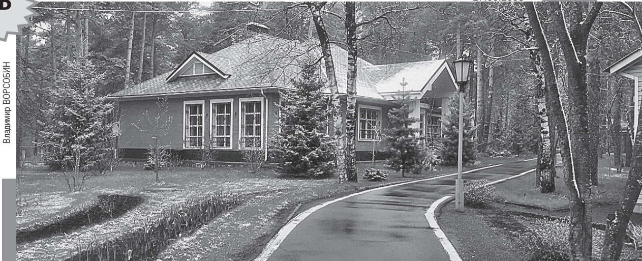
Этот аккуратный одноэтажный дом и есть загородная резиденция Тулеева. На крыльце - инвалидная коляска...

Почему из Кузбасса бегут люди (население области уменьшается на 5 - 10 тысяч человек ежегодно)? Почему у