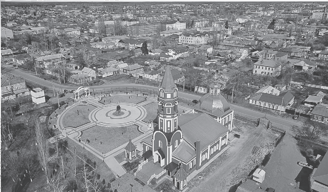
Центр Борисоглебска. Для жителей Балашова этот город в соседней Воронежской области является примером для подражания и предметом тихой зависти...