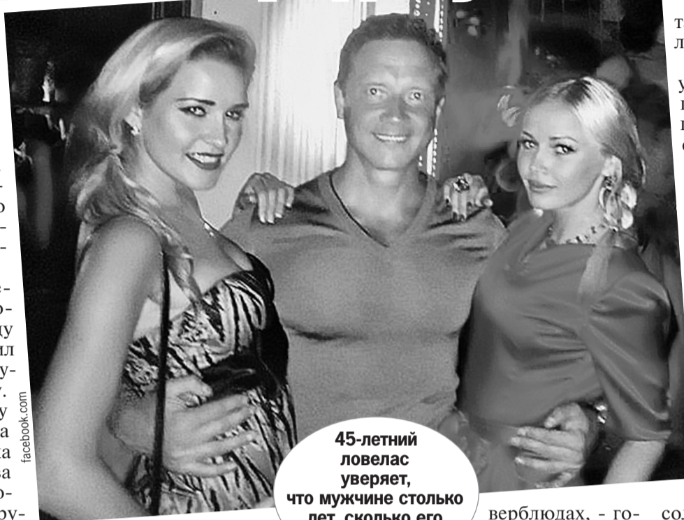
45-летний ловелас уверяет, что мужчине столько лет, сколько его девушкам.

- Никаких иллюзий по поводу того, что меня посадят, я не питал. В один прекрасный день мне повезло: забыли переподписать подписку о невыезде. Я вышел от