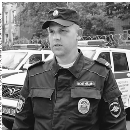
ГУ МВД по Санкт-Петербургу и Ленинградской области

Гости из Перу приехали в Россию поддержать родную команду. А в перерывах между матчами отправились в Северную столицу. Практически целая перуанская диаспора обосновалась в хостеле в Керченском переулке. Но в первую же ночь в гостинице произошло ЧП. По предварительной версии, закоротило проводку. Огонь моментально распространился по старому зданию. Большинство болельщиков продолжали спать. А те, кто почувствовал запах гари, не предупредив остальных постояльцев, побежали на улицу.