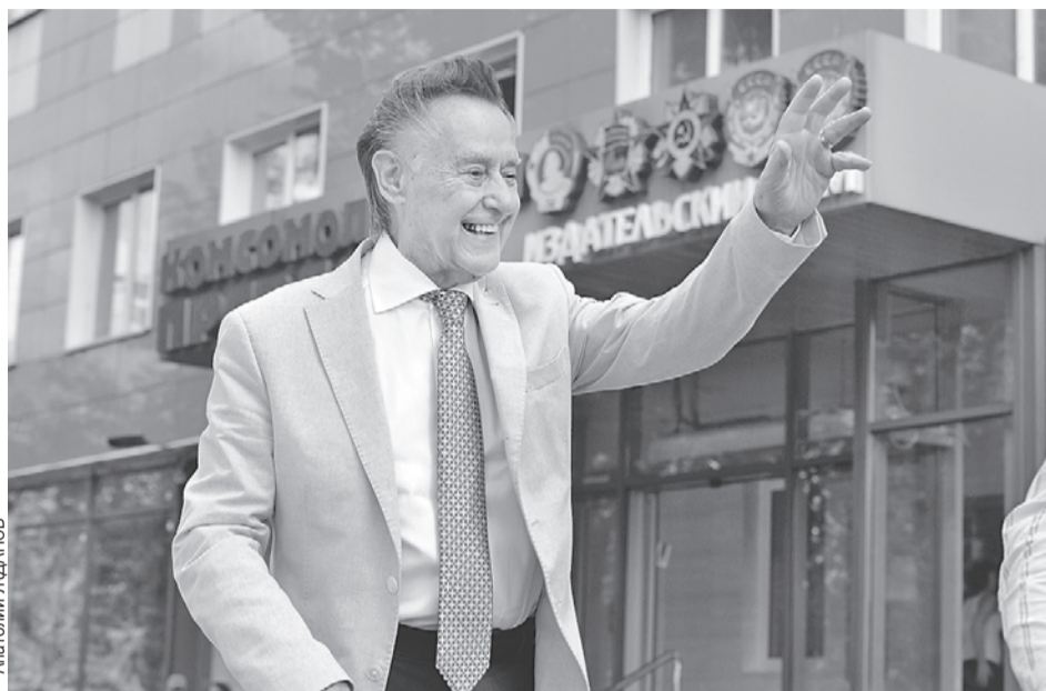
Андрей Дмитриевич готовил большую программу к своему 90-летию 16 июля. Теперь подарком ему будет наша память. На фото - поэт в гостях у «Комсомольской правды» в июле 2013 года.