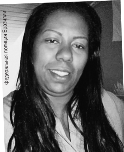
Федеральная полиция Бразилии

Чтобы накрыть банду, бразильские полицейские даже просили помощи у военных. И все равно