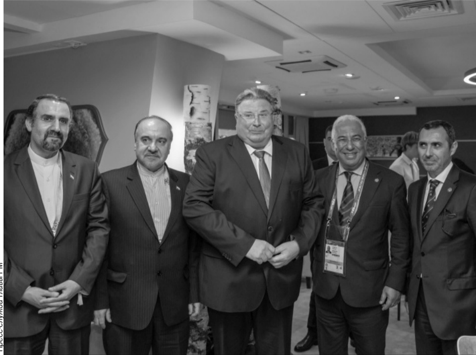
Матч посмотрели премьер-министр Португалии Антониу Кошту, а также послы стран игравших сборных.