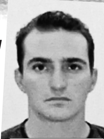
Федеральная полиция Бразилии

К слову, футбол для Родриго, по одной из версий,