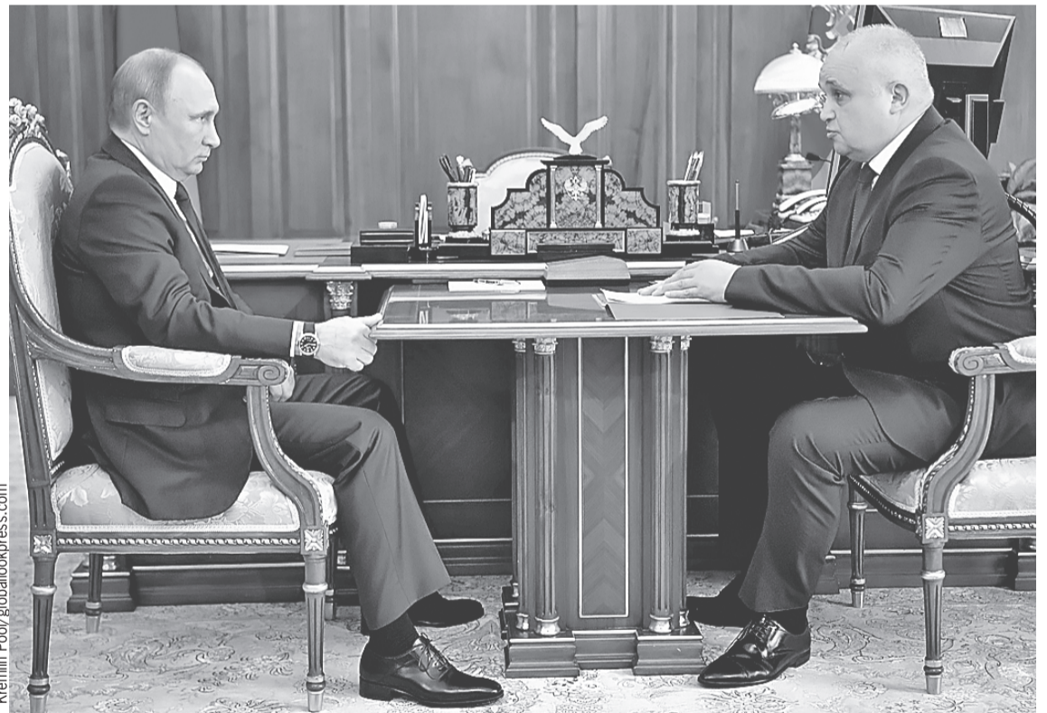
Все просьбы, с которыми пришел к Путину и. о. губернатора Кузбасса Цивилев, президент пообещал решить. «Перечень большой, но и область немаленькая», - сказал глава государства.

чень большой, но и область немаленькая. Что касается школьных автобусов, будем делать... Но нужно, чтобы они ездили по нормальным дорогам, а не разваливались через месяц.