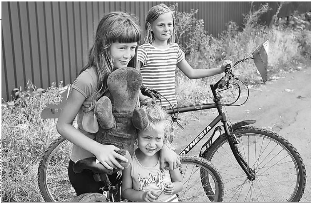
А это дети Мариуполя. Весной здесь гремели бои, а теперь лето и почти Россия.

- Ты можешь сравнить противника в 2014-м и в 2022-м. Что изменилось?