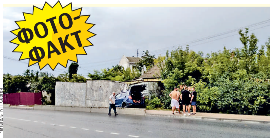
На Симферополь 1 августа обрушился мощный ливень. На фото - последствия эффекта аквапланирования. Автомобилист решил не останавливаться и продолжил движение, несмотря на сильный ливень. В итоге его машину буквально смыло с дороги.

- В результате взрыва пострадали шесть человек, которые были незамедлительно госпитализированы, а также частично разрушена стена и имеются многочисленные повреждения окон и фасада здания штаба, - рассказали в СК России.