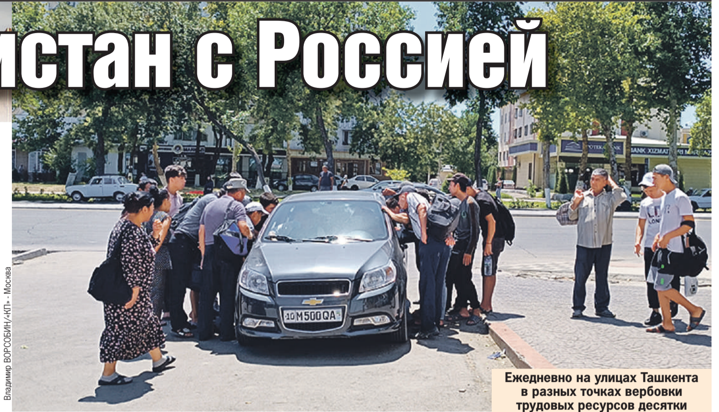
Владимир Ворсобин/«КП» - Москва