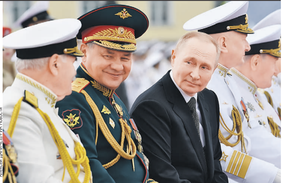
В последнее воскресенье июля в Питере президент Владимир Путин и министр обороны Сергей Шойгу на военно-морском параде по случаю Дня ВМФ не только осмотрели наши лучшие корабли, но и с интересом общались с ветеранами флота.

Часть из 40 надводных кораблей 4 флотов и Каспийской флотилии прошли в кильватерном строю по Неве, а самые крупные, для которых даже она мелковата, в шестой раз порадовали зрителей в Кронштадте.