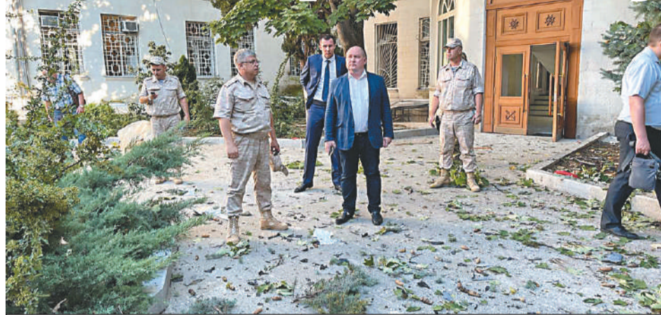
Власти города ввели «желтый» уровень террористической опасности.