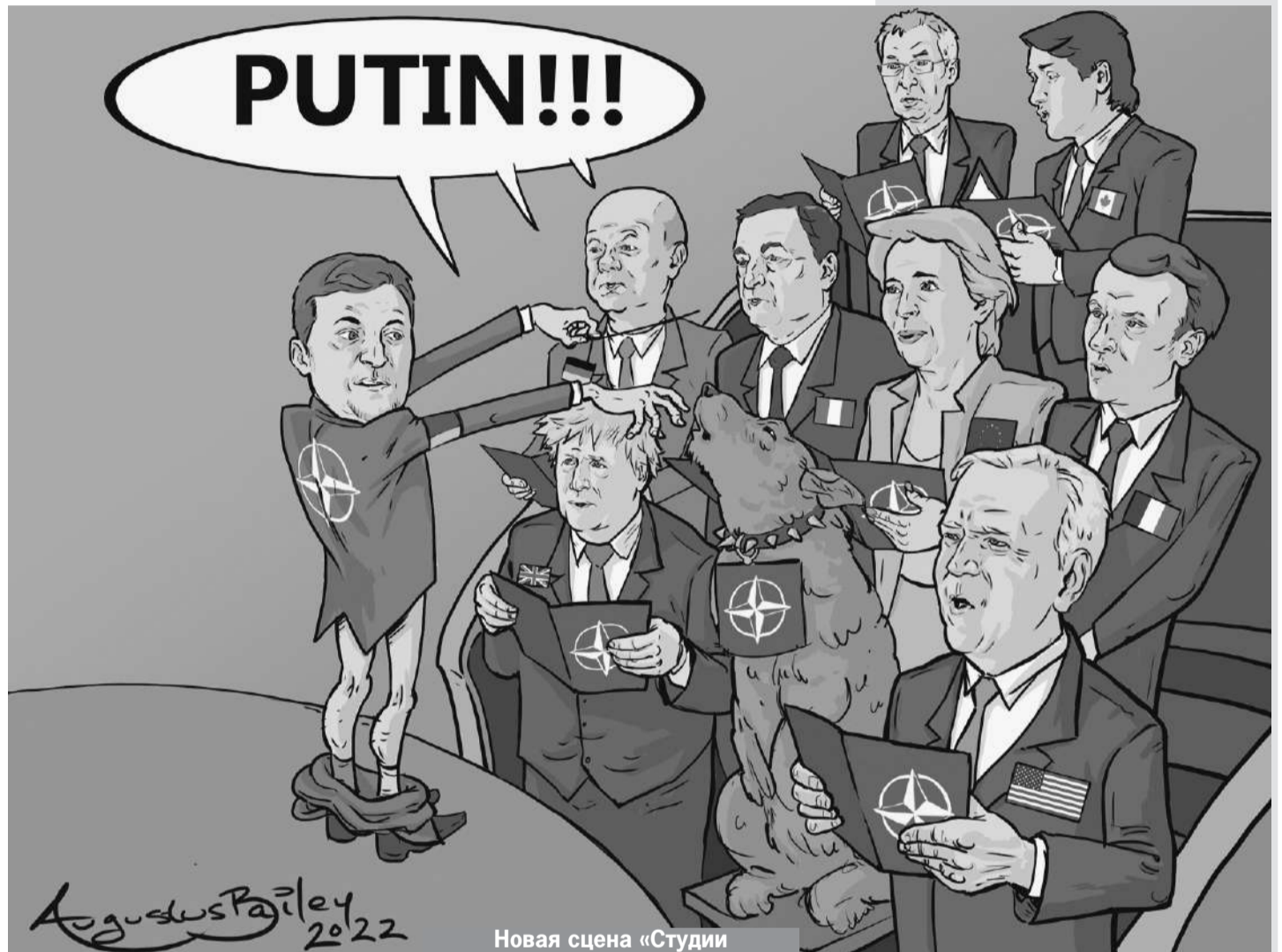
Новая сцена «Студии Квартал-95».

- Украина - последняя катастрофа тех, кто втянул нас в эту трясиину, когда они заявили, что США должны доминировать в мире и противостоять растущим региональным державам, которые могут когда-нибудь бросить вызов глобальному или региональному превосходству США.