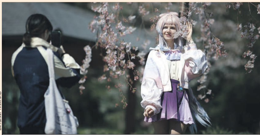
В Краснодаре все цветет, а девушки расцветают рядом с вишнями.

За эвакуацию машины водителю придется заплатить 3825 рублей. Кроме того, за каждый час нахождения на стоянке - 69 руб. 63 коп. А еще сотрудники ГИБДД выпишут штраф за нарушение правил парковки - от 500 рублей до лишения прав.