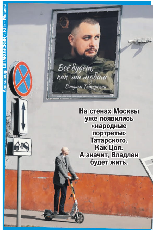
Александр ШИЖОВСКИЙ/«КП» - Москва

- Да, Макс, не молодею, по-прежнему лазаю, вот прямо сейчас лазаю в твоём любимом Донецке. Но из меня хоть песок и сыплется, я каждую песчинку подберу и куда надо обратно засуну**. Ты же знаешь, все на свете имеет один конец, и только у колбасы их два. Не волнуйся, все доделаем, стыдно тебе за нас не будет.