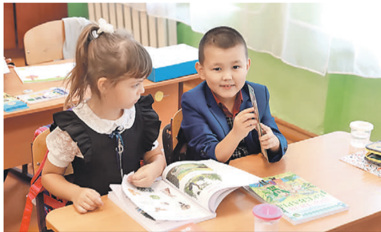
В школах Кузбасса раньше не было возможности выбора шорского языка. Сейчас есть.