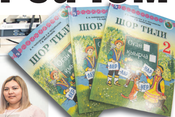
Благодаря учебникам шорский язык удалось сохранить.