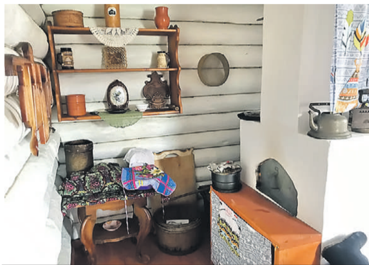
Шорскую этнодеревню открыли в 2021 году.

Развивается и спортивная инфраструктура. Например,