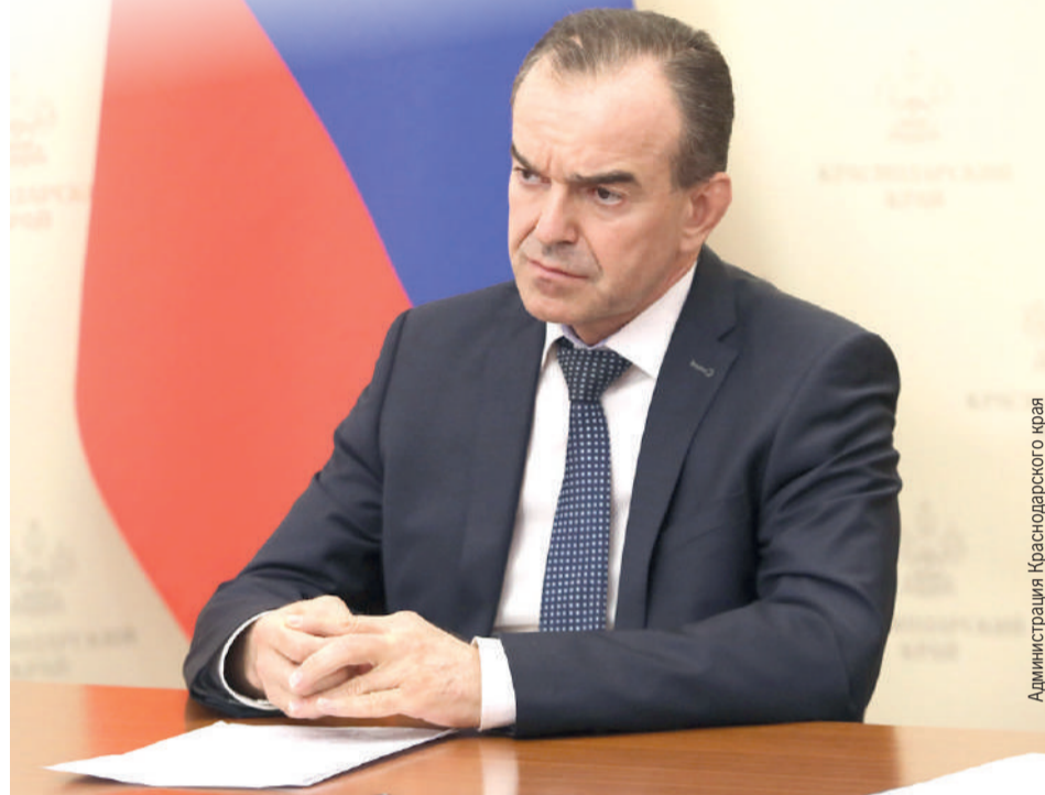
Администрация Краснодарского края

- По выделенным из федерального бюджета на реализацию национальных проектов объемам финансирования край не первый год входит в пятерку лидеров. В 2024 году мы занимаем третье место. Повысилась скорость принятия решений, совместно