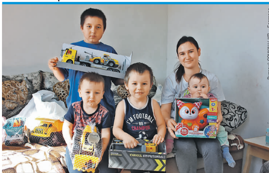
Все четверо детей из этой смелой и дружной семьи получили подарки от «Комсомольской правды».