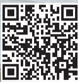
Фото присылайте в «Комсомольскую правду», e-mail: miss@kp.ru

Голосуйте за понравившуюся вам участницу на нашем сайте KPRU в разделе «Будь стильной с «КП»!»