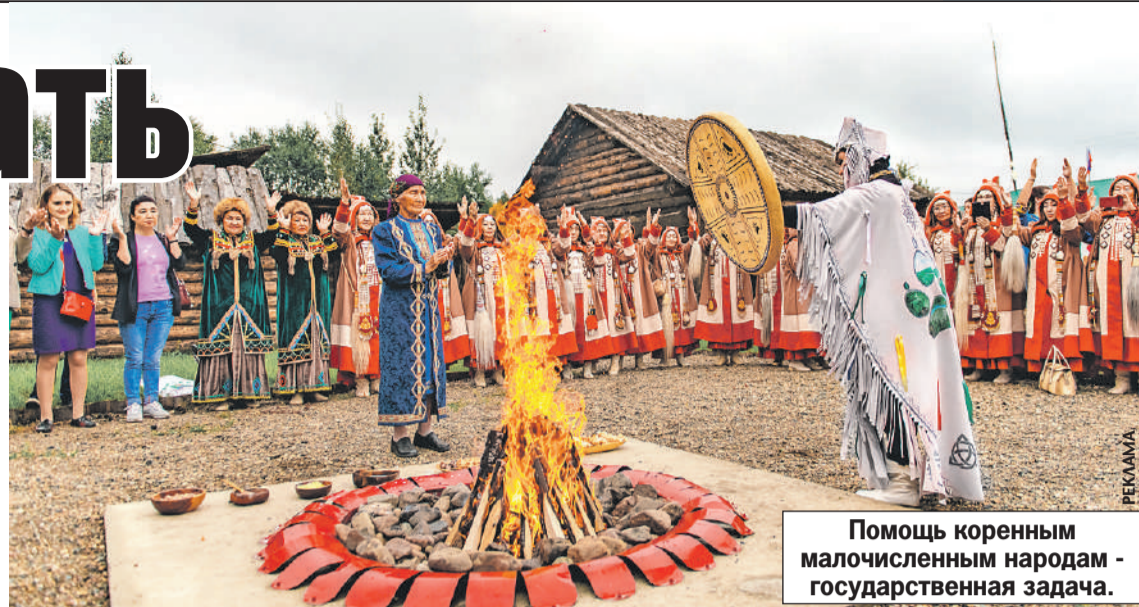
Помощь коренным малочисленным народам - государственная задача.

это новая спортивная площадка «Кызыл Чар» в районе Красный Яр Мысковского городского округа. На ней расположены хоккейная коробка, волейбольная площадка, теплое помещение для переодевания спортсменов, детская игровая площадка, а