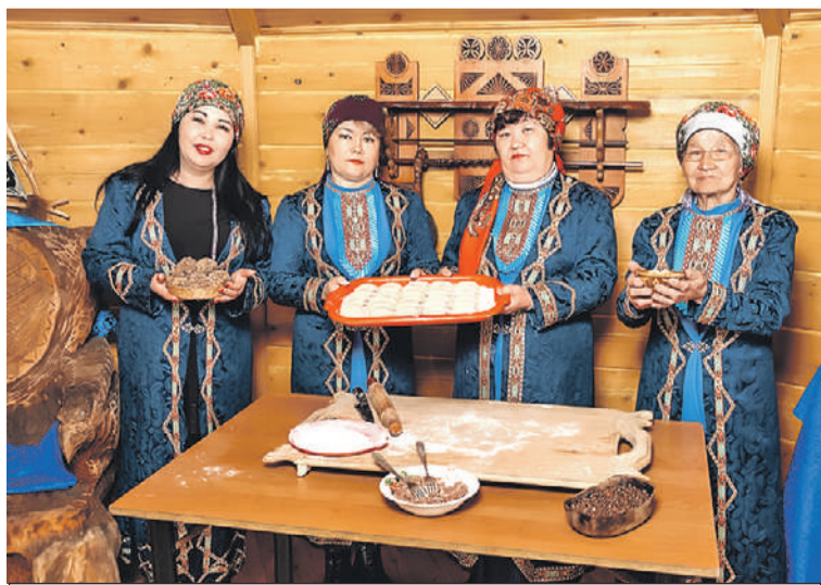
Шорцев в России 10 тысяч, почти все живут в Кузбассе.