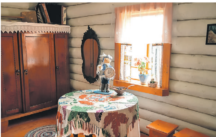
Все предметы быта в этнодеревню принесли местные жители.

также беседка для родителей. А на территории спортивно-развлекательной площадки в поселке Чувашка провели реконструкцию сцены, отремонтировали футбольную зону, отреставрировали беседку для отдыха.