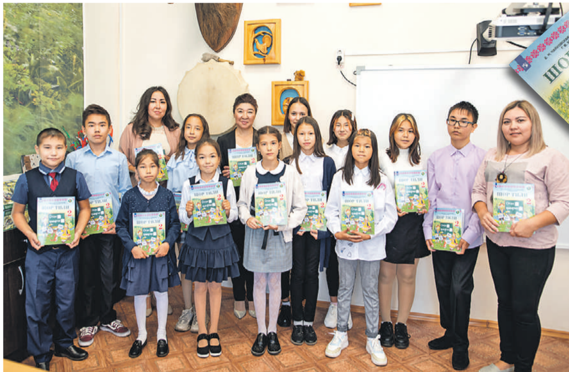
Компания издала линейку учебников шорского языка.

- Очень важно, чтобы шорцы всех возрастов не забывали свои корни и бережно относились ко всему наследству, которое им досталось, - сказал