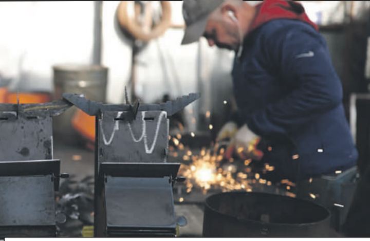
Из цеха в Новороссийске в зону СВО отправили больше 3 тысяч печек.

- К нам в «Рубеж» приезжает много родителей наших бойцов из Новороссийска, Анапы, Краснодар, чтобы передать своим сыновьям наши печки в зону спецоперации: мы отдаем их по себе-