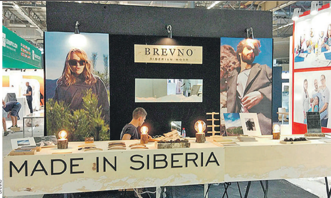
Очки с сибирским колоритом с 2016 года объездили множество международных выставок.

Начинали с нуля. После работы собирались на кухне, искали и изучали видео, где мастера работают с деревом. Разбирали детально каждый кадр, каждый нюанс. Потом перешли