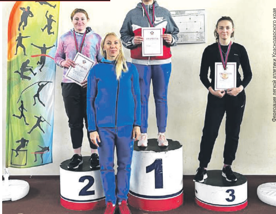
Федерация легкой атлетики Краснодарского края

Неудивительно, что по уровню первенства и чемпионаты Краснодарского края нередко сравниваются с крупными российскими стартами. Такая же высокая конкуренция была и на стадионе «Текстильщик». Сразу в нескольких дисциплинах победителей определяли только в последней попытке.