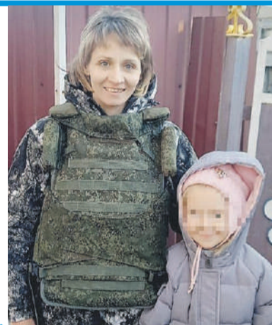
Девочка получила от кубанцев огромную посылку с подарками.

Видеопривет от наших бойцов - на сайте kp.ru