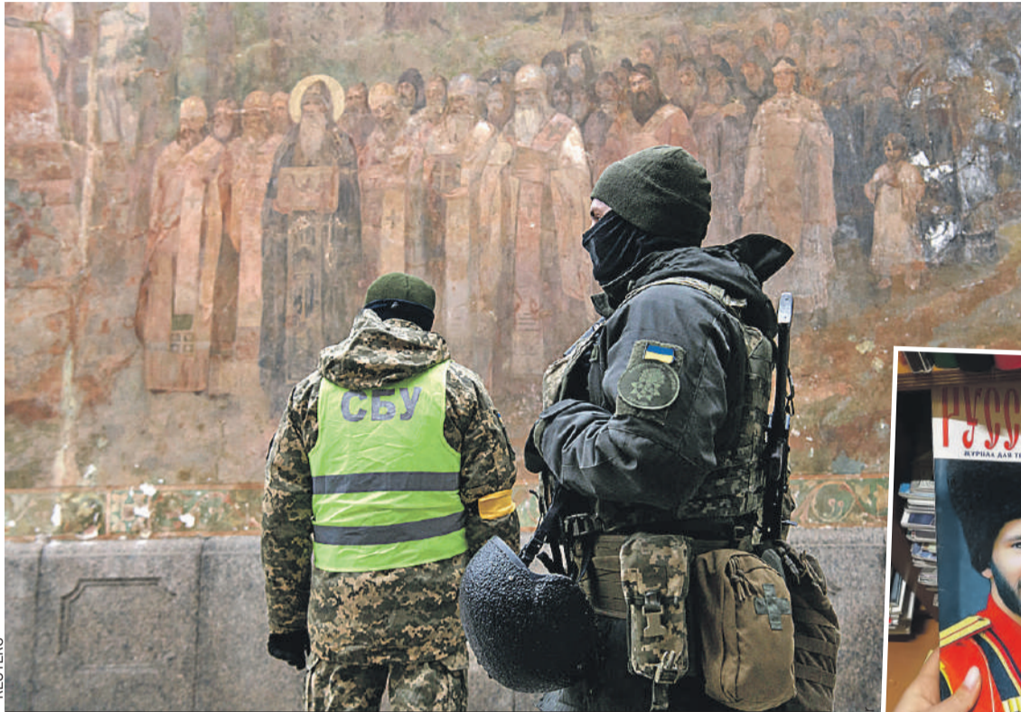
Украинские силовики пришли в лавру вовсе не замалчивать грехи (хотя стоило бы), а искать «ячейку Русского мира». Нашли! Да не просто ячейку, а целый «Русский дом» от 2014 года (справа).