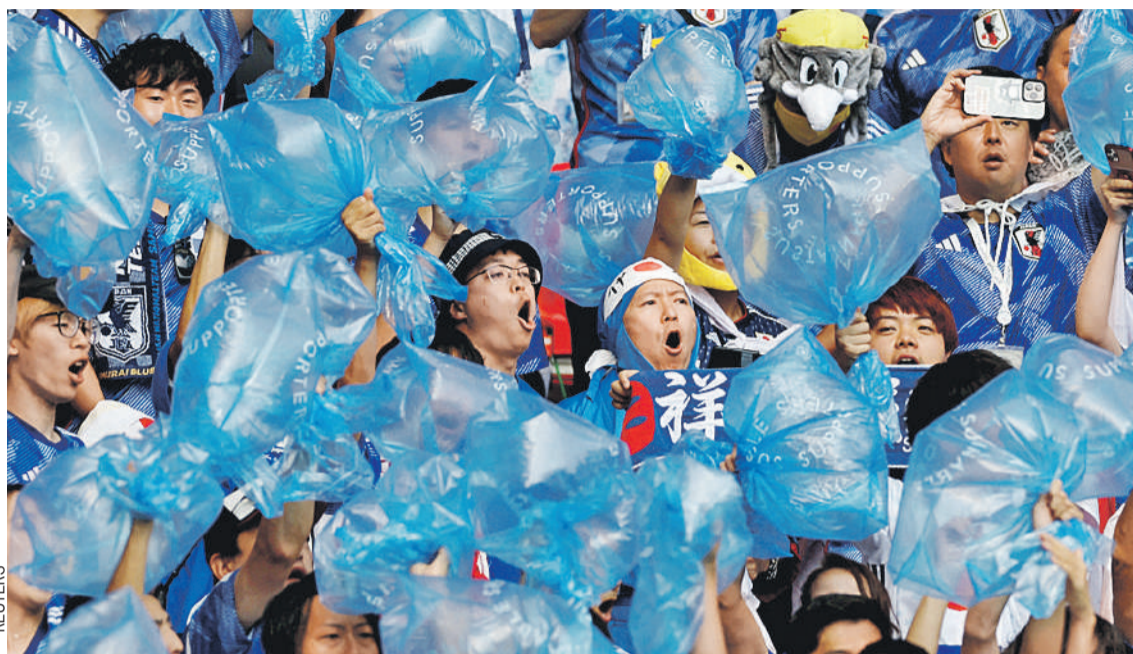
Японские болельщики ходят на спортивные матчи не с фаерами или трещотками, а с пакетами для мусора. С их помощью во время игры можно устроить небольшое шоу, а потом прибраться на своем месте.