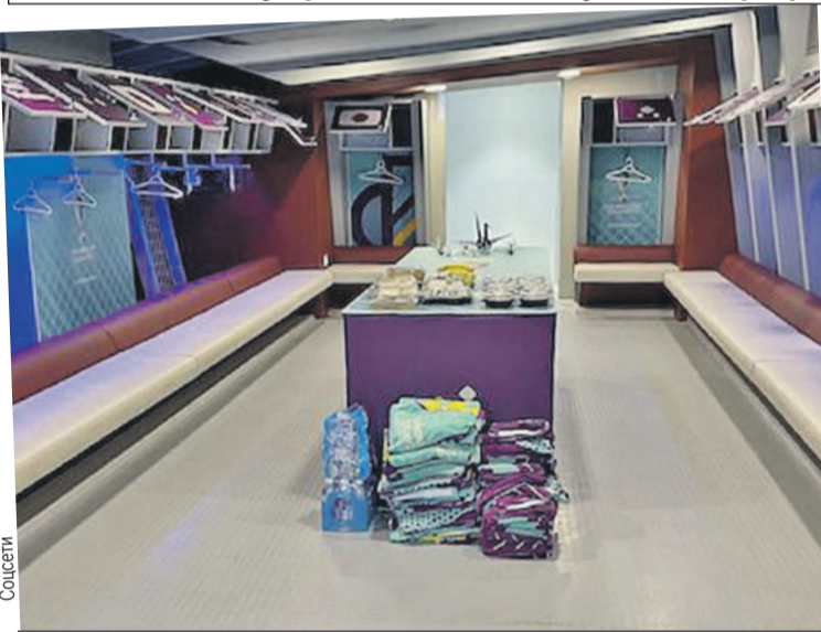
В таком идеальном состоянии японские футболисты оставляют свою раздевалку после матча.

государственном устройстве страны имеются и указания о проведении ежегодной уборки императорского дворца.