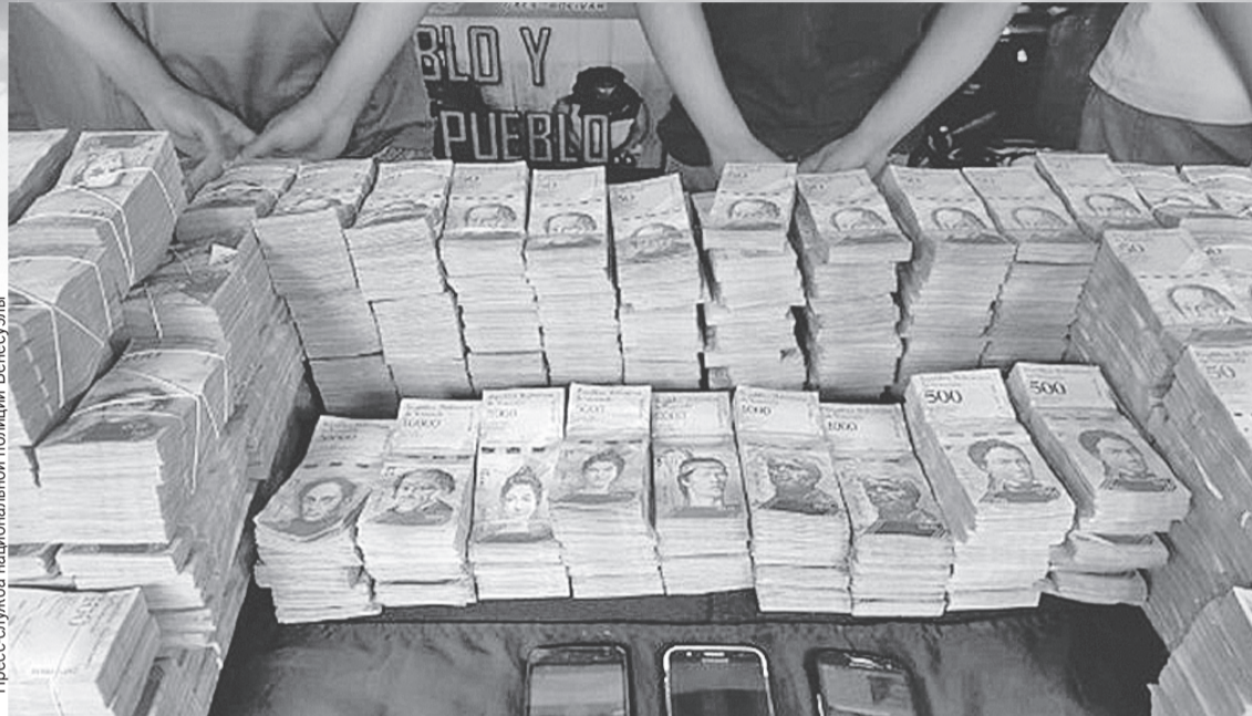
Это изъятые полицией Каракаса у подпольных менял венесуэльские деньги. Всей этой кучи едва-едва хватит, чтобы купить хотя бы пару килограммов картошки. Да и то раздобыть столько налички - это чудо по нынешним непредсказуемым венесуэльским временам.

Повальное использование карточек привело к постоянным очередям практически везде. Поход в магазин может затянуться на полчаса, а то и больше, ведь процедура ввода информации в платежный аппарат здесь небыстрая: надо предъявить паспорт, который дотошно просмотрят, потом указать сумму (которую еще несколько раз перепроверяют, чтобы не набить лишних