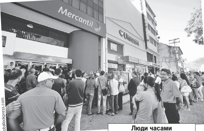
Люди часами простаивают у банкоматов, а на руки им выдают самые мизерные суммы.