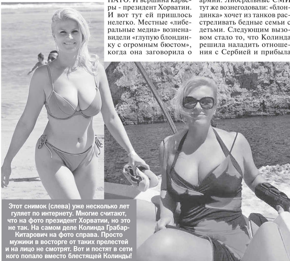
Этот снимок (слева) уже несколько лет гуляет по интернету. Многие считают, что на фото президент Хорватии, но это не так. На самом деле Колинда Грабар-Китарович на фото справа. Просто мужики в восторге от таких прелестей и на лицо не смотрят. Вот и посят в сети кого попало вместо блестящей Колинды!

Иногда она напоминает мне принцессу Диану, обожаемую народом и ненавидимую элитой. Но Колинда сильнее. Она не сдастся. Да и кто сможет напугать деревенскую девчонку, которую в детстве учили охотиться на диких зверей и чьи предки сражались против фашистов?