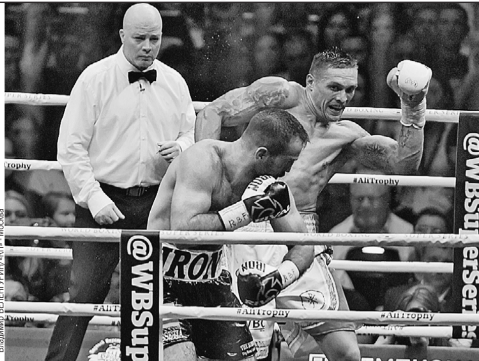
Бой между осетином Гассиевым (в черных трусах) и украинцем Усиком был по-спортивному зрелищным. Но не меньшие страсти разыгрались и вне ринга - уже политические.

Крымчанин Усик продолжает свободно ездить в свой родной Симферополь, отказываясь отвечать на вопрос: «Чей Крым?», победу он посвятил отцу и первым тренерам, три года назад у себя в Фейсбуке он разместил