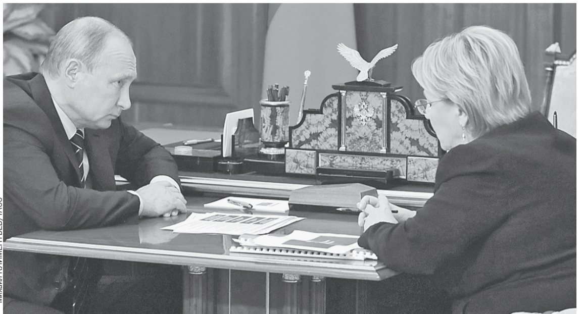
Вероника Скворцова доложила президенту, что к 2021 году проблема недоступности врачебной помощи перестанет существовать даже в самых отдаленных уголках страны.

- Уровень поднялся с 20 тысяч до более 110 тысяч, - рас-