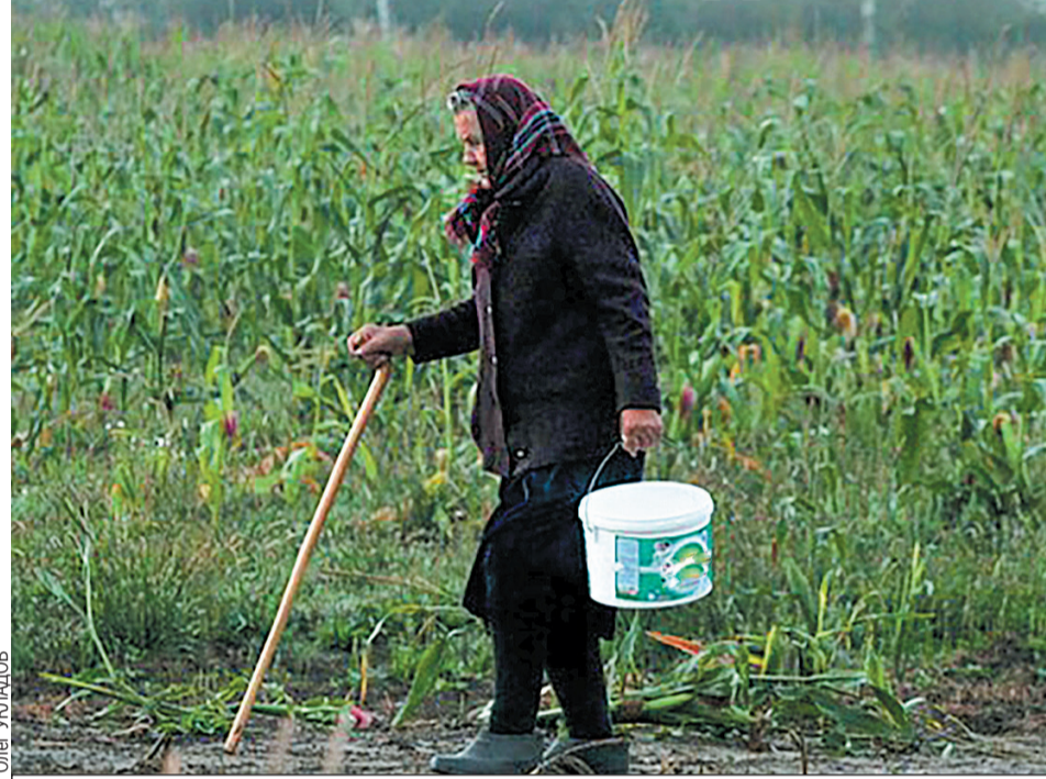
В летние месяцы чаще всего теряются пенсионеры.