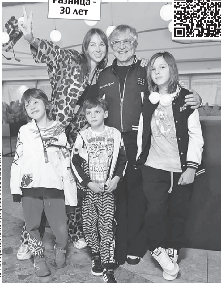
Личная страница Полины Дибровой в социальной сети