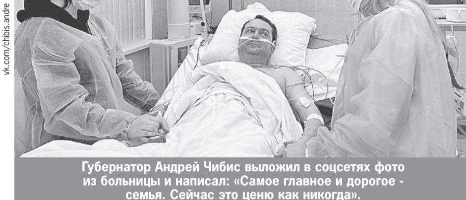
Губернатор Андрей Чибис выложил в соцсетях фото из больницы и написал: «Самое главное и дорогое - семья. Сейчас это ценю как никогда».