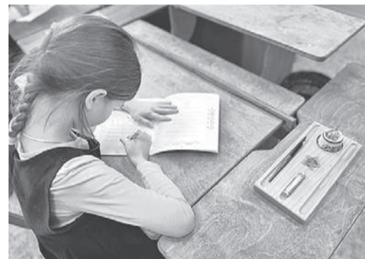
Семейный центр «Ладимир».

В Великом Новгороде создали классы по программе Русской классической школы.