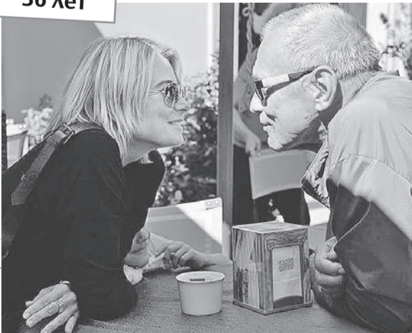
Личная страница Юлии Высоцкой в социальной сети

Юлия стала для Кончаловского не только женой, но и музой.