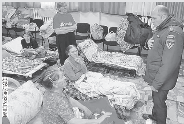
Глава МЧС Александр Куренков навестил людей в пункте временного размещения.

нистр отправился в зону бедствия еще в субботу вечером, после распоряжения президента) и губернатор Денис Паслер доложили главе страны о развитии ситуации около Орска. Кроме того, Путин поручил главе МВД не допустить мародерства в районах бедствия. И обеспечить охрану порядка, а также имущества граждан.