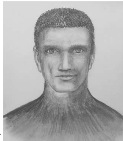
У незнакомца были европейское лицо и прическа «бобриком», вот только кожа и одежда - серовато-молочного цвета.