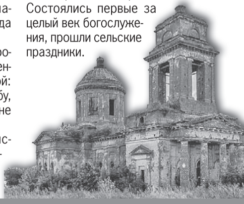
Храм Богоявления Господня расположен в селе Донская Негачевка Хлевенского района Липецкой области.

Благодаря проекту в поселке Грибоедово Тульской области над обезглавленным храмом появилась крыша, в селе Каменка Ленинградской области создан чертёж, по которому воссоздадут часть церкви. Для Георгиевского храма в Ивановской области проведено 3D-сканирование и разработан проект консервации. Состоялись первые за целый век богослужения, прошли сельские праздники.