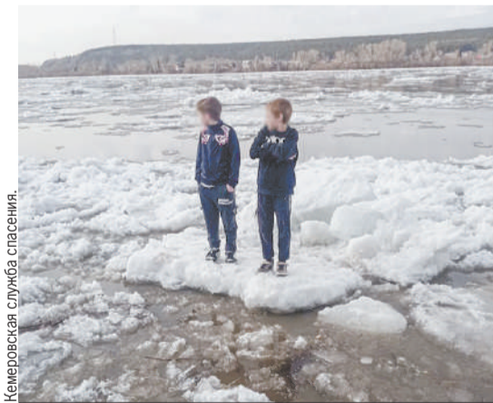
Отколовшаяся льдина унесла мальчишек на три метра от берега и, застряв, остановилась.

- На самом деле мальчишкам повезло, что на этом участке сделали теперь популярную зону отдыха и рядом оказались люди, которые и сообразили, как правильно действовать. Повезло и в том, что льдина зацепилась и не набрала ско-