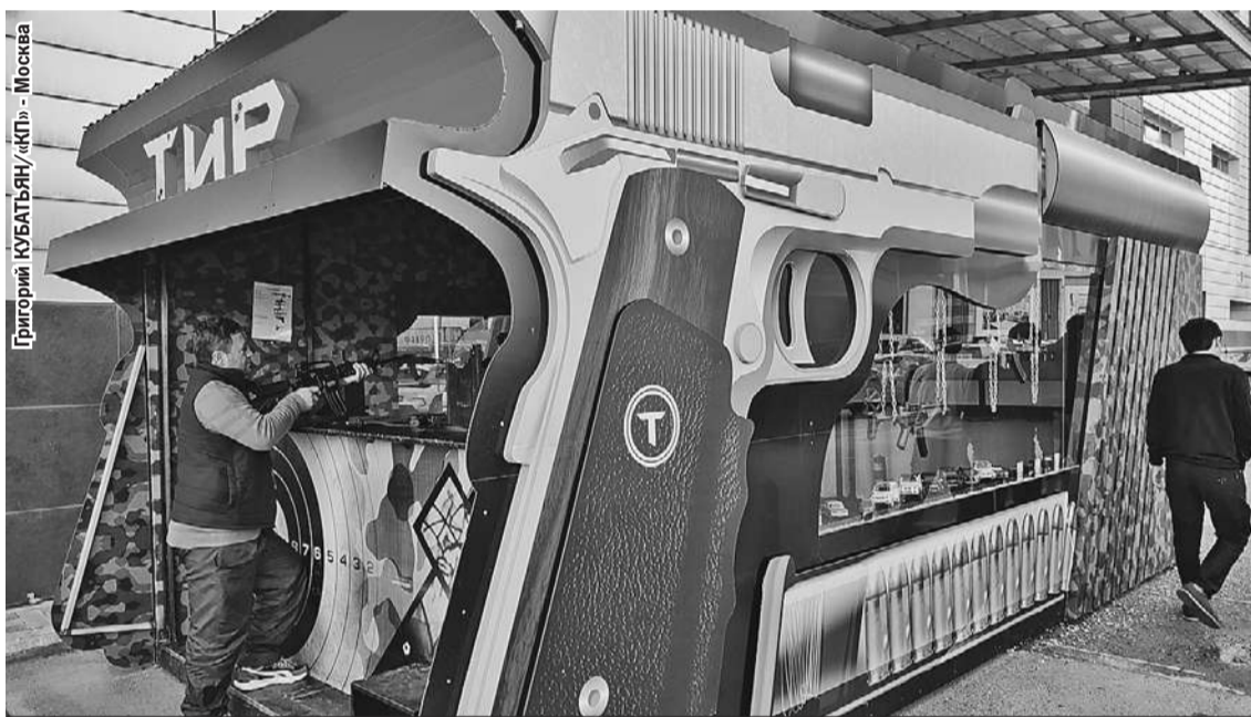
Если в Душанбе вам про кого-то скажут: «Он оружие в руках не держал, стрелять не умеет», это будет полуправдой. Тиров тут полно, и пострелять в них любят многие.

Решение есть. В России нужно реформировать миграционную систему, об этом уже и Путин сказал. А с Таджикистаном восстанавливать прежние экономические и культурные связи. Возвращать в республику русских специалистов, строить заводы. Но быть готовыми