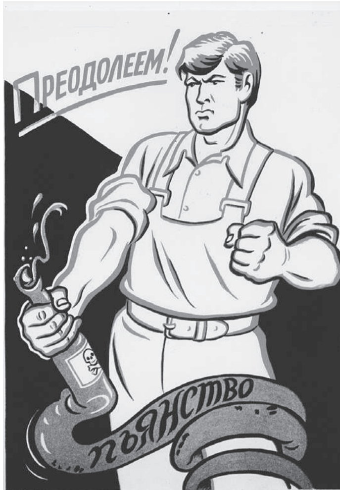
Врачи единодушны: алкоголь - яд. Поэтому если и принимать его, то в маленьких дозах.

Обратите внимание: даны цифры чистого спирта. Для конкретного алкоголя их нужно будет пересчитать в зависимости от крепости напитка.