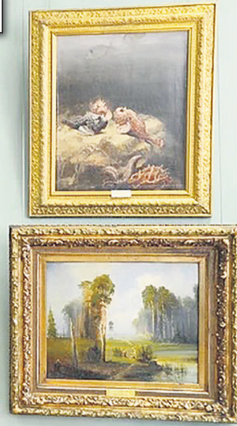
Иркутский областной художественный музей им. В.П. Сукачева.

Результатом этого мероприятия стала страшная давка с большим числом погибших и пострадавших.