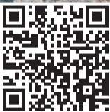
Фото присылайте в «Комсомольскую правду», e-mail: miss@kp.ru

Голосуйте за понравившуюся вам участницу на нашем сайте KP.RU в разделе «Будь стильной с «КП»!»