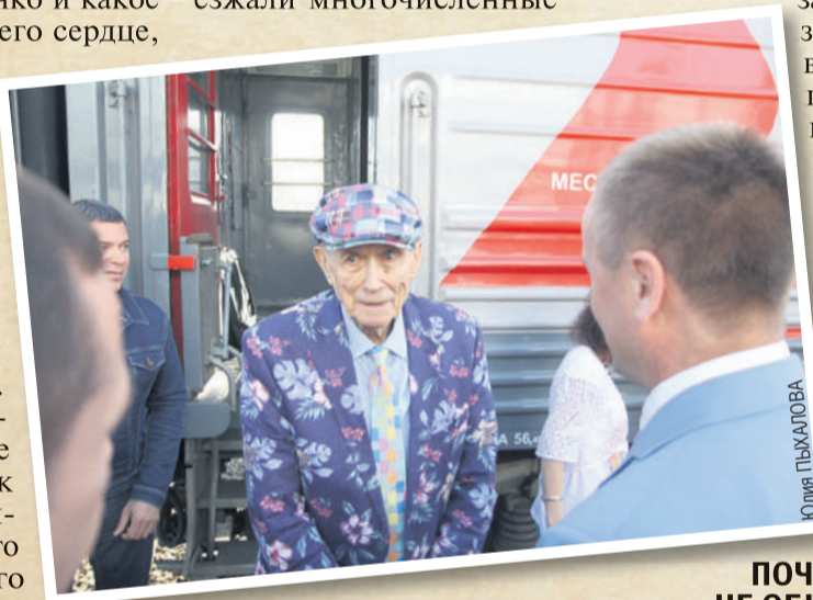
Встреча на вокзале Иркутска: один из последних приездов автора в родные края.

Дом не пустует, здесь постоянно проходят разные события: экскурсии, квиз-турниры, творческие вечера, фестивали. Местные жители не забывают своего знаменитого земляка. Так, в апреле прошел вечер памяти поэта. Собравшиеся, в основном местные школьники, услышали воспоминания горожан, которым удалось лично встретиться с поэтом и побывать на его концертах. Конечно, звучали стихи как в прочтении автора (из динамика музейного патефона), так и в исполнении юных чтецов. Сам Евтушенко был в Доме-музее в Зиме в последний раз в 2015 году - за два года до своей кончины.