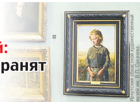
Иркутский областной художественный музей им. В.П. Сукачева.

РАДИО КОМСОМОЛЬСКАЯ ПРАВДА FM.KP.RU Иркутск 91,5 FM | Братск 99,5 FM