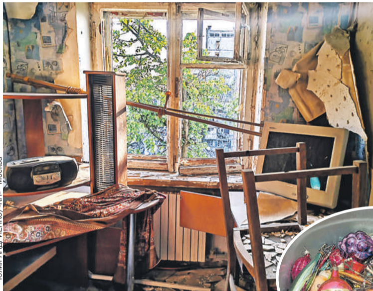
Юлия АНДРИЕНКО/КП - Москва

Я смотрю в грязное окно «буханки» на обочины, усеянные сгоревшей украинской бронетехникой, и кажется, не было этих десяти лет. Каждый дом, за-