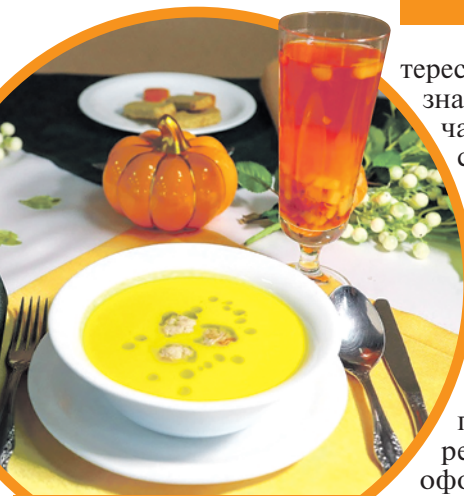
Оценивались и вкус блюд, и подача.

Попробовать себя в роли шеф-поваров решили сразу несколько команд: учеников и родителей, учителей, поваров и даже студентов Иркутского техникума индустрии питания. Все они получили в полное распоряжение возможности школьной кухни и приготовили по целому набору блюд, включающих в себя тыкву.