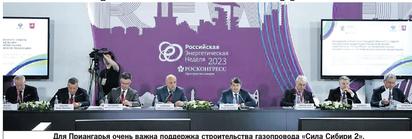
Для Приангарья очень важна поддержка строительства газопровода «Сила Сибири 2».

Заправка автомобильного транспорта компримированным природным газом Братского газоконденсатного месторождения осуществляется на четырех автомобильных газонаполнительных компрессорных станциях. Три из них находятся в Братске, одна – в Тулуне. К природному сетевому газу подключена только одна из них, обеспечивающая в том числе и заправку передвижных автогазозаправщиков. В этом году ООО «Газпром газомоторное топливо» планирует завершить реконструкцию од-