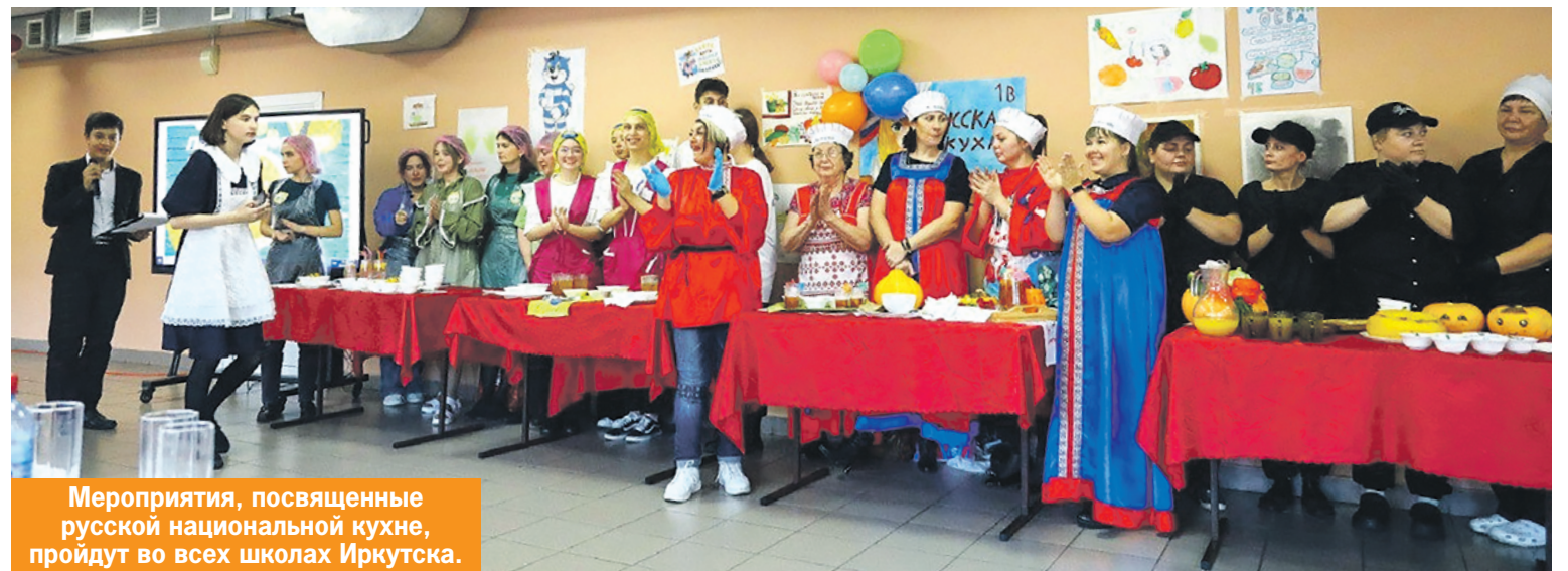
Мероприятия, посвященные русской национальной кухне, пройдут во всех школах Иркутска.