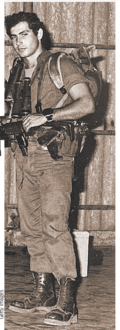
Этот снимок сделан 50 лет назад, когда Нетаньяху был членом элитного подразделения коммандос.

Недоброжелатели Нетаньяху из западного лагеря называют его «другом Путина ». Он, впрочем, хорошие отношения с российским лидером не отрицает. Подсчитано, что из лидеров стран дальнего зарубежья он чаще всех встречается и созванивается с Президентом России. Залогом продуктивных контактов, по словам израильского премьера, является тот факт, что наши страны «нашли компромисс, который удовлетворяет израильскую сторону и не нарушает национальные интересы Москвы».