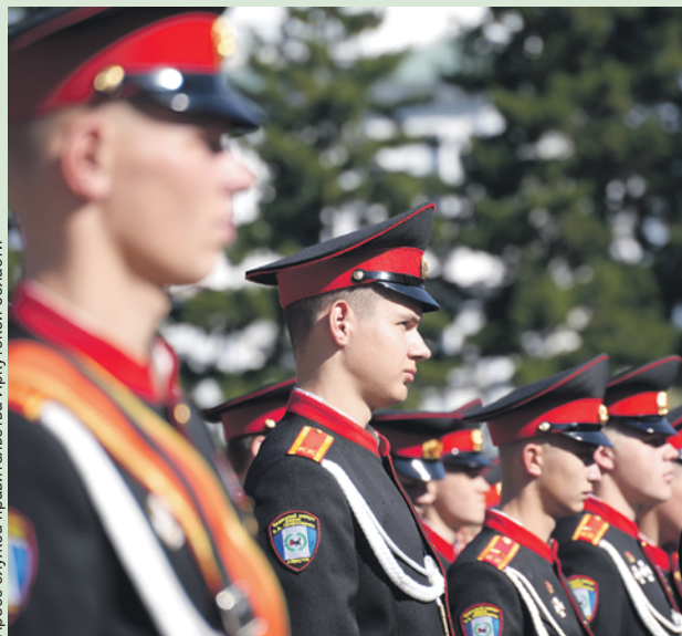
Пресс-служба правительства Иркутской области

Папы некоторых воспитанников Иркутского кадетского корпуса имени П.А. Скороходова сегодня служат в зоне СВО. Ко Дню отца дети решили послать весточку из дома. При поддержке педагогов иркутского ИТ-куба они записали видеопоздравления.