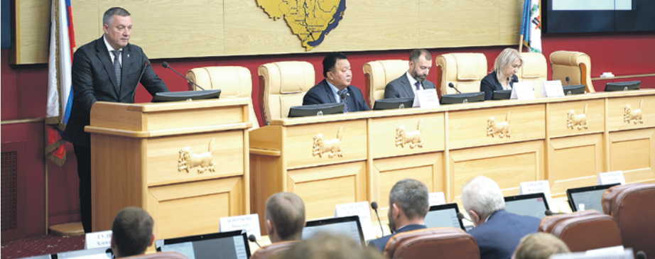
Пресс-служба правительства Иркутской области