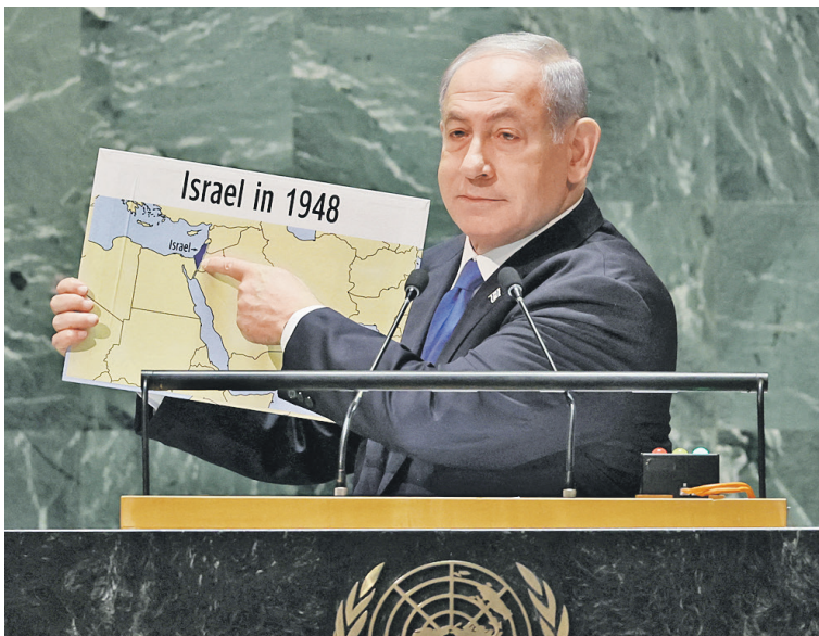
Государство Израиль было создано 75 лет назад, в 1948 году. А сам Нетаньяху (на фото он на трибуне ООН) родился годом позже.