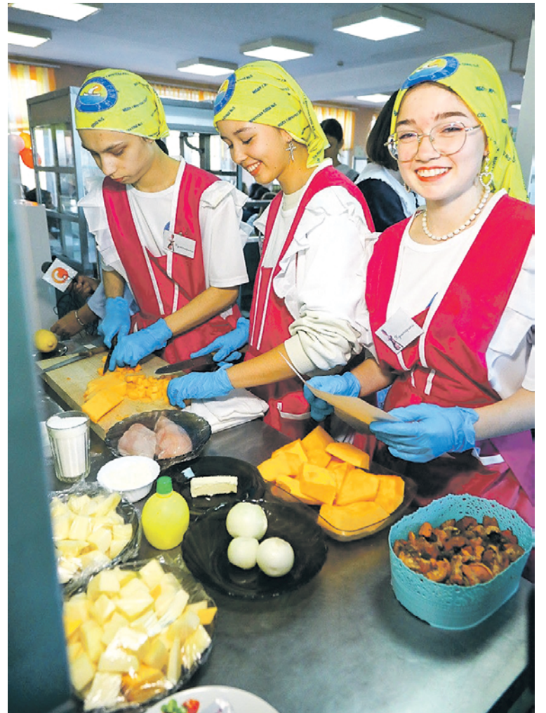
Блюда готовились прямо на школьной кухне.