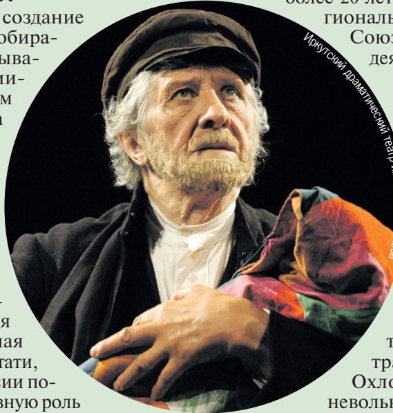
В роли Тевье-молочника в спектакле «Поминальная молитва».