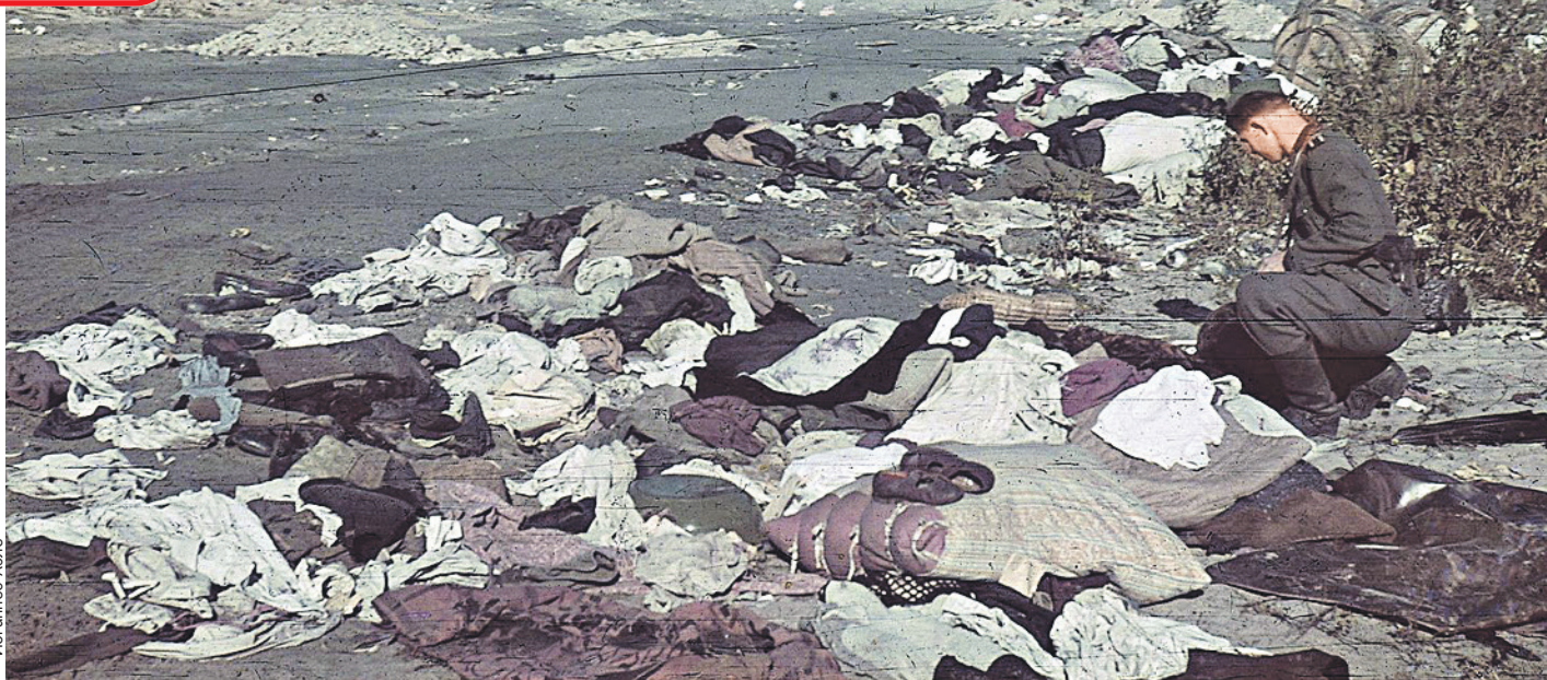
Бабий Яр. Эсэсовец в поисках ценностей копается в вещах только что расстрелянных людей.

Впрочем, даже такое положение фашистов не устраивало. Вот что пишет Павел Судоплатов в своей справке: «26 - 27 августа 1942 года во многих населенных пунктах Западной Украины гестаповцы при активном участии украинских националистов организовали