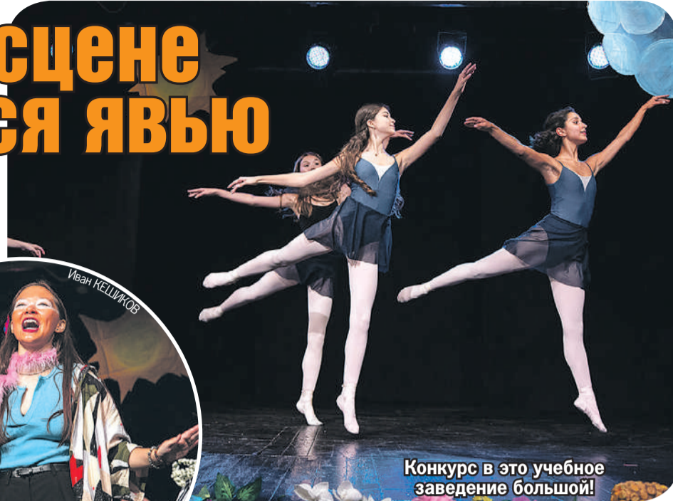
Конкурс в это учебное заведение большой!

Вопросов и сомнений у абитуриентов масса. Например, кого-то смущают вес и возраст. Но если объемы - дело поправимое, то вот количество лет - аргумент серьезный.