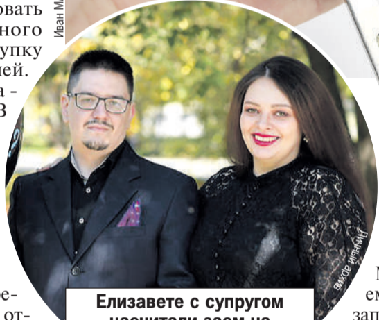
Елизавете с супругом насчитали заем на 3 млн рублей за авто стоимостью 1,5 млн рублей.

Елизавета, супруги прошли в отдел кредитования. В документах специалисты указали данные иркутянки - Ф.И.О., контакты, место работы, уровень дохода, а также данные пяти поручителей.