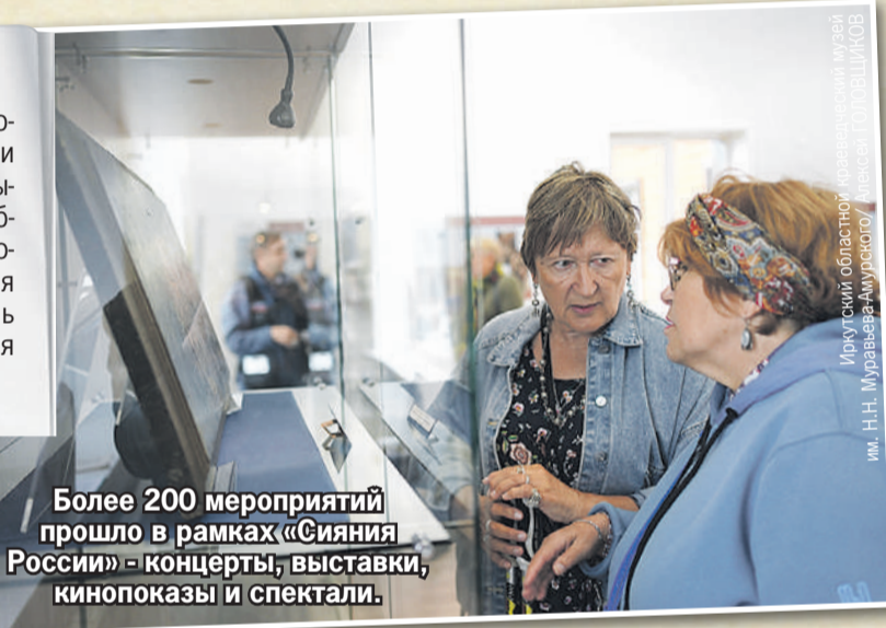
Более 200 мероприятий прошло в рамках «Сияния России» - концерты, выставки, кинопоказы и спектакли.

Имя Валентина Распутина - постоянный лейтмотив фестиваля. На этот раз состоялось знаковое событие, связанное с классиком литературы, - в порту Байкал прошло открытие отреставрированного дома-дачи, где проходила работа над известными произведениями. Исторически усадьба состояла из небольшого, но очень крепкого дома из широких лиственничных бревен и летней кухни. Из окон видны рельсы, дорога и берег Байкала. Именно в летней кухне Распутин закончил повесть «Живи и помни», написал «Прощание с Матерой», этим местам он посвятил свои рассказы.