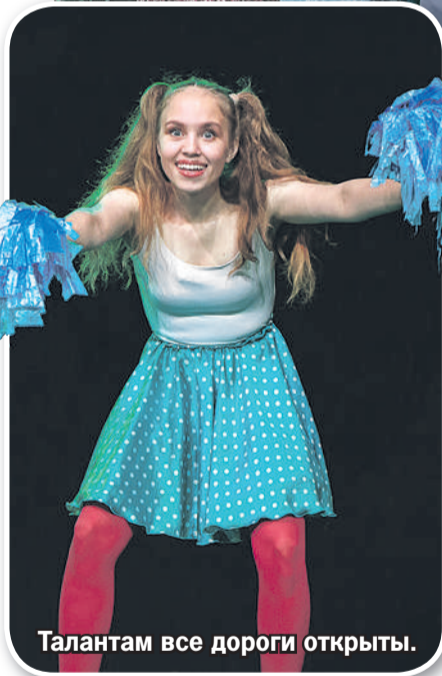
Талантам все дороги открыты.