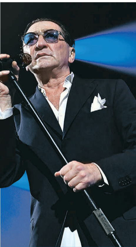
Поклонники Григория Лепса уже готовятся встречать звезду.

Сибирский тур Григория Лепса так выглядит расписание концертов известного исполнителя в начале октября. Сначала Томск, затем Новосибирск, Красноярск и потом - 9 октября - Иркутск. В нашем городе местом встречи публики и артиста станет ледовый дворец «Айсберг». В программе «Иди и смотри» только лучшие и самые любимые песни в