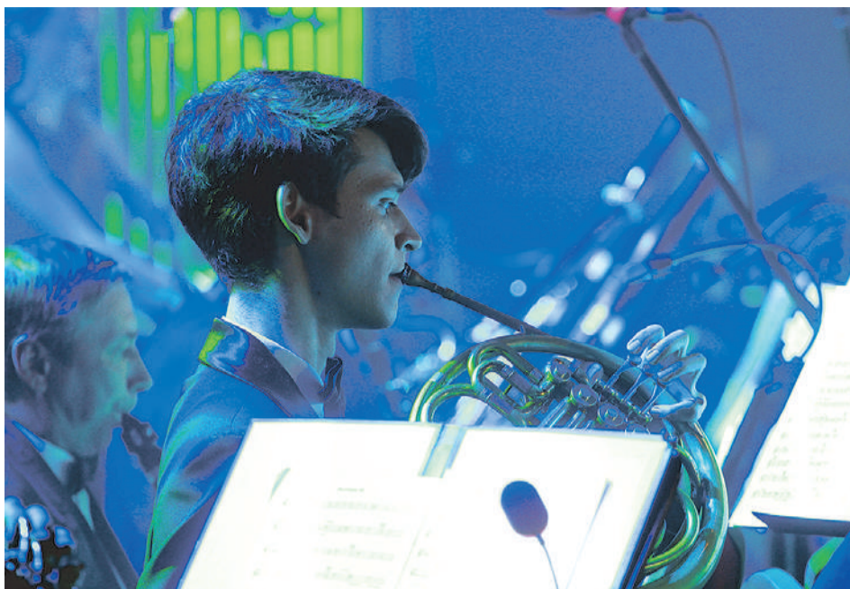
В Иркутской областной филармонии откроется новый, 85-й сезон.

Известный композитор Сергей Прокофьев в 1936 году написал симфоническую сказу «Петя и волк». Задумка была в том, чтобы познакомить юных слушателей со звучанием инструментов оркестра. Например, птичка - флейта, кошка - кларнет, дедушка - фагот. В версии Иркутского музыкального театра персонажи обретут не только симфонические