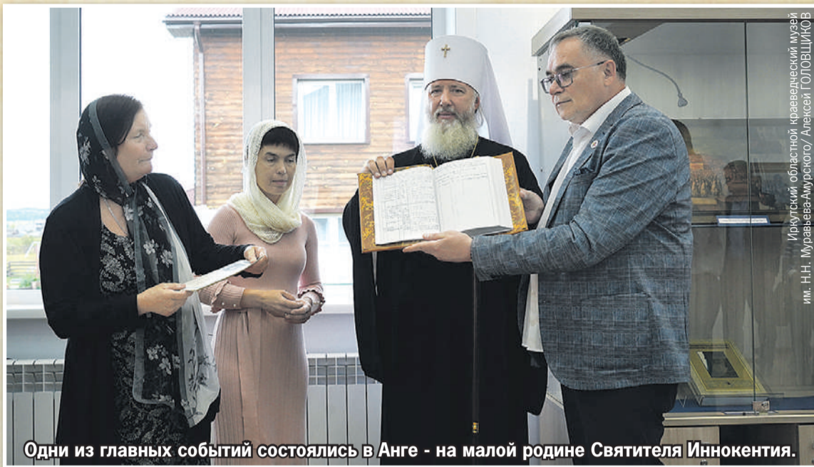
Одни из главных событий состоялись в Анге - на малой родине Святителя Иннокентия.