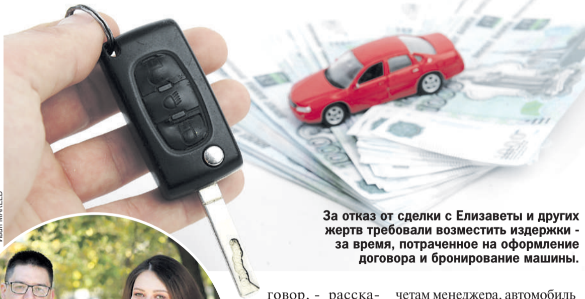
За отказ от сделки с Елизаветы и других жертв требовали возместить издержки - за время, потраченное на оформление договора и бронирование машины.