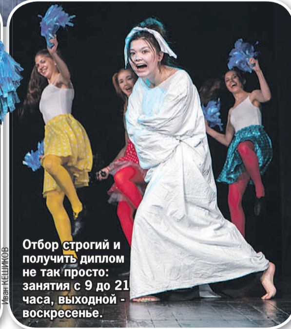
Отбор строгий и получить диплом не так просто: занятия с 9 до 21 часа, выходной - воскресенье.