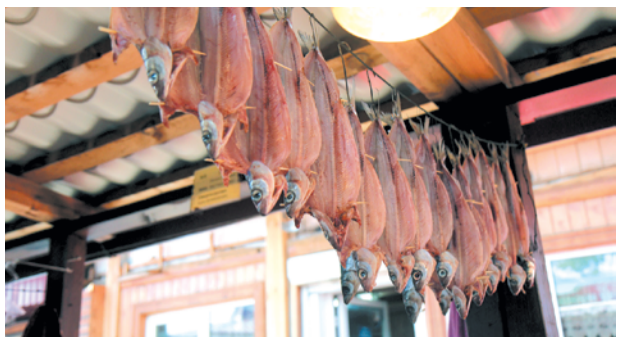
Юлия Пыхалова, Иркутск

РАДИО КОМСОМОЛЬСКАЯ ПРАВДА FM.KP.RU Иркутск 91,5 FM | Братск 99,5 FM