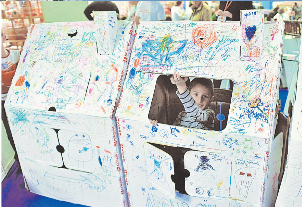
На строительство частного дома многие идут ради будущего детей - другого способа обеспечить семью нормальным жильем зачастую просто нет.

По разным опросам, россияне, мечтающих о «своем доме на своей земле», всегда было больше, чем тех, кто хочет обитать в городской квартире, - где-то порядка 60%. А