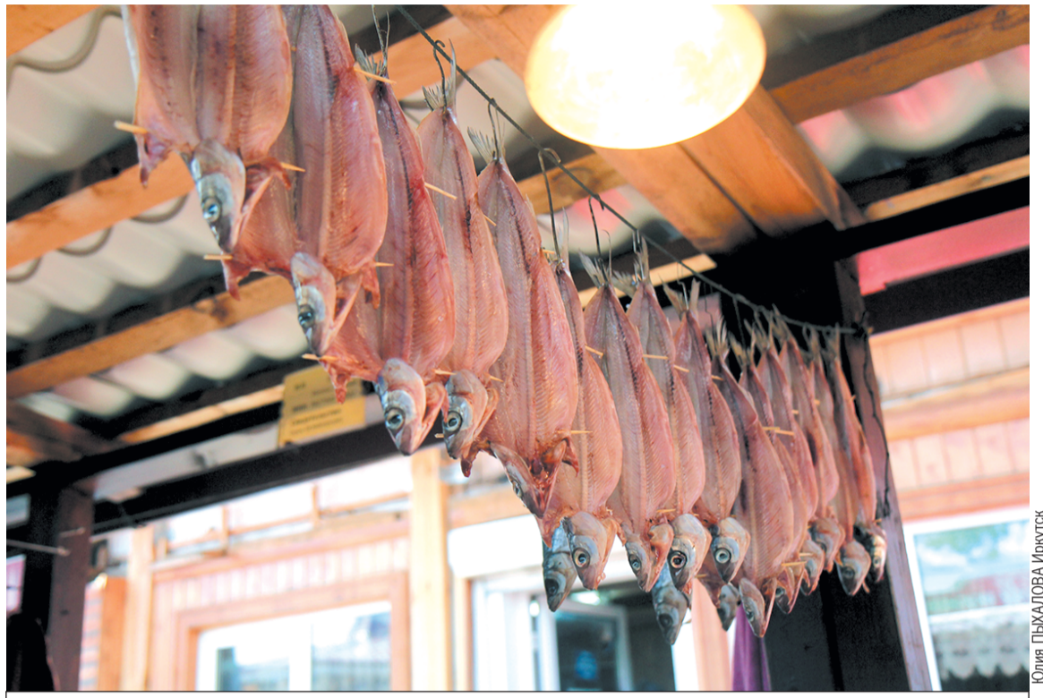
Юлия ПЬКАЛОВА Иркутск

А вот появится ли деликатес на рынках - большой вопрос.