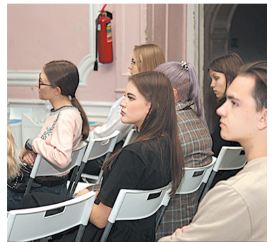
Больше 1950 студентов и молодых специалистов подали заявки.