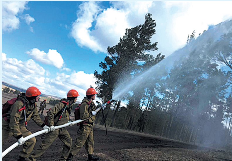
В основном, огонь успевали потушить в первые же сутки.

Тем временем в Иркутской области уже вовсю готовятся к следующему году: закупают лесопожарную технику, а в ближайшее время начнут обучать специалистов лесопожарных формирований.