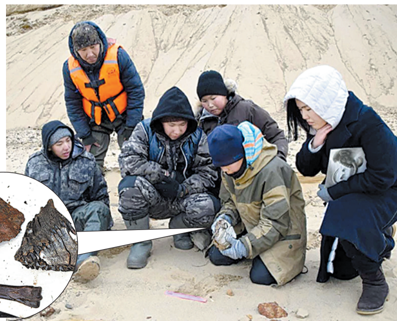
Нацпарк «Ленские столбы»

Примечательно, что песчаные дюны Тукуланы являются излюбленным местом туристов. Каждый год сюда приезжают толпы желающих сфотографироваться в живописной местности и скатиться с песчаной горы на борде. Однако эти останки древних животных остались незамеченными для полчищ отдыхающих и были обнаружены школьниками-исследователями.