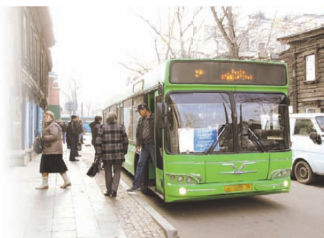
Юлия ПЫХАЛОВА «КП» - Иркутск

РАДИО КОМСОМОЛЬСКАЯ ПРАВДА FM.KP.RU Иркутск 91,5 FM | Братск 99,5 FM