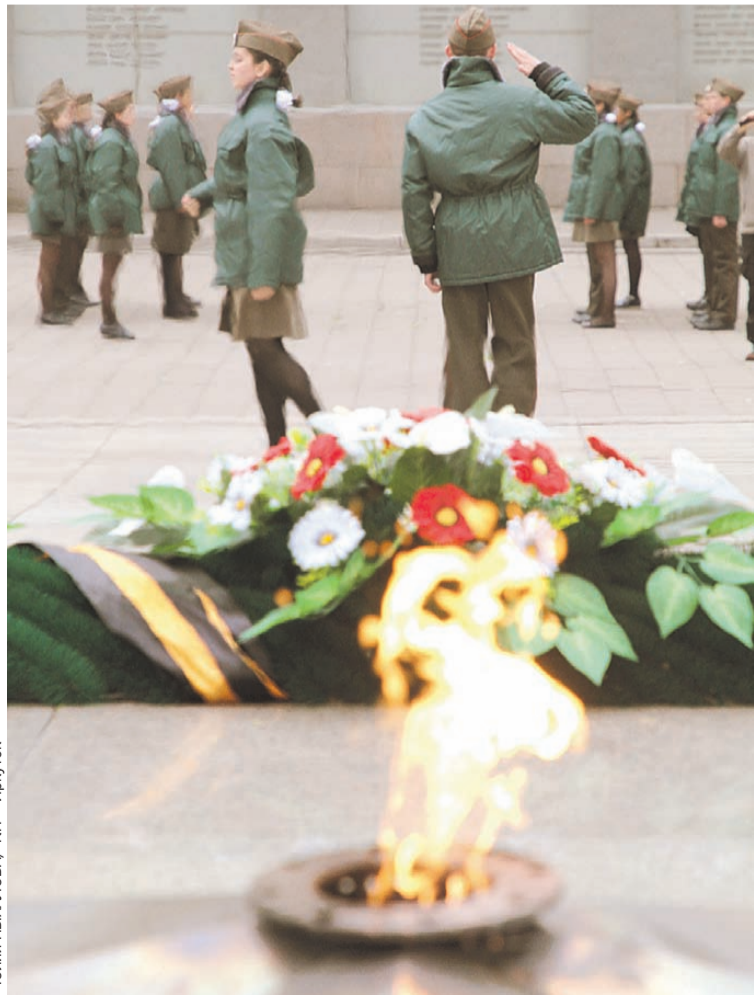
Целую неделю ребята стараются достойно отстоять смену.

В будущем планируется провести конкурс, подобный «Лучшему в смене». Пока же студенты шьют форму и определяются с составом.