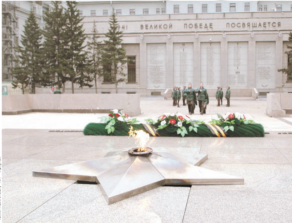
У Вечного огня стоит почетный караул.

Хотя почему бы не участвовать, если от уроков школа освобождает, да и программа интересная и насыщенная. Часовыми можно стать с 8-го класса до середины 11-го. План воспитательной рабо-