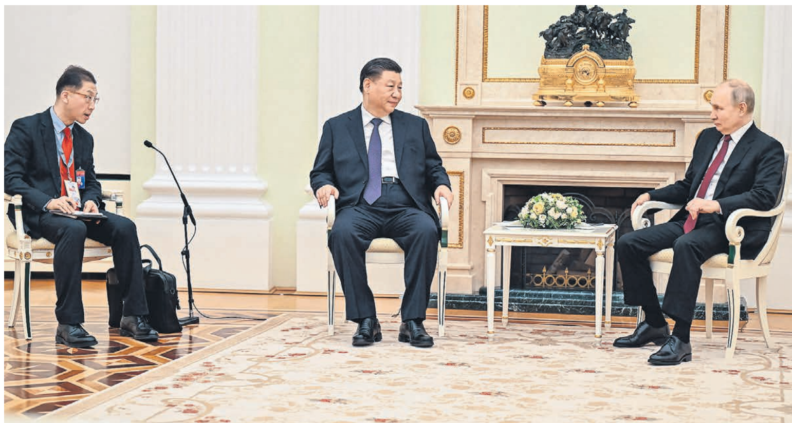
Переговоры в какой-то момент стали казаться трехсторонними

Вечерняя беседа за ужином в первый же день — это необычно для формата государственного визита. При этом минимум журналистов. Китайцы, которые обычно приезжают в несметном количестве, на этот раз, по данным „Ъ“, не выбрали даже свою квартиру, и так маленькую. Но те, что