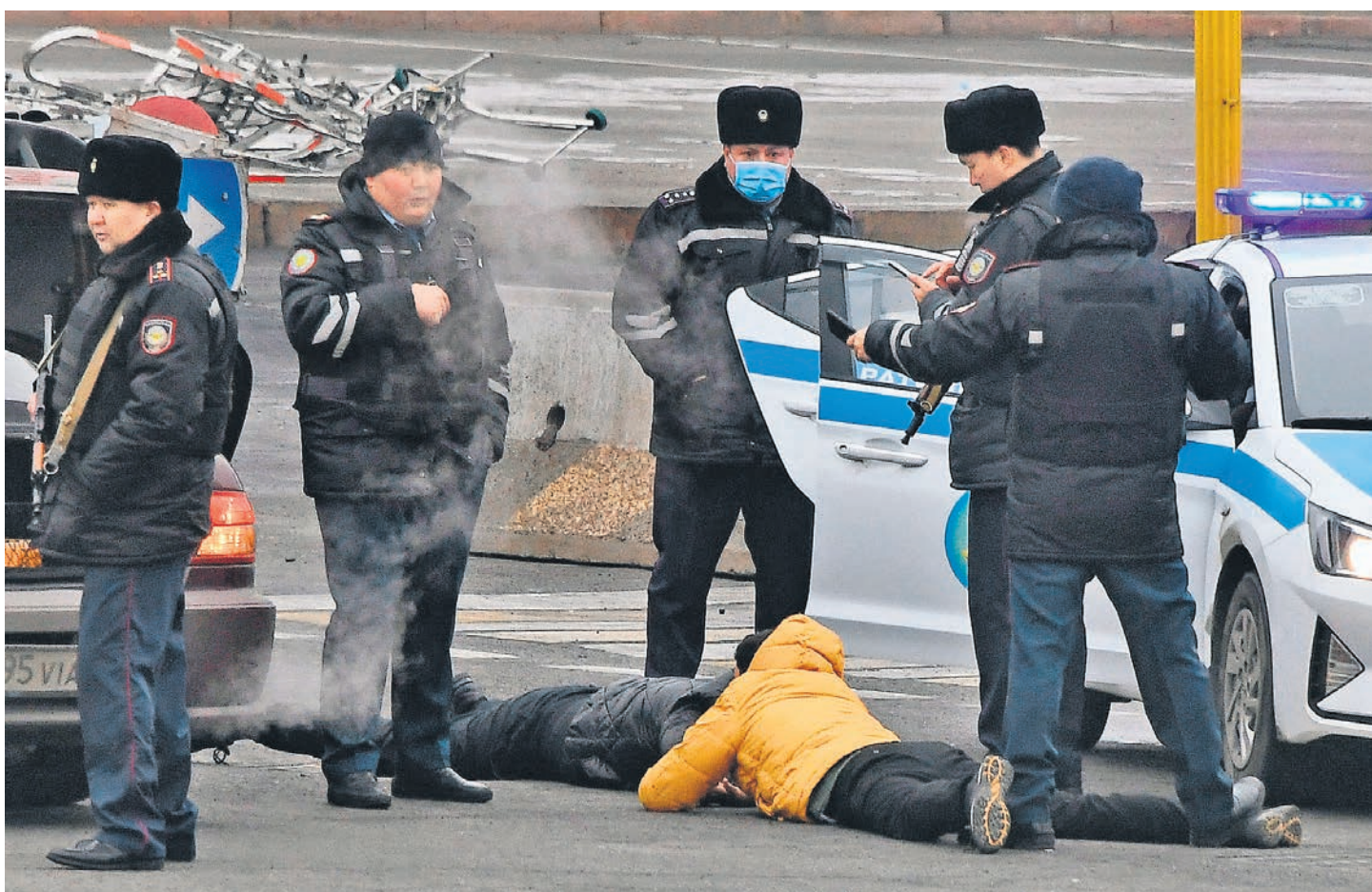
Террористов в таких одеждах и захочешь, а не пропустишь

Все участники видеоконференции встали со своих мест в своих рабочих кабинетах. Больше всего интересовала речь, конечно, Касым-Жомарта Токаева, президента Казахстана. Ему ведь предстояло убрать во-