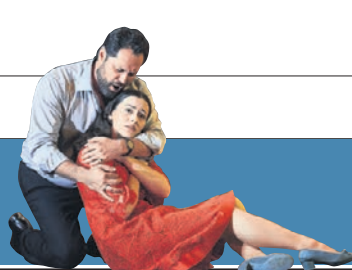
Режиссер Иво ван Хове и дирижер Владимир Юровский выпустили премьеру новой постановки «Бориса Годунова» Мусоргского в Парижской опере