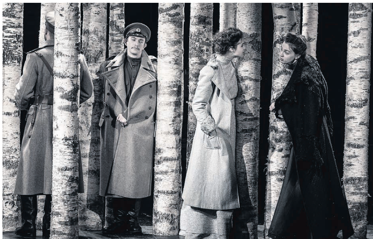
Идилличность березок может ввести в заблуждение разве что на первых минутах довольно злого спектакля

И нтерес к классическим театральным текстам идет своего рода волнами — предыдущий знаковый всплеск интереса к «Трех сестрам» пришел на начало 1980-х. Тогда на московских сценах в одном сезоне оказались четыре одноименных премьеры, а журнал «Театр» опубликовал статью под навсегда запомнившимся названием «12 сестер Прозоровых». Вот и в последние три сезона программные постановки пьесы появились в нескольких российских театрах — от новосибирского «Красного факела» до БДТ. Сдвоенная премьера МХТ-СТИ стала своего рода знаковой кульминацией нового интереса — для обоих постановщиков это название никак не могло быть проходным.