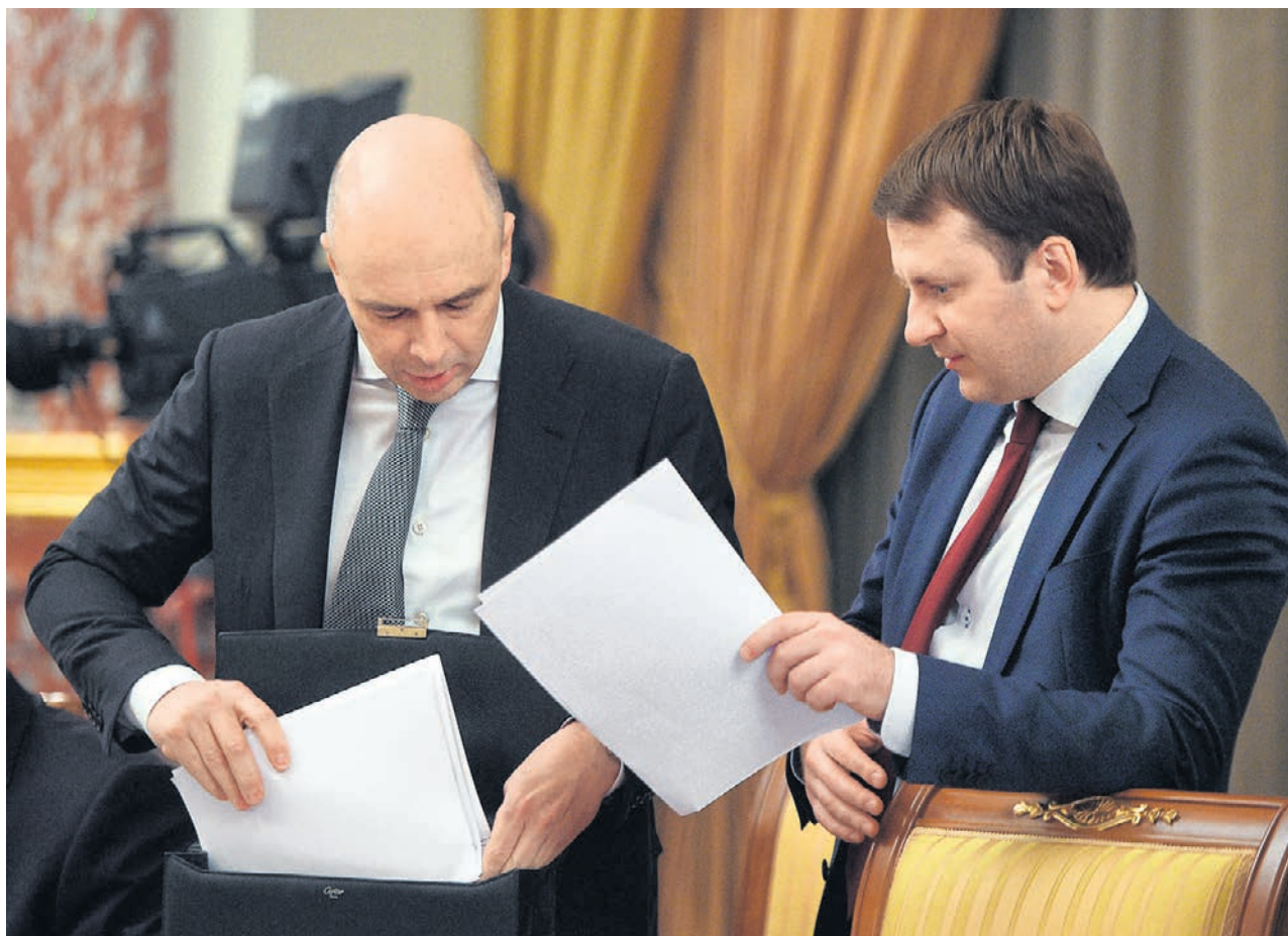
По настоянию первого вице-премьера Антона Силуанова (слева) инфраструктурные идеи министра экономики Максима Орешкина будут упакованы в бюджетный портфель расходов.