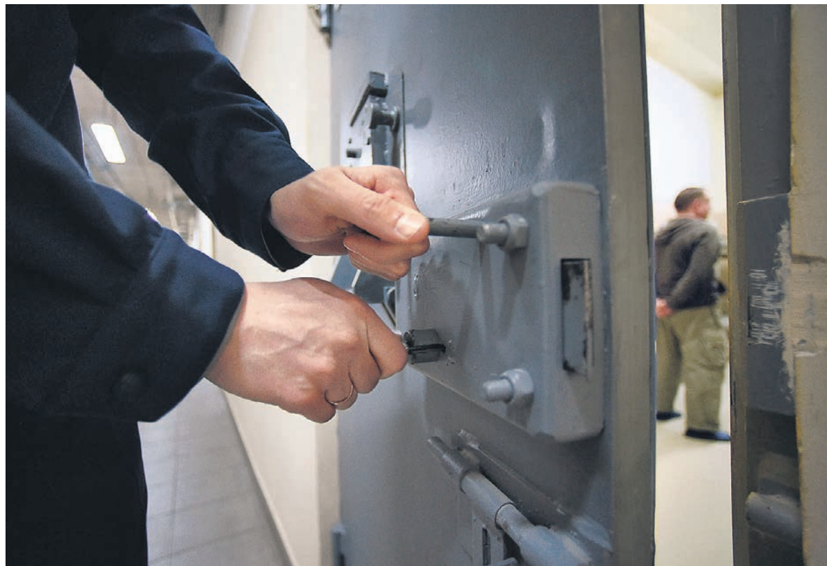
Общественники просят открыть для ознакомления ведомственные акты по охране учреждений ФСИН

«Судья обязал Минюст предоставить данный приказ, но министерство прислало лишь текст приказа, без приложения — самой инструкции, хотя приложение является частью этого нормативного акта, именно в нем содержится норма, опреде-