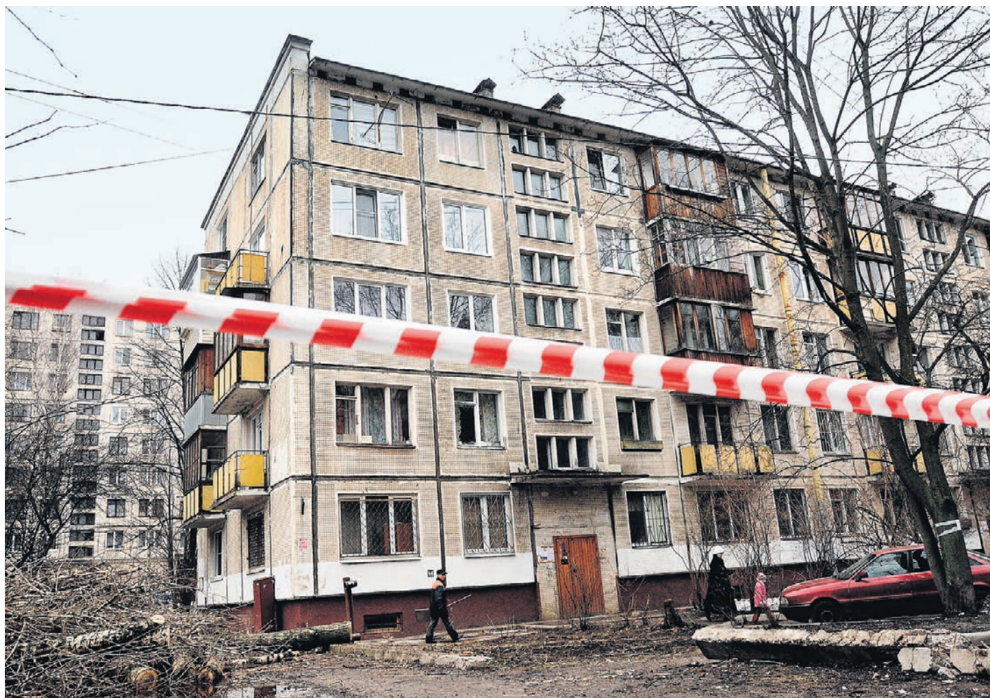
Законопроектом о реновации предлагается разграничить права чиновников и жителей пятиэтажек

Законопроект о реновации внесен в Госдуму в марте 2017 года группой депутатов от Москвы. Документ наделяет городские власти широкими полномочиями по сносу пятиэтажек и «конструктивно аналогичных» домов целыми кварталами и правами свободно менять в зонах реновации высотность зданий, назначение земель и даже отступать в проектах от пожарных и санитарных требований. Переселенцы могут рассчитывать на «равнозначное благоустроенное» жилье в том же районе или соседнем, кроме обитателей ЦАО, Новой Москвы и Зеленограда — им квартиру дадут в пределах округа. Квартиры большей площади (по социальным нормативам, до 18 кв. м на жильца) обещаны лишь очередникам. Переселять жильцов из запланированных к сносу домов при их несогласии с предложенными вариантами переезда предлагается по истечении 60 дней через суд. Количество вариантов при этом в документе не оговаривается. Власти просят узаконить особую процедуру в судах, разрешив переселенцам судиться лишь о размере новых квартир, а не о законности, например, сноса дома. Эксперты ранее говорили, «Б», что таких полномочий чиновники не получали и при подготовке к Олимпиаде в Сочи.