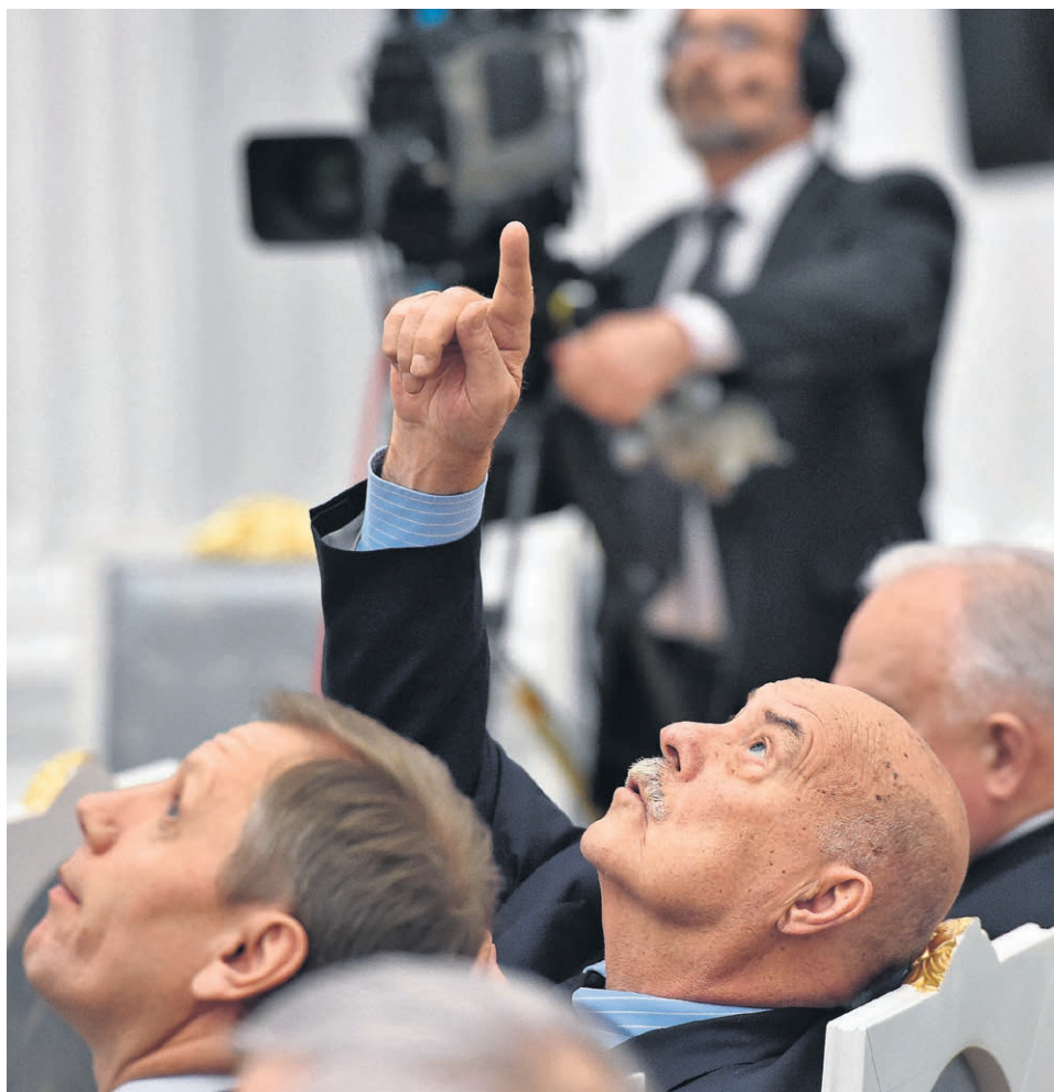
Станислав Говорухин призывает прикрыть произведения искусства от нападок

Сегодня думский комитет по культуре может рассмотреть «законодательные инициативы по проблеме нравственных ограничений в искусстве и защите от вандализма в отношении произведений искусства», сообщили „Ъ“ в комитете. Члены комитета должны обсудить несколько инициатив его председателя Станислава Говорухина, в том числе поправки к Уголовному кодексу (УК) и Кодексу об административных правонарушениях (КоАП) о дополнительных мерах ответственности за осквернение объектов культуры. Это стало ответом в том числе на действия активистов, принуждавших к закрытию скандальных выставок. Дискуссия о допустимости цензуры в искусстве может продолжиться на президентском Совете по культуре 2 декабря.