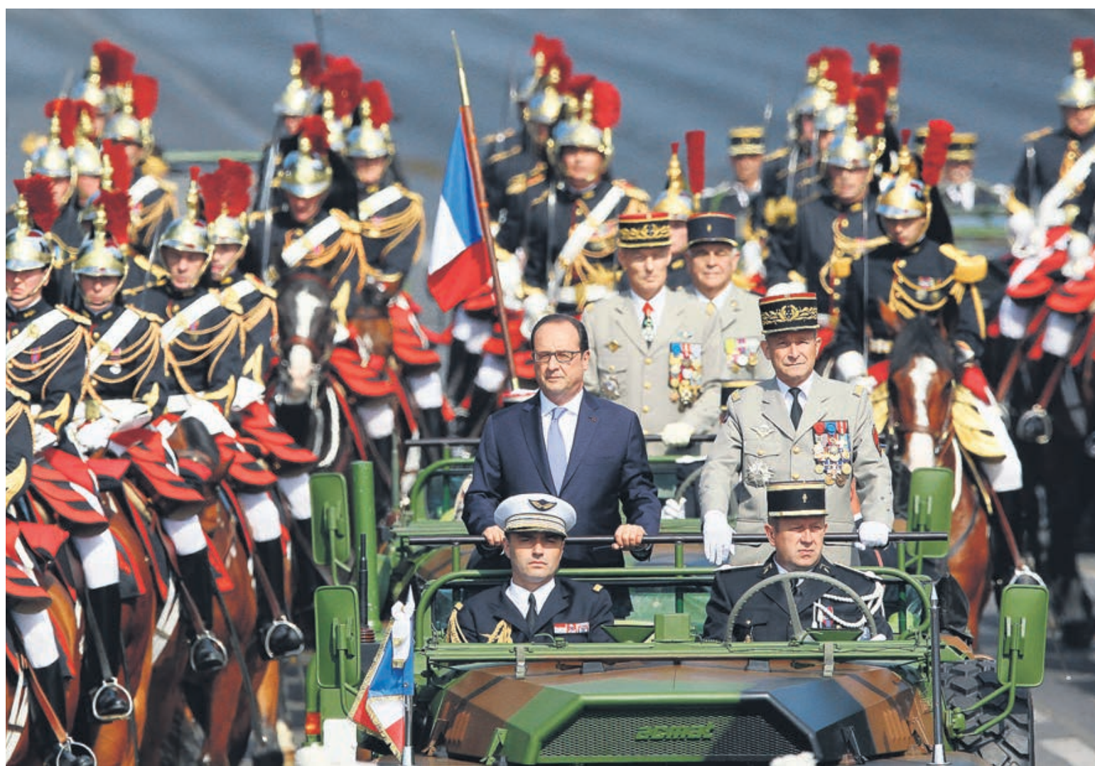
Президент Франции Франсуа Олланд готов возглавить не только вооруженные силы своей страны, но и международную антитеррористическую коалицию

Главным последствием терактов в Париже стало начавшееся переформатирование мировой политики, инициатором которого выступил президент Франции Франсуа Олланд. После саммита G20 в Анталии глава государства, подвергшегося крупнейшей террористической атаке в своей истории, предложил создать единую коалицию для борьбы с «Исламским государством», заявив о готовности обсудить это с лидерами США и России. Идея Франсуа Олланда перекликается с предложением президента Владимира Путина о формировании единого фронта против ИГ, не нашедшим поддержки в связи с глубоким кризисом в отношениях между Россией и Западом и их разногласиями по Сирии. Инициатива Парижа может стать катализатором нового сближения мировых держав, но создать коалицию, подобную той, которая возникла в мире после терактов 11 сентября 2001 года, будет непросто. Большинство ключевых игроков Ближнего Востока даже после парижской трагедии не считают борьбу с ИГ своим главным приоритетом.