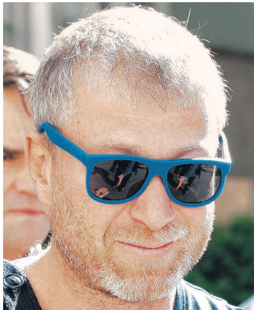
Роман Абрамович (на фото) вчистую выиграл у Бориса Березовского процесс в лондонском суде, отказавшись признать претензии последнего на доли в «Сибнефти» и «Русале», а также «давление» владельца «Челси» на истца. Проигрыш господина Березовского, привыкшего к судебным триумфам в Лондоне, был столь сокрушительным, что теперь многие уверены: подобных ему желающих посудиться там по поводу своего русского бизнес-прошлого не найдется