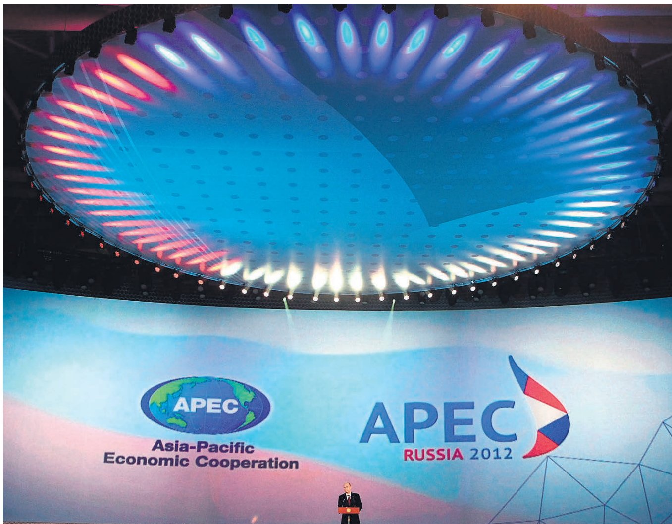
К саммиту АТЭС на острове Русском во Владивостоке правительство готовилось так долго и так отчаянно, что, кажется, само удивилось тому, что в сентябре 2012 года все произошло так, как ожидалось, — успешно. Впрочем, теперь Следственный комитет, Счетная палата и Генпрокуратура пытаются вернуть ситуацию в привычное русло, разыскивая многомиллиардные хищения на главной стройке года