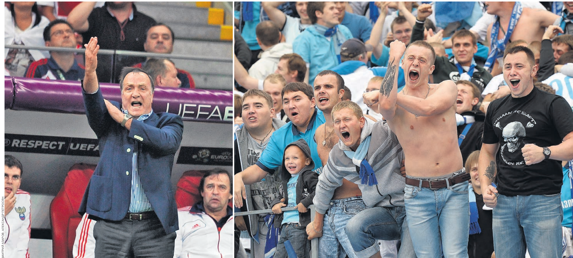
В этом сезоне провалились и футбольная сборная России, и ее болельщики. На чемпионате Европы национальная команда под руководством Дика Адвоката не смогла выйти из, возможно, самой легкой группы, а фанаты, похулиганив на польских стадионах, затем стали срывать матчи во внутреннем первенстве, вынудив Госдуму рассмотреть специальный закон, регламентирующий поведение болельщиков