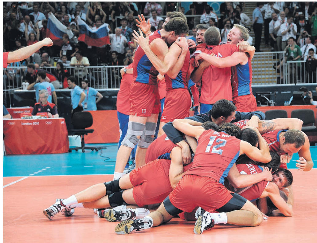
Благодаря феноменальному финишному рывку, в котором победами отметились легкоатлеты, борцы, боксеры, гребцы, гимнастки и особенно волейболисты (на фото), спасшие безнадежно складывавшийся финал против бразильцев, сборная России смогла спасти для себя казавшиеся безнадежными итоги Игр. И пусть она не попала в топ-тройку медального зачета, зато завоевала наград больше, чем четыре года назад в Пекине