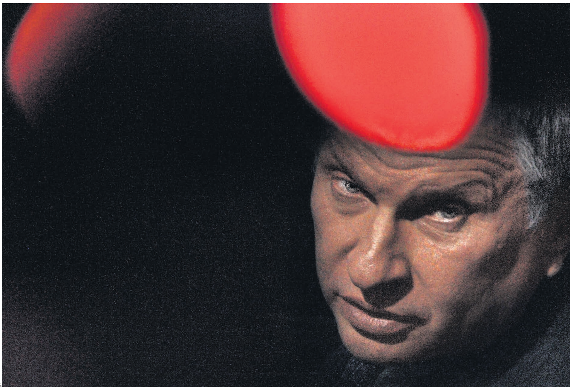
Игорь Сечин, последние четыре года курировавший российский ТЭК в правительстве Владимира Путина, перешел от теории к практике: возглавил главную нефтяную компанию страны «Роснефть». Эффект наступил незамедлительно: «Роснефть» купила одну из крупнейших частных нефтекомпаний России, ТНК-ВР, и всерьез занялась рынком газа