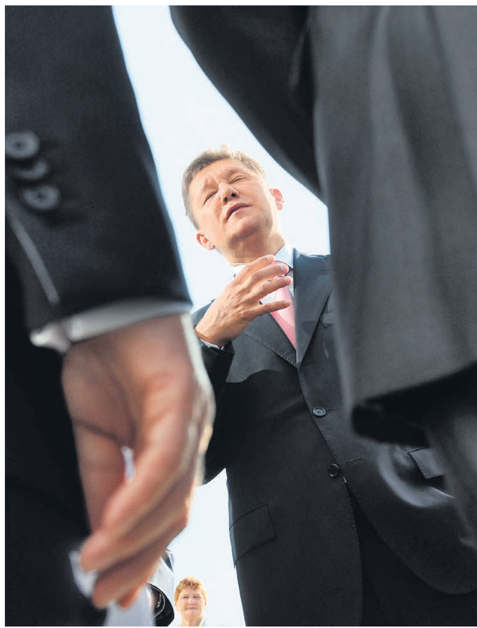
Евросоюз начал открытую войну против «Газпрома», официально предъявив концерну антимонопольные претензии. Пока расследование не завершено — его затянули российские власти, запретившие стратегическим компаниям без санкции правительства предоставлять информацию иностранным организациям. И до сих пор оснований для выдачи сведений Еврокомиссии чиновники не нашли