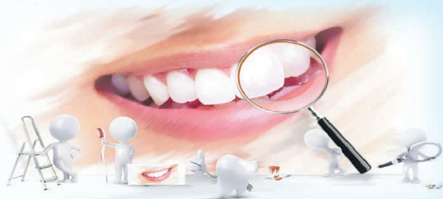
График работы с 9 до 21 ч.