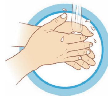
ЧАСТО МОЙТЕ РУКИ С МЫЛОМ