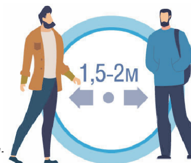
СОБЛЮДАЙТЕ РАССТОЯНИЕ И ЭТИКЕТ