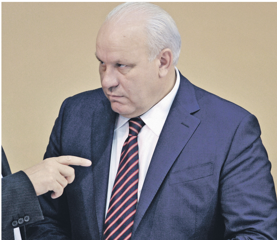
Глава Хакасии Виктор Зимин может покинуть свой пост после инаугурации президента 7 мая, утверждает один из источников РБК

По мнению главы холдинга «Петербургская политика» Михаила Виноградова, слабые позиции губернатора Зимина, в частности, связаны с арестами высокопоставленных чиновников в администрации региона.