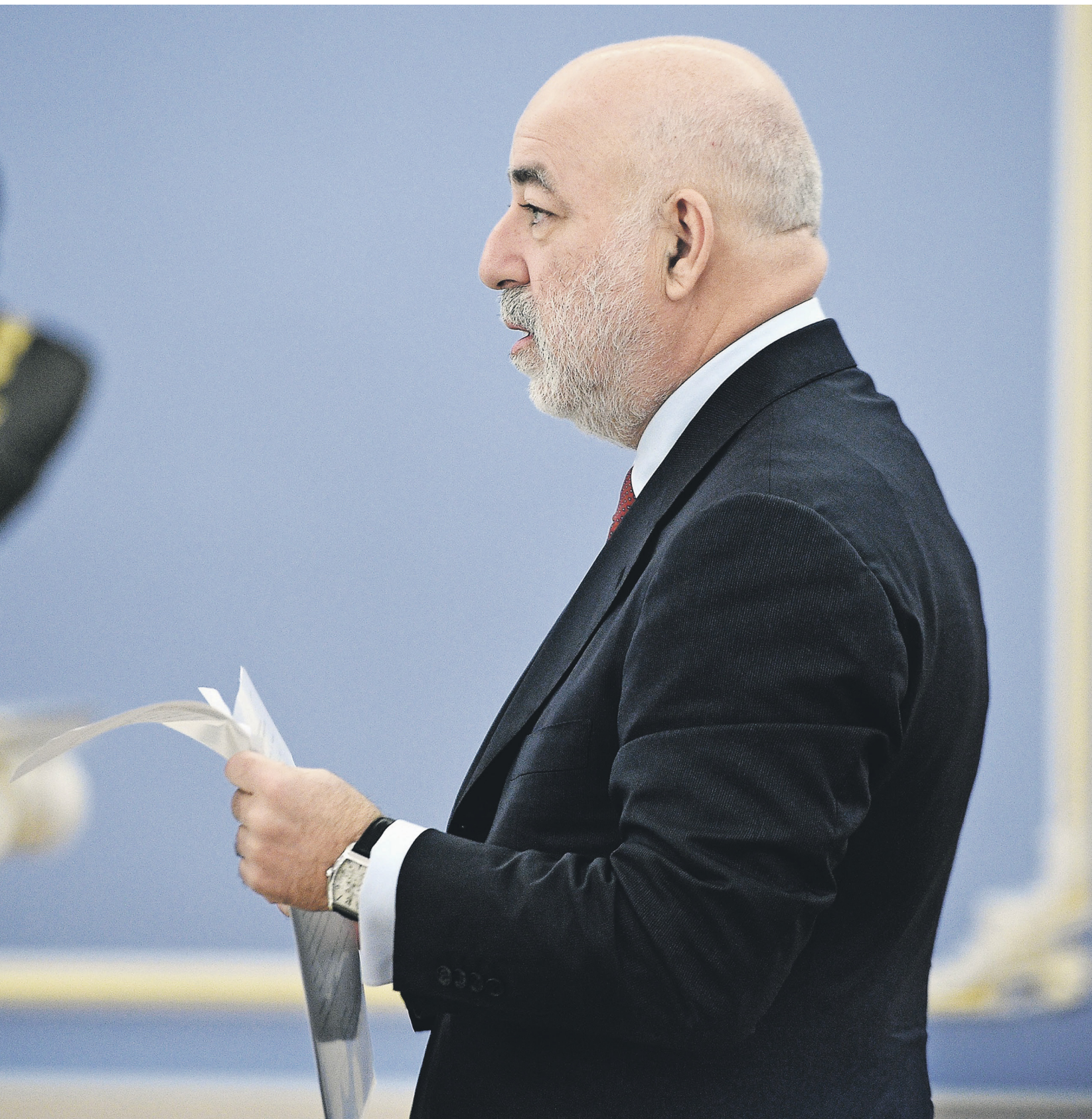
...а стоимостью от $1,5 млрд до $2 млрд были заморожены. От санкций владельца «Реновы» не застраховали ни близкие родственники в Америке, ни политических, деловых и гуманитарных кругов США и Европы

(FEC), собранные РБК. Из них символические $2 тыс. в 2002 году внес лично Виктор Вексельберг — в адрес избирательного комитета сенатора-демократа Чака Шумера Friends of Schumer, следует из данных FEC. По американскому законодательству о финансировании избирательных кампаний такие взносы могут делать только граждане США или обладатели вида на жительство.