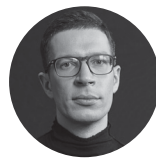
Илья Кретов генеральный директор eBay в России, Израиле и на развивающихся рынках Европы

В 2019 году мы организуем участие столичных компаний в 25 международных выставках под единым брендом Made in Moscow. География выставочных мероприятий обширна: Китай, Япония, страны Ближнего Востока, Европы и Латинской Америки. Важно отметить, что выставки были выбраны по открытому голосованию самих экспортеров.