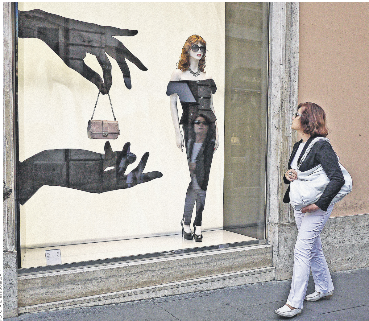
Рост формата монобрендовых магазинов, к которому обратился модный дом Christian Dior, эксперты связывают с желанием покупателей получать дополнительные услуги

Косметика и парфюмерия Christian Dior относятся к люксовому сегменту рынка (стоимость помады/туши Dior — порядка 2,5 руб., пудры — 3–4 тыс. руб.), основные конкуренты бренда — Chanel, Estée Lauder, Lancôme, Guerlain, напоминает эксперт по ретейлу и товарам