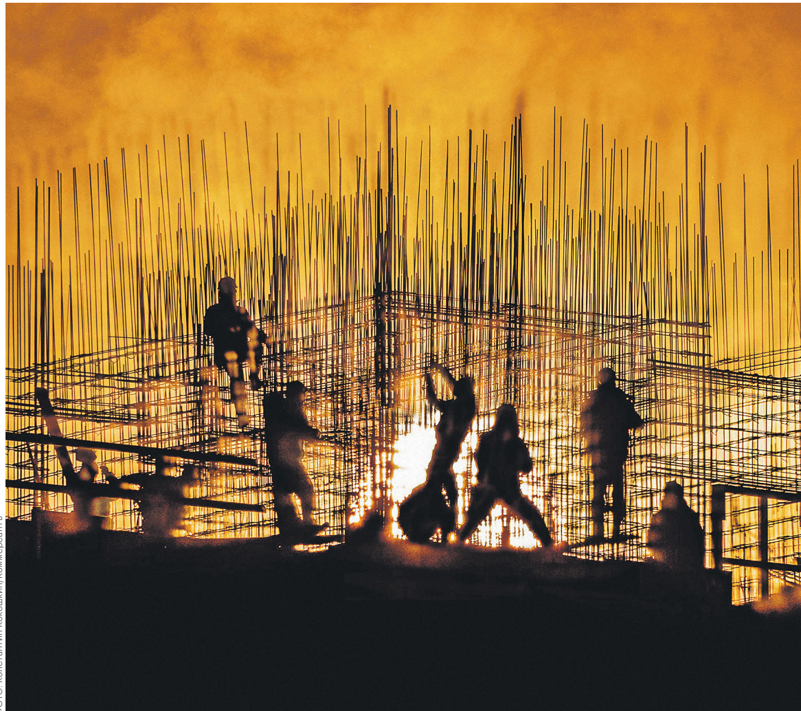
В октябре и ноябре банки выдали почти по 300 млрд руб. ипотечных кредитов

С учетом предварительных оценок за ноябрь за 11 месяцев 2018 года российские банки выдали ипотеки на 2,67 трлн руб. Данных по росту кредитного портфеля пока нет. Но ипотека растет в основном за счет новых кредитов, говорят в «Дом.РФ», на рефинансирование, например, в октябре пришлось всего 8,7%, тогда как в среднем с начала года этот показатель составил 11%.