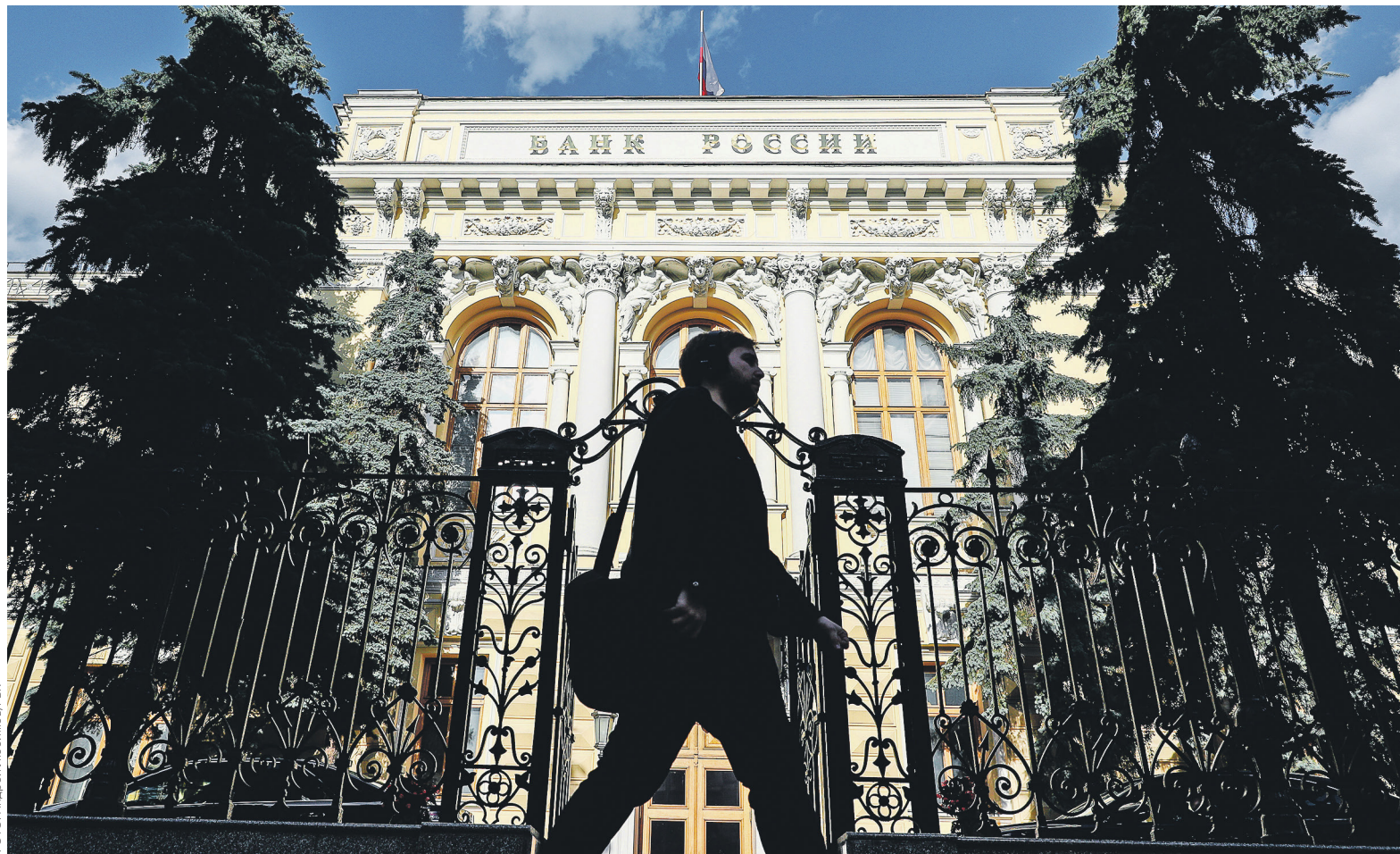
В начале 2014 года на рынке работали 120 НПФ, зарегистрированных в форме некоммерческих организаций, к концу 2018 года осталось 52 — все в форме акционерных обществ, констатировал ЦБ

В период реформы ЦБ неоднократно выражал озабоченность качеством вложений НПФ, особенно в части инвестирования пенсионных накоплений граждан. В начале 2017