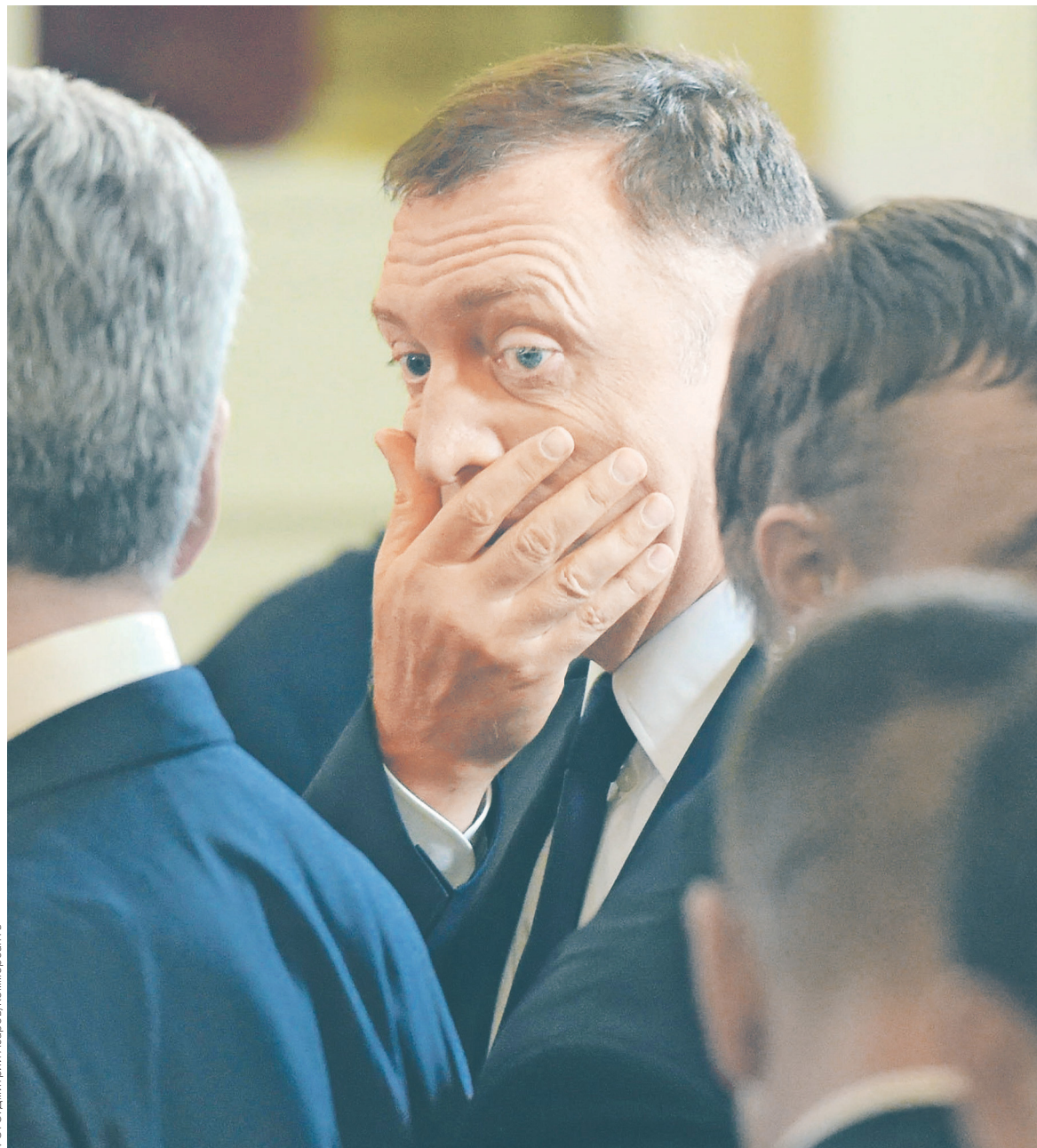
Американские санкции в отношении самого Олега Дерипаски сохраняются

25% En+, на которые Дерипаска снизит свой пакет в En+, получит банк ВТБ или другая сторона, одобренная OFAC, следует из его сообщения. Структуры Дерипаски уже заложили эти акции в ВТБ под определенные обязательства, указывает OFAC. В среду вечером представитель ВТБ, который является крупнейшим кредитором En+ и других структур Дерипаски, не ответил на запрос РБК. ВТБ сейчас находится в секторальном санкционном списке. Но если банк, получивший 25% En+, попадет в самый строгий санкционный список SDN (в нем сейчас находятся En+, UC Rusal и Дерипаска), то алюминиевая компания снова может попасть под ограничения: