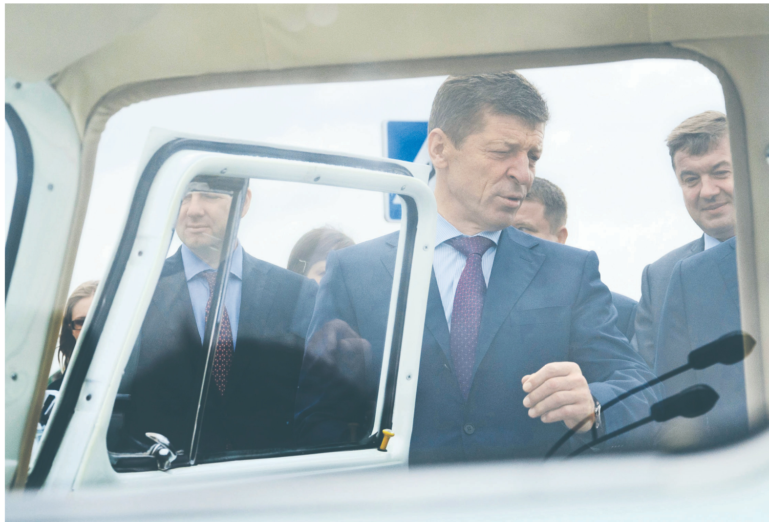
Реализация программы развития рынка газомоторного топлива на 2019–2024 годы оценивается в 174,7 млрд руб. бюджетных средств. На фото: вице-премьер Дмитрий Козак

Сейчас госкомпании, как и другие участники рынка, переводят технику на газ на добровольной