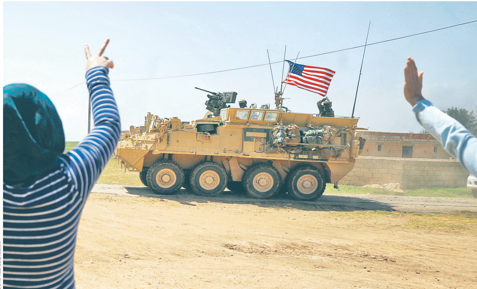
Американские силы в Сирии действовали как на севере — в районе контролируемого курдами Манбиджа, так и на юге страны, где находится база Эт-Танф, главный центр военной подготовки союзных коалиции сирийских сил

В Республиканской партии к решению президента отношение противоречивое. Сенаторы-республиканцы Линдси Грэм и Марко Рубио (члены международного комитета сената) его осудили. По мнению Рубио, который выступал в эфире CNN, оно ставит США под удар, в том числе потому, что союзники, в первую очередь европейские страны и региональные державы, теперь будут смотреть на Америку как на ненадежного партнера. Сенатор Грэм написал в Twitter, что решение президента противоречит его же планам по сдерживанию Ирана на Ближнем Востоке, а также ставит под удар союзников США в Сирии — курдов. Бойцов ИГ это решение только подстегнет в их желании вернуться в Сирию, предупредил