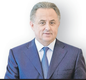
Виталий Мутко, заместитель председателя правительства

ЕЖЕДНЕВНАЯ ДЕЛОВАЯ ГАЗЕТА 20 декабря 2018 Четверг № 225 (2949)