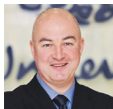
АЛАН ДЖОУП UNILEVER