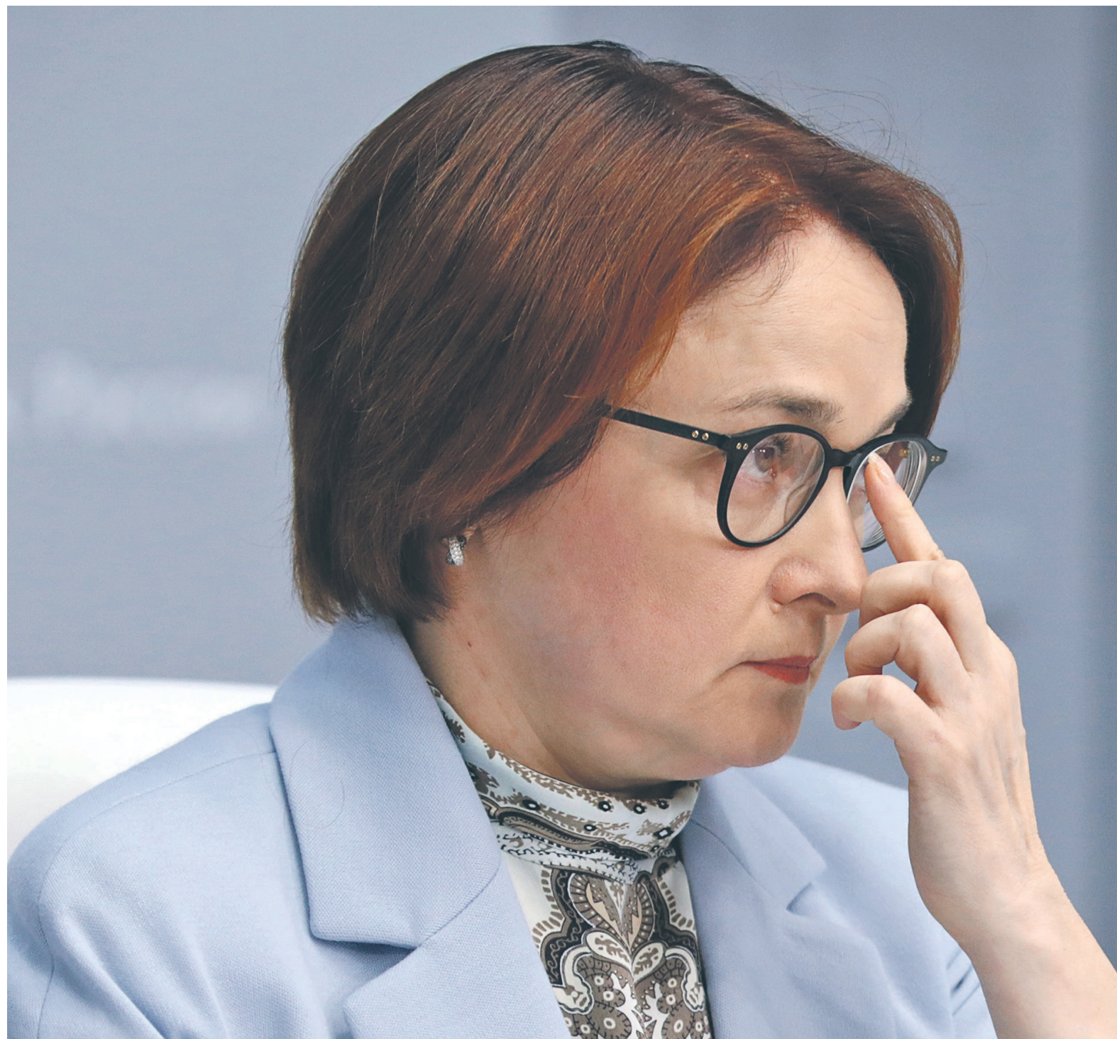
Трудно прогнозировать, будет ли ЦБ дальше повышать ключевую ставку: регулятор рассмотрит такую возможность в зависимости от инфляции и внешних рисков, заявила глава ЦБ Эльвира Набиуллина

«В августе произошло изменение геополитических факторов, возросла неопределенность относительно санкций против России. Возросшие геополитические риски наложились на отток капитала из развивающихся стран», — пояснила Набиуллина.