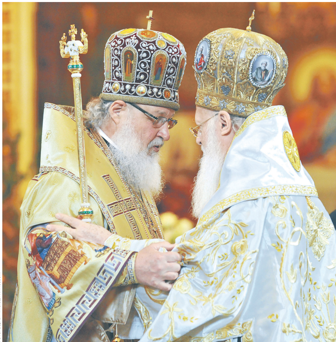
Патриарх Московский и всея Руси Кирилл (слева) больше не будет совершать поминания константинопольского патриарха Варфоломея (справа)

Перед началом заседания Синода патриарх Кирилл заявил, что Московский патриархат располагает достоверными сведениями о том, что константинопольские экзархи уже прибыли на Украину