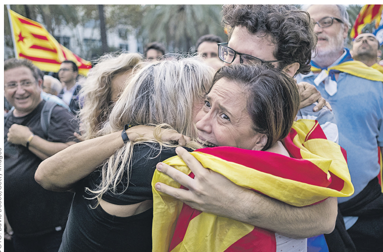
↑ Около 30 тыс. человек собрались рядом со зданием парламента, чтобы посмотреть трансляцию на больших экранах. После того как провозглашение независимости было отложено, большинство остались разочарованы. «Нас обманули» — так передает настроение собравшихся одна из ведущих испанских газет El Pais