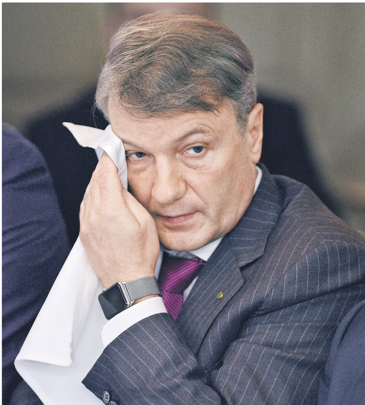
Сбербанк не смог отстоять банковскую тайну в суде. На фото: глава Сбербанка Герман Греф

В резолютивной части определения, опубликованной еще 21 сентября, обоснования позиции ВС не было. Теперь, когда появилась мотивировочная часть, стали ясны аргументы суда. И хотя окончательное решение по спору формально не вынесено и ВС направил дело на пересмотр в первую инстанцию, использованные им аргументы свидетельствуют, что он скорее поддержал налоговиков, считают юристы. Суду первой инстанции предписано в том числе рассмотреть вопросы об ответственности банка за нарушение законов об исполнении производств и судебных приставов и о необходимости соблюдения банковской тайны, следует из решения ВС.