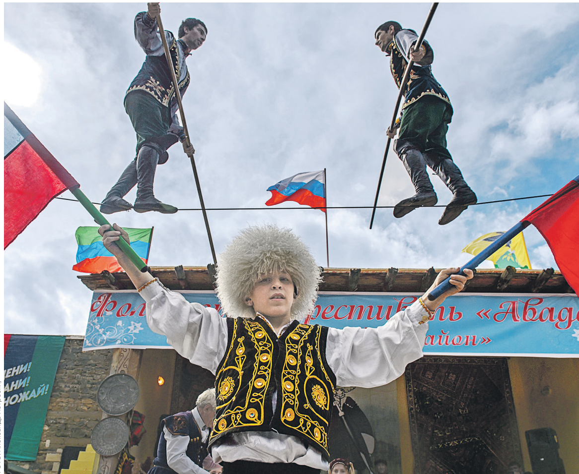
Дагестан получит из бюджета самые крупные дотации на выравнивание третий год подряд

Самым крупным получателем дотаций на выравнивание третий год подряд станет Дагестан — из федерального бюджета республика получит более 59 млрд руб., на 6,6 млрд руб. больше, чем в текущем году. А наибольший прирост по объему дотаций в 2018 году продемонстрирует Якутия — в следующем году республика получит на выравнивание бюджетной