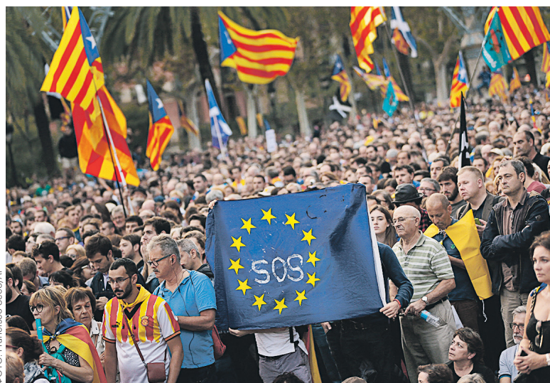
↑ В ожидании выступления главы правительства Каталонии Карлеса Пучдемона в Барселоне сторонники независимости продолжали манифестации. В руках демонстрантов были флаги Европейского союза, хотя руководство организации предупредило Барселону: после выхода из состава Испании Каталонии придется заново подавать заявку на вступление в ЕС