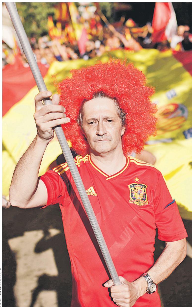
↑ Накануне решающего дня сотни тысяч граждан вышли на улицы в поддержку единства Испании. Масштабы выступления показали, что их мнение невозможно будет не учитывать при принятии дальнейших решений. «Мы больше не будем молчать» — таков был лозунг демонстрантов

«заработал право на самоопределение», и продолжил: «Каталония будет независимым государством с республиканской формой правления!» Собравшиеся у экранов закричали от радости; у кого-то на глазах выступили слезы. «Не-за-ви-си-мость!» — начала скандировать толпа, и тут Пучдемон продолжил: «...Через несколько недель». Затем он пояснил, что дает Евросоюзу и Мадриду еще немного времени, чтобы все-таки начать диалог.