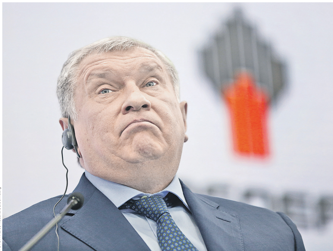
Основные замечания к закону предъявила «Роснефть». Главный исполнительный директор компании Игорь Сечин прислал министру энергетики Александру Новаку замечания к законопроекту на 25 листах

За неделю до назначенного на 14 июня заседания комиссии под руководством вице-премьера Аркадия Дворковича было решено, что на нем не будут обсуждать трубопроводную тематику — «из-за наличия неразрешимых разногласий по законопроекту», сообщил РБК один из приглашенных на это совещание — менед-