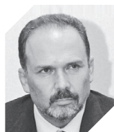
Михаил Мень Министерство Строительства и ЖКХ