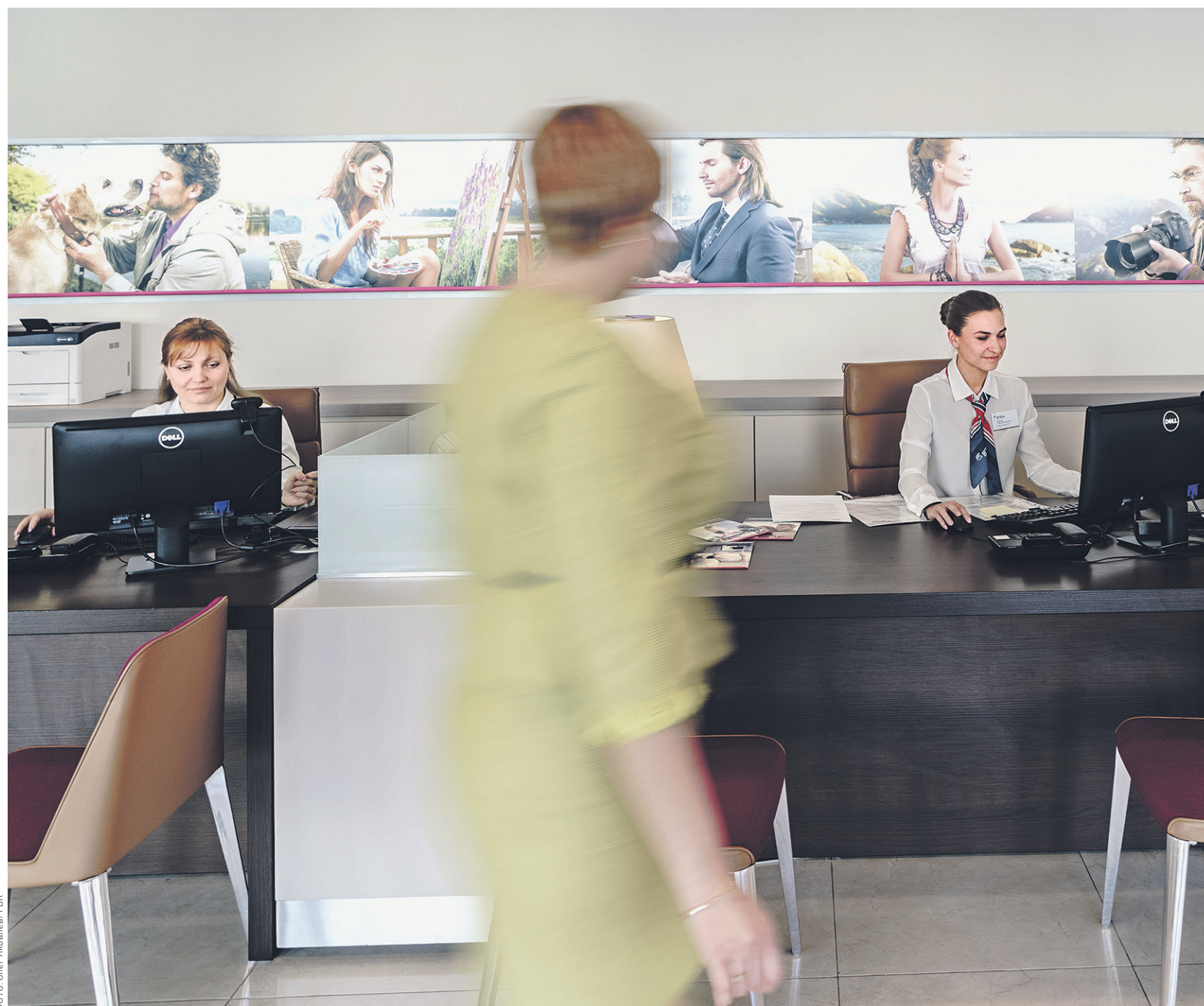
Наибольший спрос у банков наблюдается на специалистов отделов продаж и специалистов по рискам

Тинькофф Банк в январе—марте принял на работу 760 сотрудников. В банке связывают прирост кадров с развитием новых направлений бизнеса. «В апреле был запущен финансовый сервис «Тинькофф.ру», где уже сейчас любой пользователь может получить доступ не только к собственным продуктам Тинькофф Банка, но и к сервисам партнеров, например в рамках ипотечной платформы», — сообщили в пресс-службе банка. Тинькофф Банк нанимал персонал практически весь 2015 год. Согласно ежеквартальной отчетности банка, за год среднесписочная численность его сотрудников выросла с 4,2 тыс. до 4,6 тыс. человек. В мае 2015 года кредит-