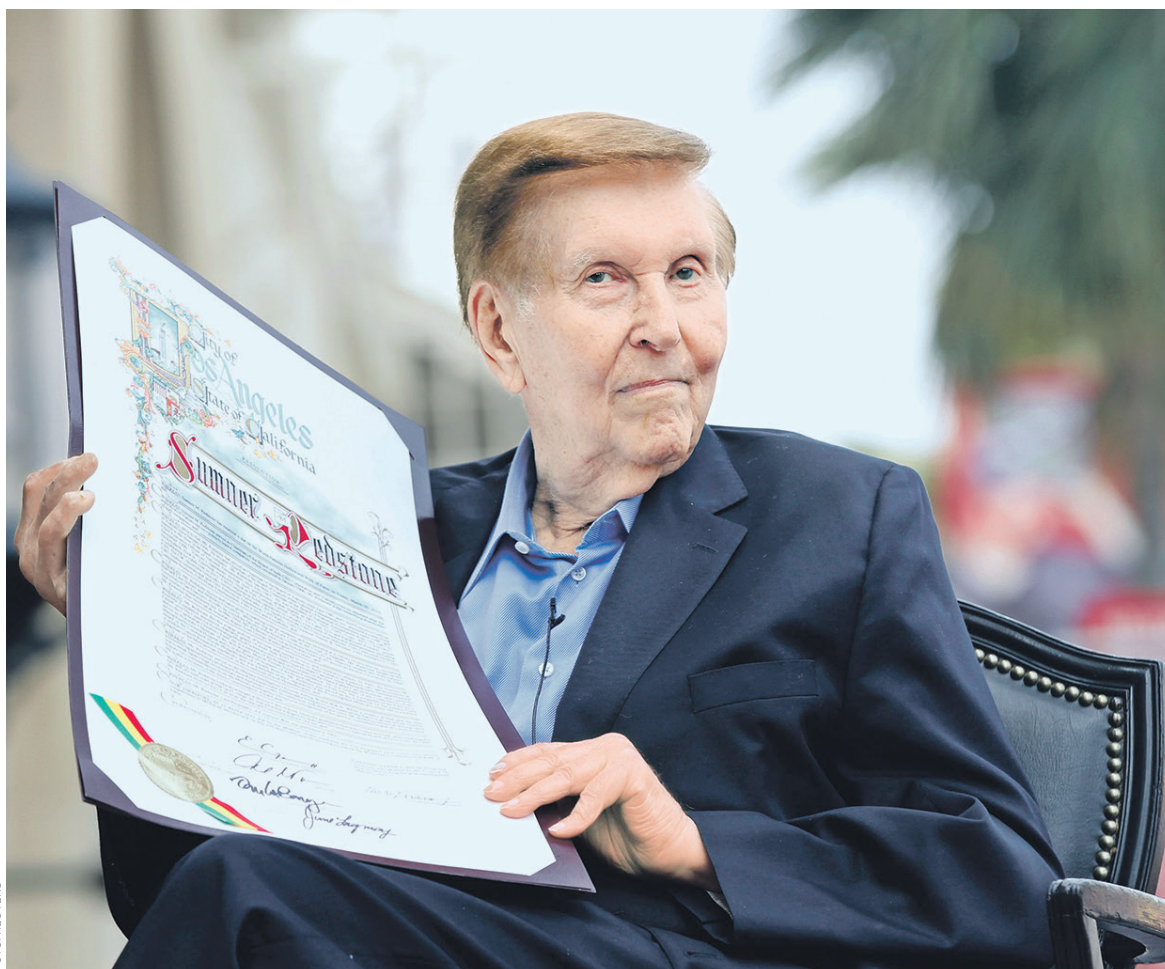
Самнер Редстоун, сделавший состояние на развлекательных медиа, говорил о своем бизнесе так: «Viacom — это я, а я — это Viacom»