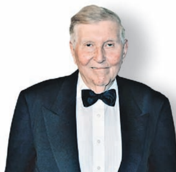
Самнер Редстоун, совладелец CBS и Viacom

Как сделать состояние на кино и телевидении