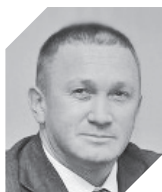
Герман Елянюшкин Правительство Московской области