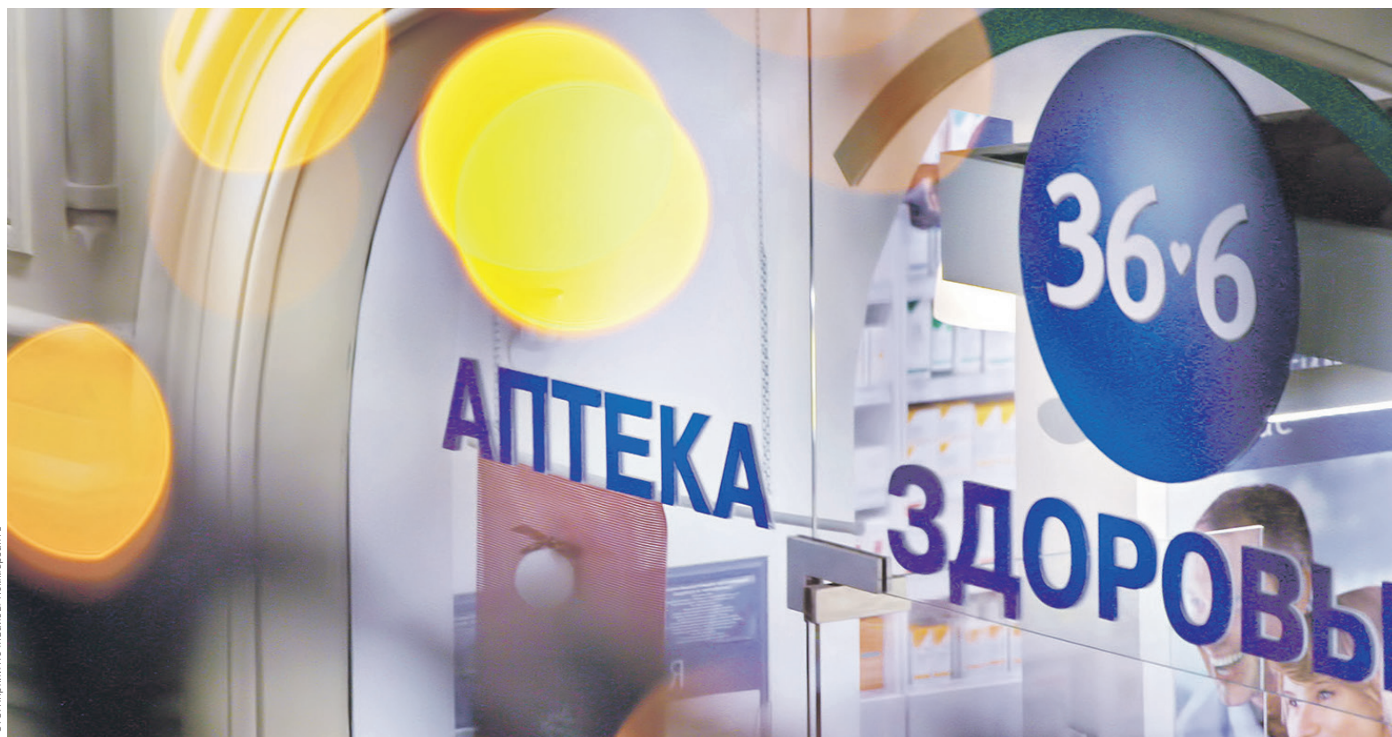
Аптечная сеть «36,6» до сих пор не расплатилась с крупнейшими поставщиками