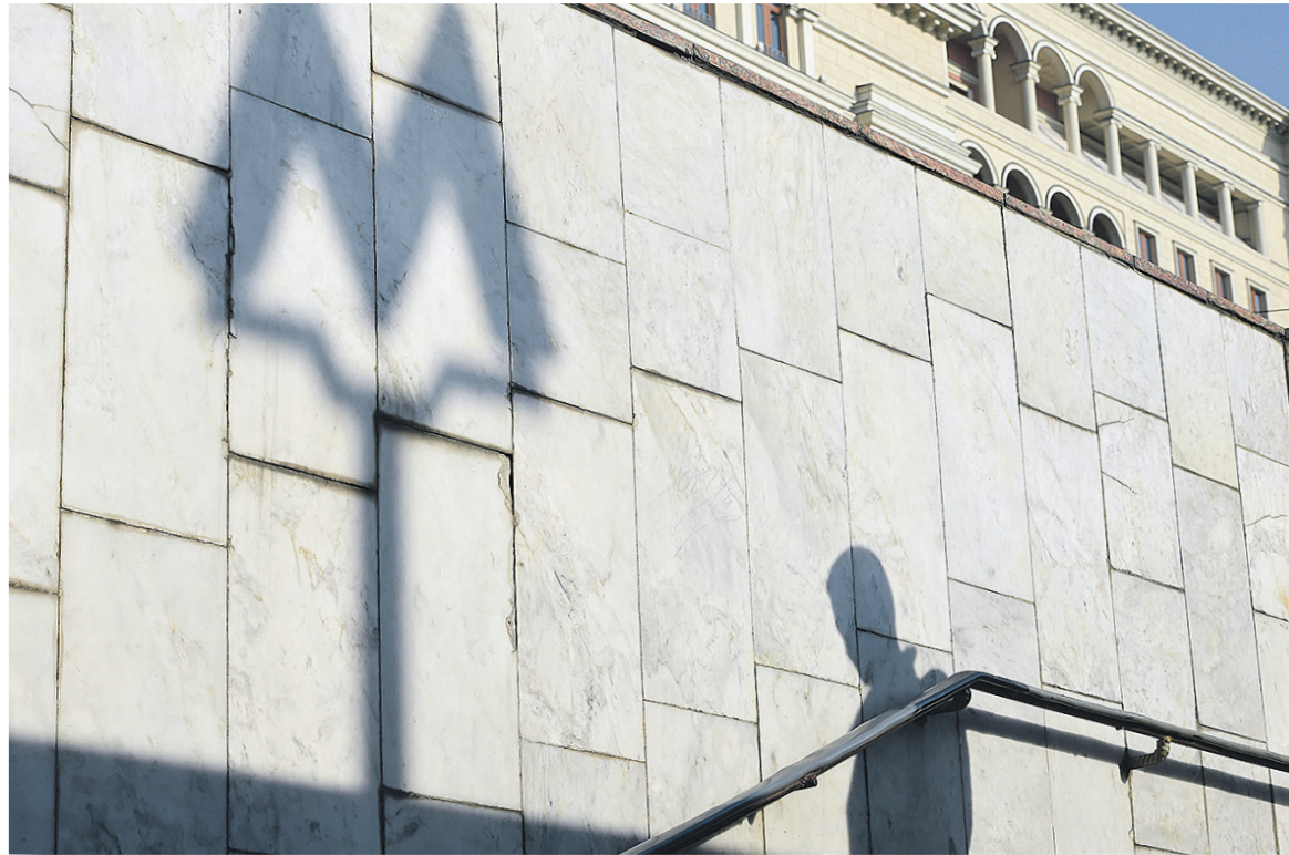
Московский метрополитен в среду провел 74 аукциона на право аренды торговых площадей

Как минимум один актив у «Воздвиженки» все же есть: если верить СПАРК, с 2009 года эта компания является совладельцем (50%) ООО