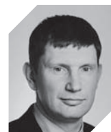
Максим Решетников Правительство Москвы