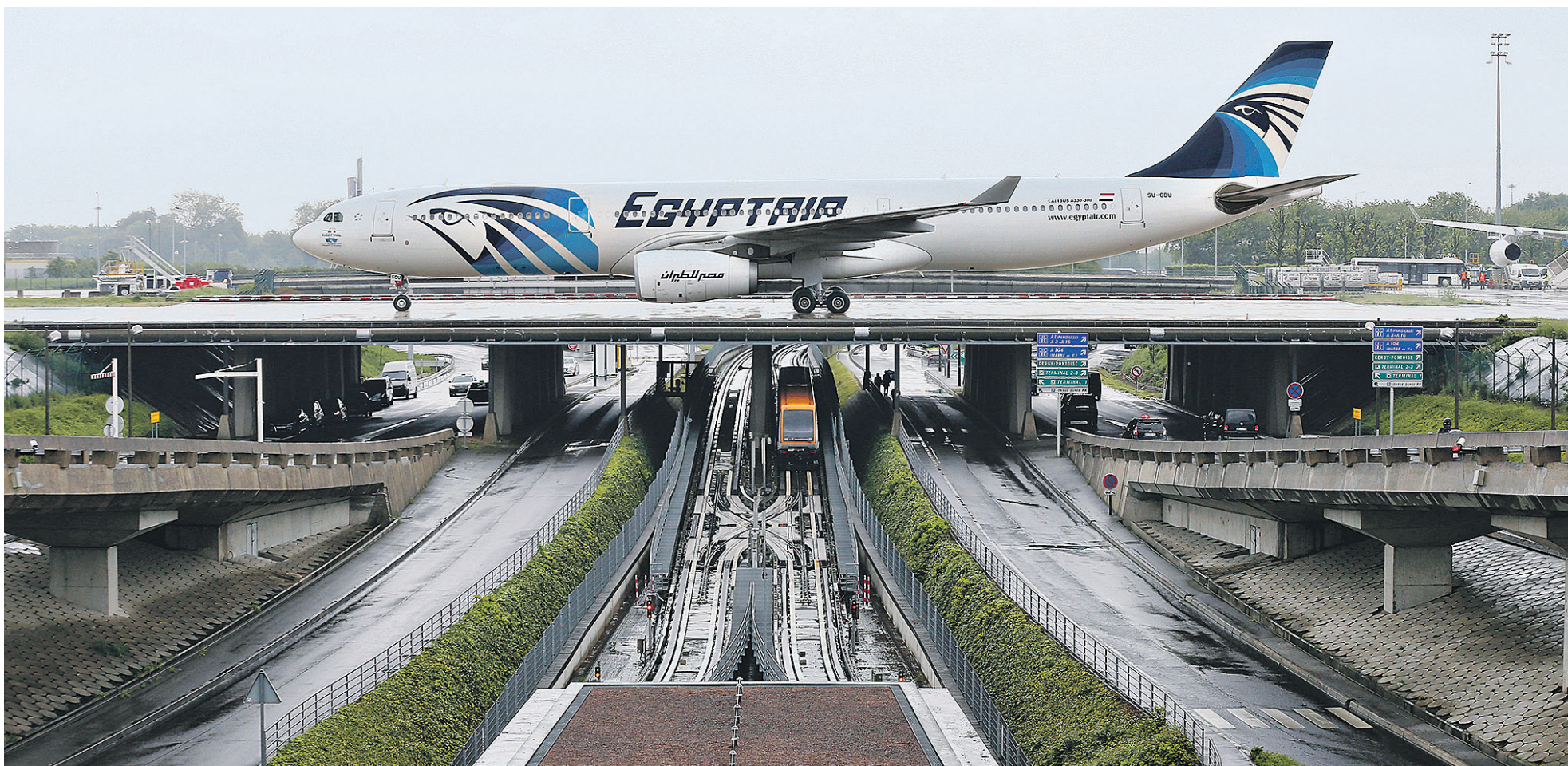
Несколько экспертов отмечают, что, скорее всего, на борту самолета AirEgypt (на фото — один из лайнеров авиакомпании) произошел инцидент, не имеющий отношения к техническим неполадкам

Что известно о самолете EgyptAir, разбившемся над Средиземным морем