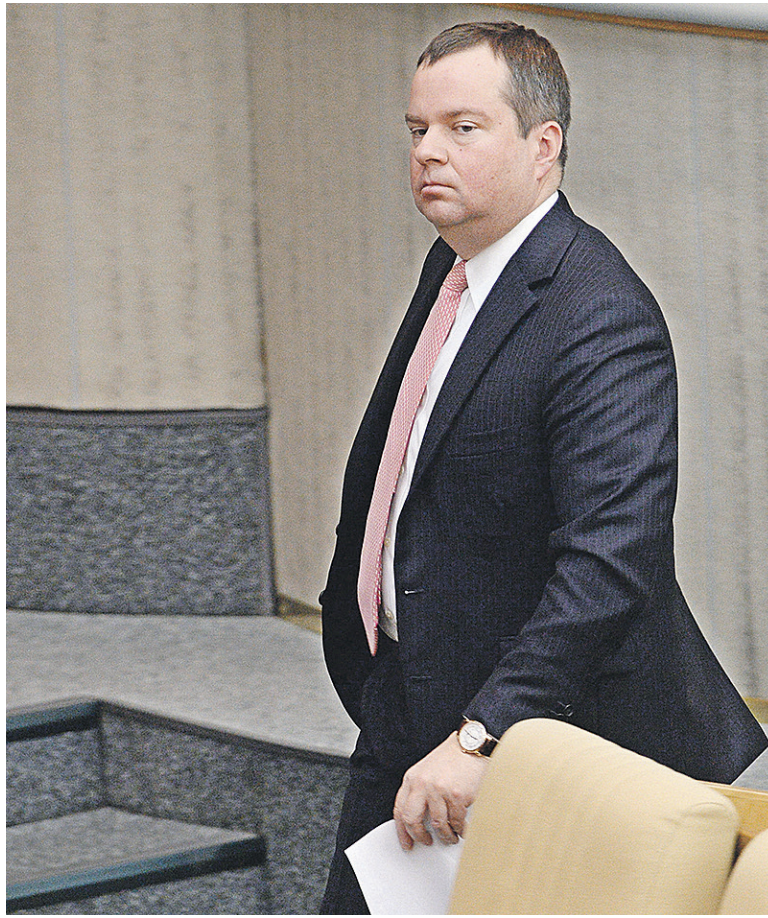
По замыслу Алексея Моисеева, люди с зарплатой больше 50 тыс. руб. в месяц будут копить себе на пенсию сами

По словам Моисеева, граждане с доходами 50–100 тыс. руб. долж-