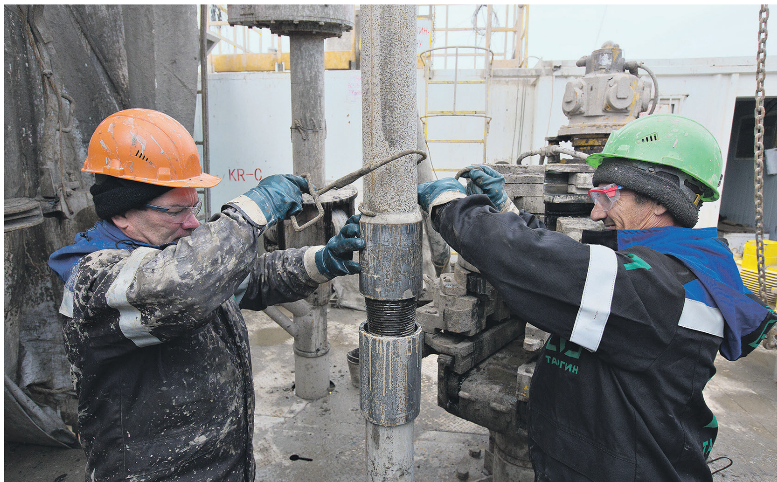
«Роснефть», которая последовательно консолидирует сервисные активы, после покупки «Башнефти» может рассматривать «Таргин» для приобретения напрямую или через одну из дочерних структур

Отставка Закирова произошла на фоне пересмотра условий