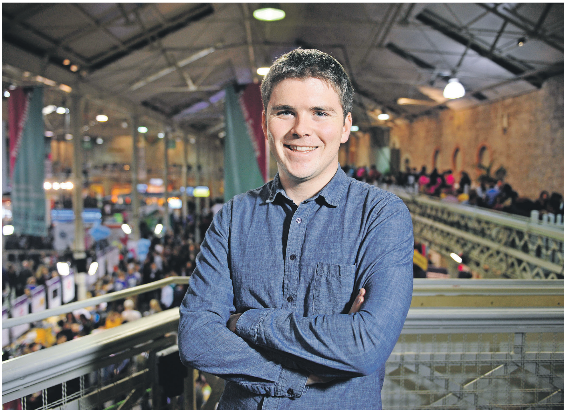
Джон Коллисон удивлял еще до того, как заработал миллиард. Все десять экзаменов на аттестат зрелости он сдал на «отлично» — это самый высокий результат за всю историю выпускных в Ирландии

Как Джон Коллисон стал самым молодым миллиардером в мире