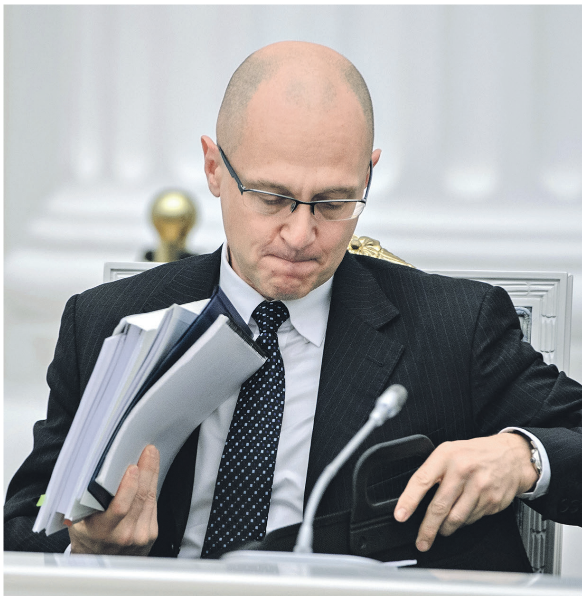
Сергей Кириенко (на фото) решил разделить кураторство выборов и текущей региональной повестки

Источник в Кремле сказал РБК, что решение назначить вместо заместителя по регионам