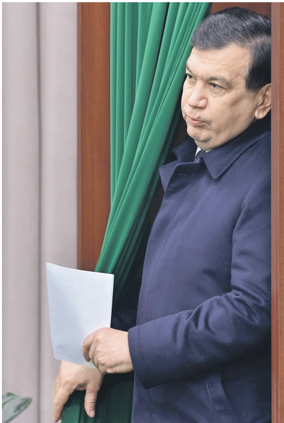
Шавкат Мирзиёев встречался с Владимиром Путиным и Дмитрием Медведевым, но о сближении Узбекистана с Евразийским экономическим союзом пока не говорится. Заметно потепление отношений Узбекистана с Таджикистаном и Киргизией

Мирзиёев, который исполняет обязанности президента с 8 сен-