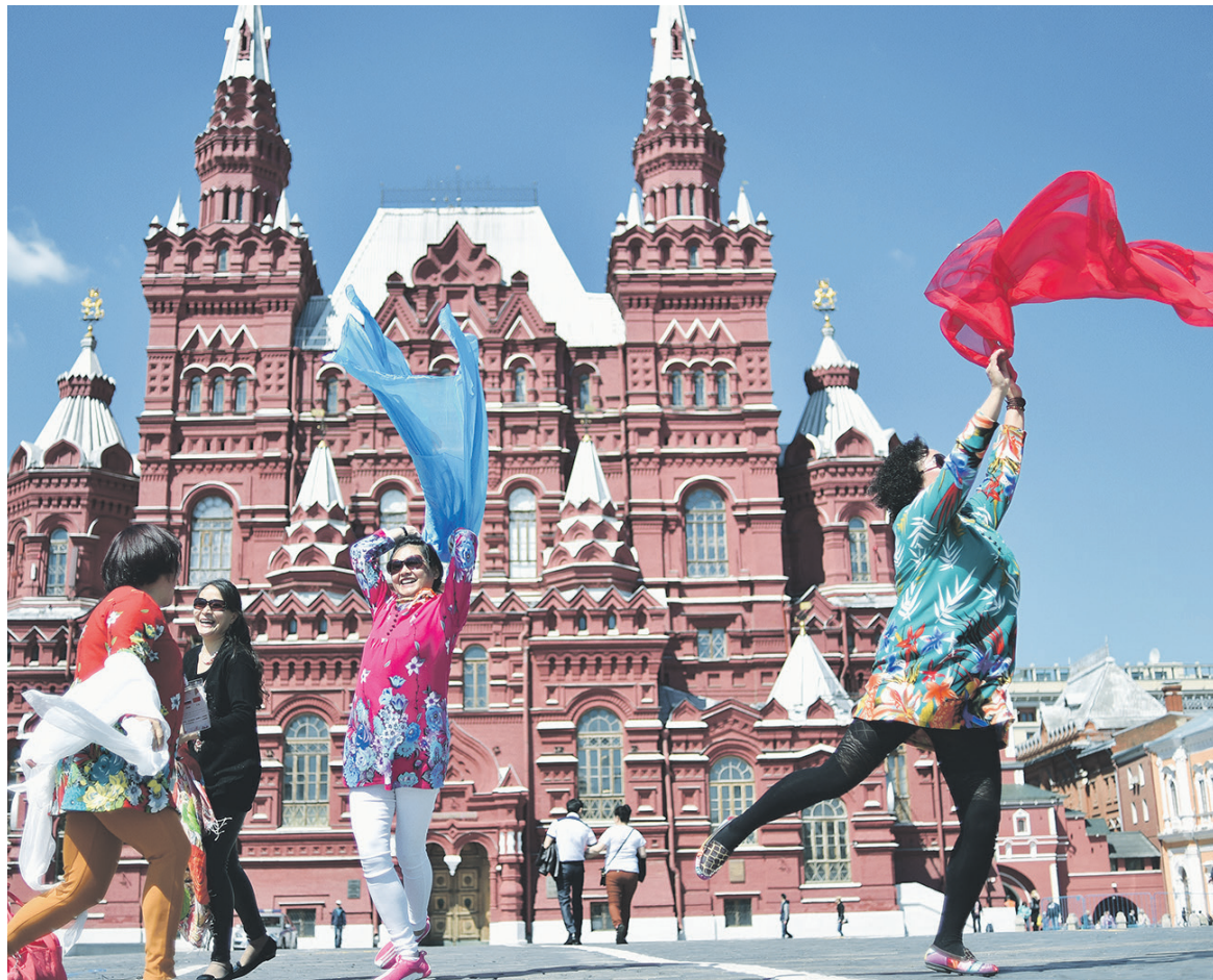
Туристы из Китая в среднем тратят в России около $530 в день, предпочитая приобретать часы, товары всемирно известных брендов, ювелирные изделия и оригинальную продукцию местного производства

Если еще год назад доля продаж иностранным туристам в общем объеме выручки составляла