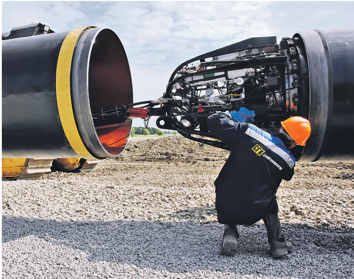
«Стройгазконсалтинг» не раскрывает структуру и общий размер долга. Но по данным источников РБК, компания должна Сбербанку более 35 млрд руб.

Представитель ВТБ, еще одного крупного кредитора подрядчика,