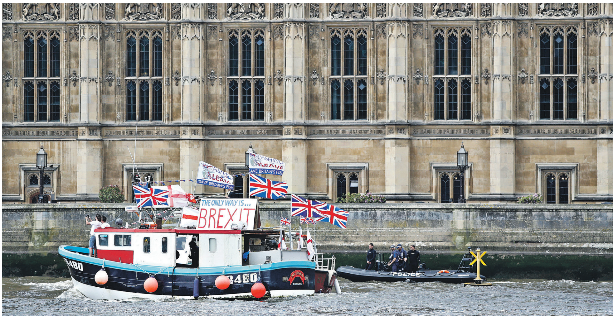
По словам главы бюджетного комитета Европарламента Жана Артюи, Великобритания может покинуть ЕС, но она не может избежать выполнения обязательств в рамках международного права

BREXIT Обязательства Великобритании перед ЕС оценили в €20 млрд