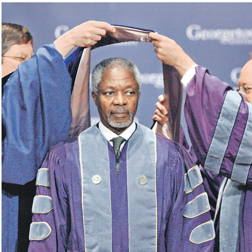
↑ Кofi Аннан был избран Генсеком ООН в 1997 году. Выходец из Ганы, в самой ООН он работал с 24 лет, еще будучи студентом. В этой организации Аннан трудился в ВОЗ, комиссариате по делам беженцев. В 2001 году ганец стал лауреатом Нобелевской премии мира. Аннан выступал против вторжения коалиции в Ирак в 2003 году