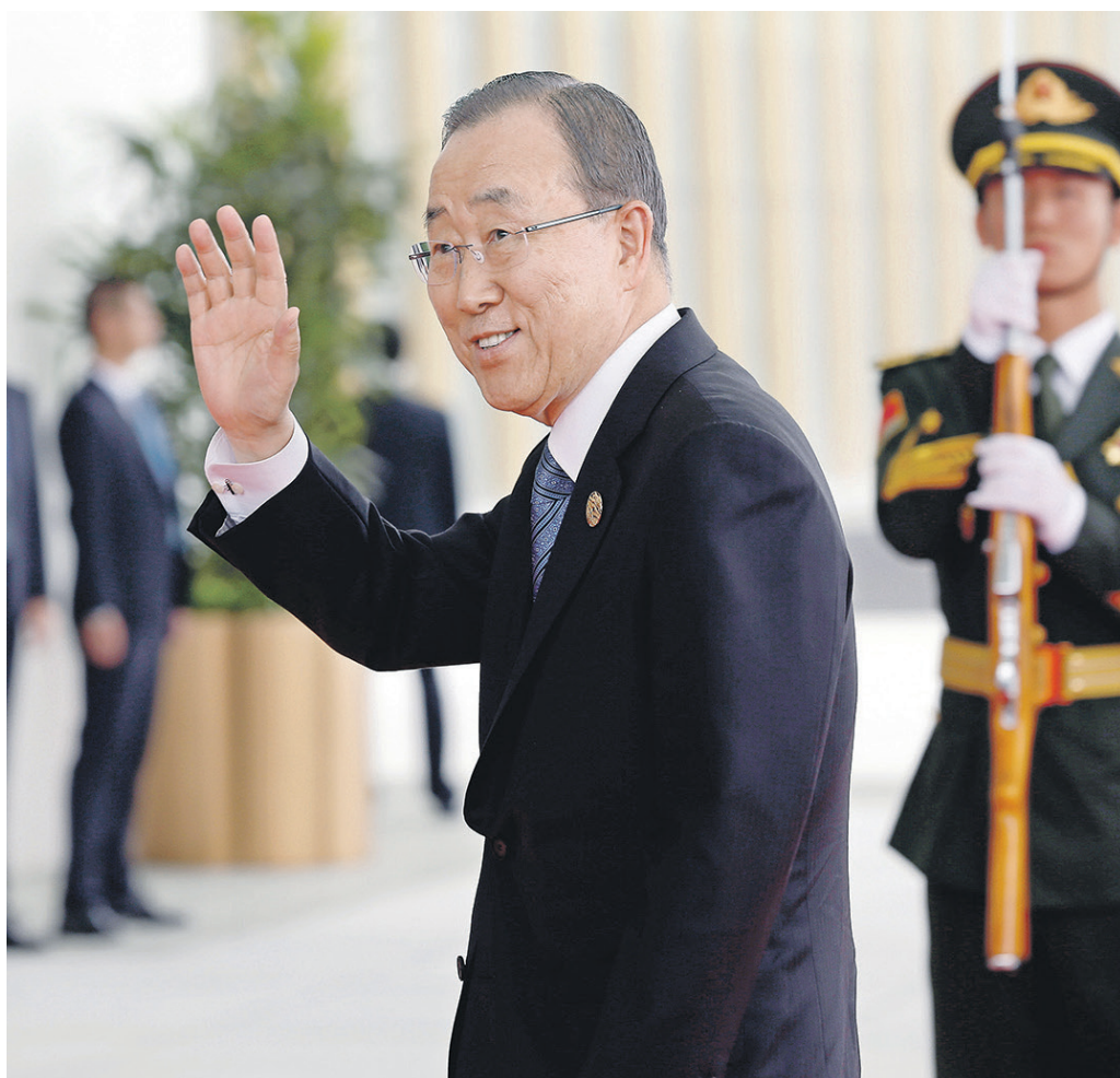
↑ Пан Ги Мун находился на посту Генсека ООН с 2007 года. На этой должности он последовательно занимал антивоенную позицию. В частности, выступил с осуждением воюющих сторон на Украине. До начала работы в ООН он возглавлял МИД Южной Кореи, а в 2017 году планирует избраться на пост президента страны