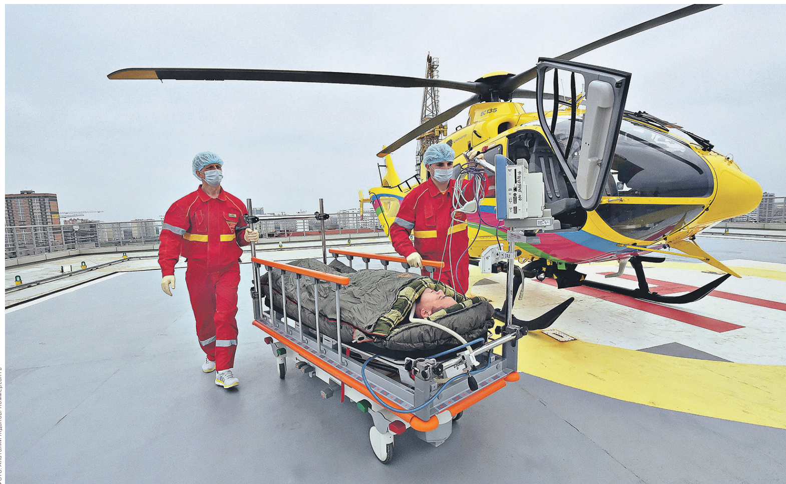
Пять масштабных проектов в сфере здравоохранения Минздрав планирует реализовать с 2019 по 2025 год

За 2012–2015 годы, по данным Минздрава, которые приводятся в проекте ведомства, младенческая смертность снизилась на 24,4%. Теперь министерство хочет выравнять показатели по регионам. На это предусмотрены средства, которые остались после реализации проекта по строительству 32 перинатальных центров; на этот проект из бюджета ФОМС и бюджетов регионов в 2014 году выделялся 81,6 млрд руб. Еще чуть