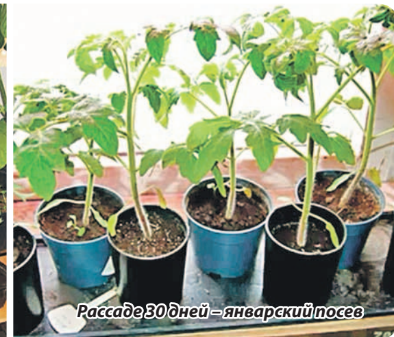
Рассада 30 дней – январский посев