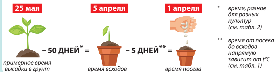
ПРИМЕР РАСЧЕТА СРОКОВ ПОСЕВА СРЕДНЕСПЕЛЫХ ТОМАТОВ