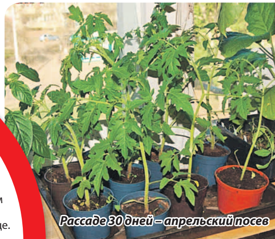
Рассада 30 дней – апрельский посев

Для получения качественной рассады нужна досветка. Даже на южном окне. Обратите внимание, досветка, но не догрев, поэтому для этой цели используют лампы холодного дневного света. Из прогрессивных ламп хороши специальные фитолампы или натриевые – их оранжевое или розовое свечение оптимально подходит растениям по спектру. Лампы включаем с 8–9 утра до 21 часа, независимо от того, пасмурно на дворе или светит солнце.