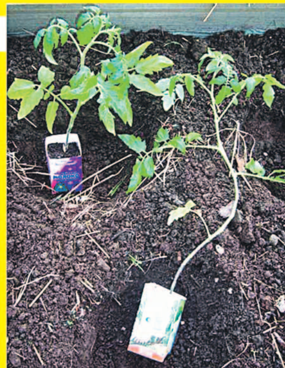
Эксперимент поставлен центром «Ваше плодородие», г. Уфа